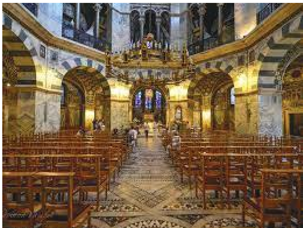
क्याथेड्रलको गोलाकार दलिनसहितको प्रार्थनाकक्ष