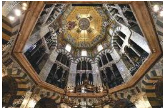
डोमको अष्टकोणे कलात्मक दलिन