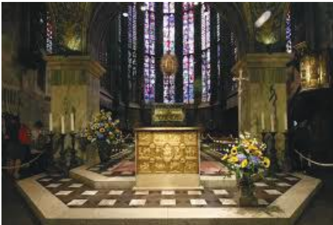
डोमभित्रको स्टेज (अल्टर)