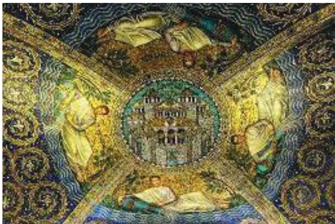
डोमभित्रको मोज्याक कलाकृति