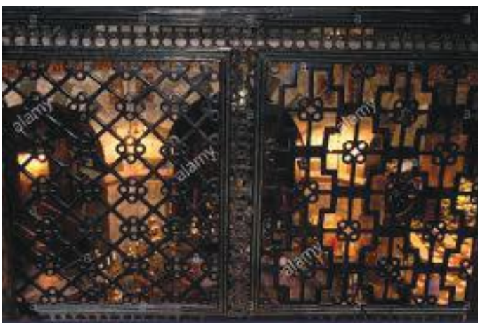
डोमभित्रको ढलोटाका कलात्मक रेलिड