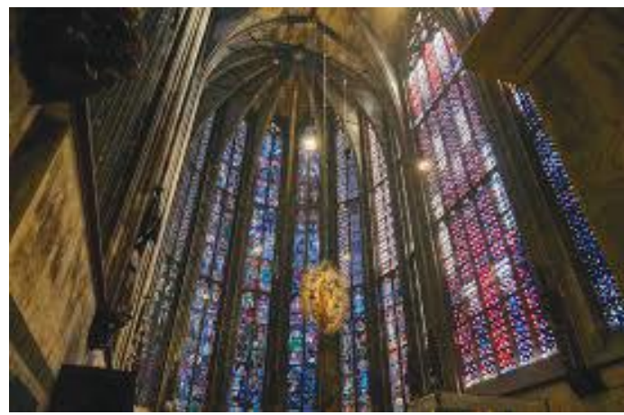
डोमभित्रको कलात्मक सिसाका भ्यालहरू