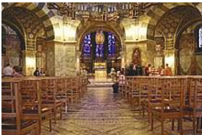
डोमभित्रको अष्टकोणे (ओटागोनल) कक्ष