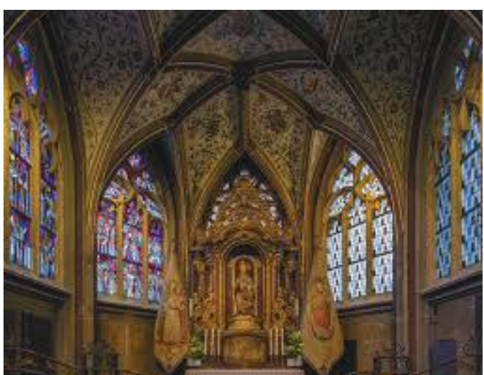
डोममा रहेको संगीत यन्त्र (कोर)

भोलिपल्ट जनवरी २०, २००८ का दिन बिहान ब्रेकफास्ट सकी करिव १० बजेतिर म जर्मनीको आखन शहरको क्याथेड्रल अवलोकन गर्ने र दिउँसो किण्डर मिसन भेर्कका पदाधिकारीहरूसँग क्याथेड्रल अगाडिको रेष्टुराँमा दिउँसोका खाना खाने कार्यक्रम भएअनुसार गेस्टहाउसबाट निस्की सोभै क्याथेड्रलतर्फ लागें।