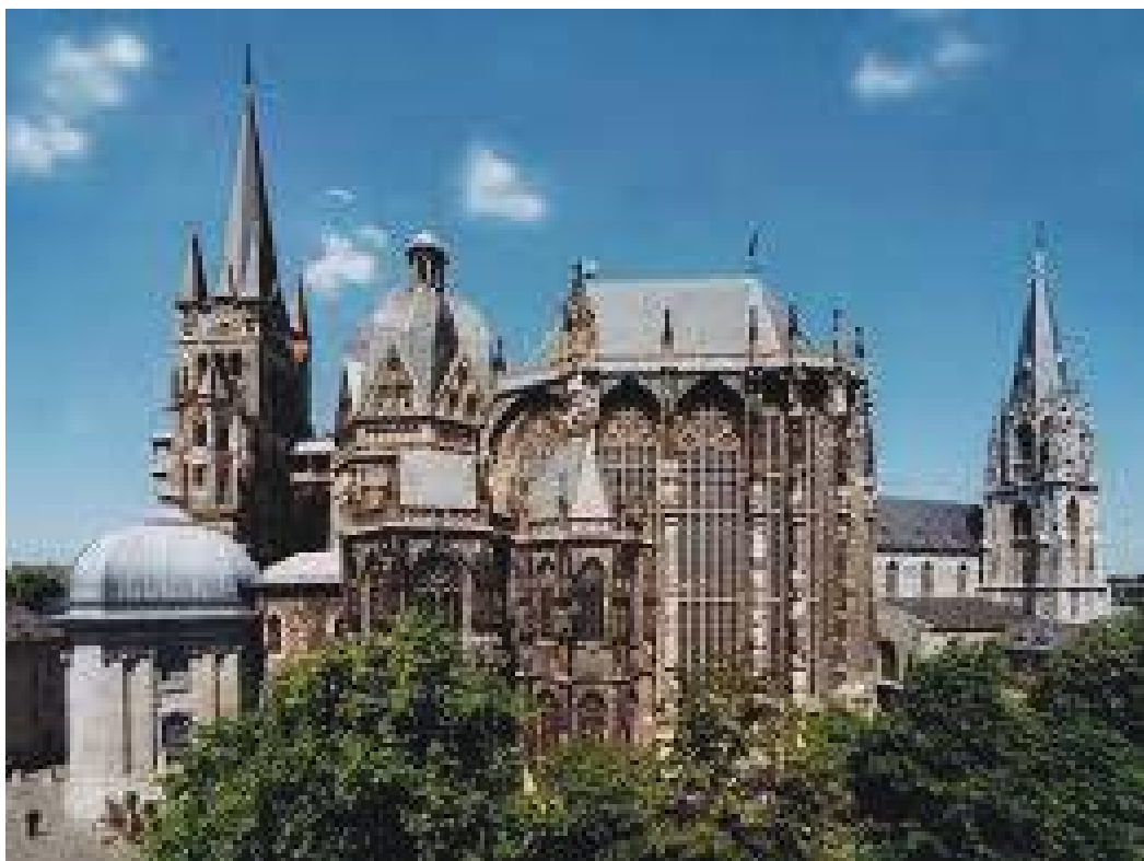
आखनको क्याथेड्रल बाहिरबाट हेर्दा