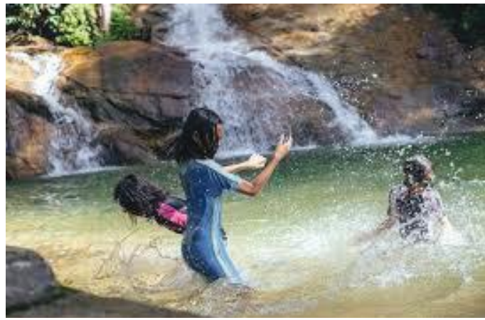
गुफाको छेउमा रहेको मनोहर भरना