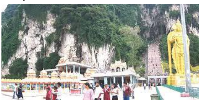
गुफा बाहिर पर्यटकहरू

५ डिसेम्बर २०१६ को दिन करिब ११ बजेतिर हामी क्वालालम्पुर विमानस्थल अवतरण गरी टुइन टावर (पेट्रोनास) को नजिकैको दुई बेग्लावेग्ले होटलमा आफूहरूलाई व्यवस्थित गरी होटल बाहिरको एक रेस्तराँमा खाना खाई