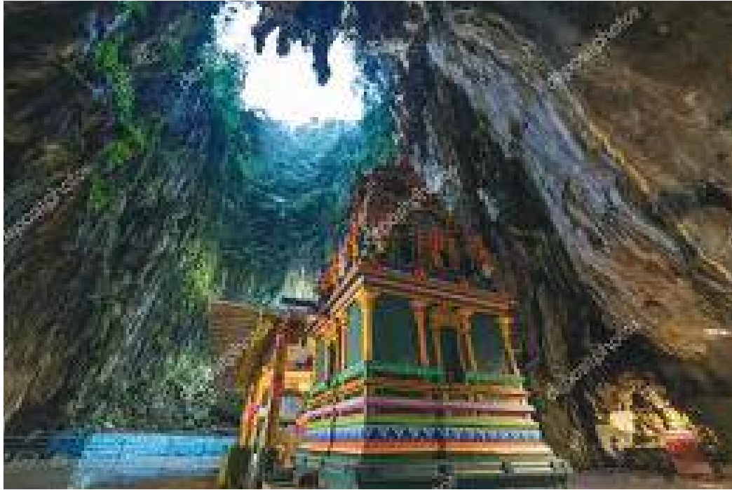
गुफाभिन्नबाट देखिने बाहिरको नीलो आकाश