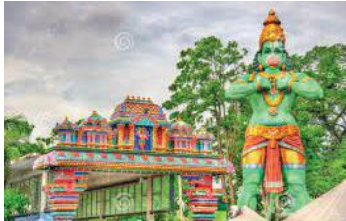
रामायण गुफाको प्रवेशद्वारमा रहेको हनुमानको मूर्ति