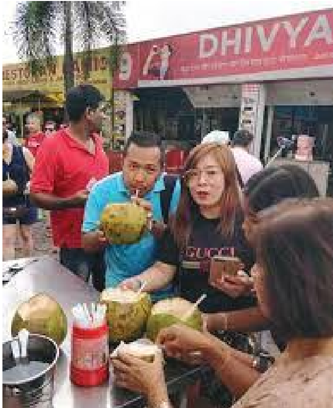
गुफा बाहिरको पसलमा नरिवलको पानी खाँदै पर्यटकहरू