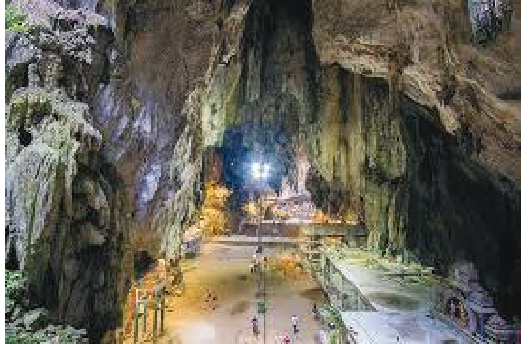
गुफाको भित्री भाग र त्यहाँ रहेका मन्दिरहरू