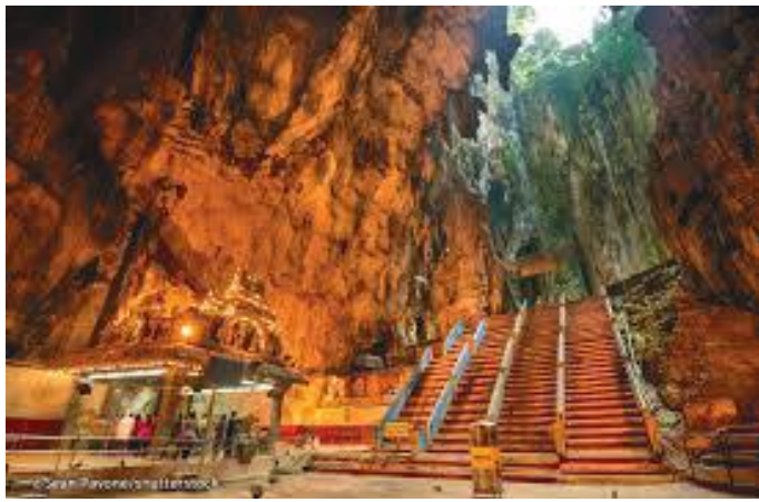
माथि गुफामा पुगिने सिँडी