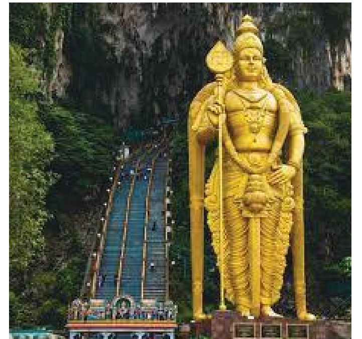
गुफा चढ्ने सिँडीको दाहिनेपट्टि रहेको कार्तिकेयको विशाल मूर्ति