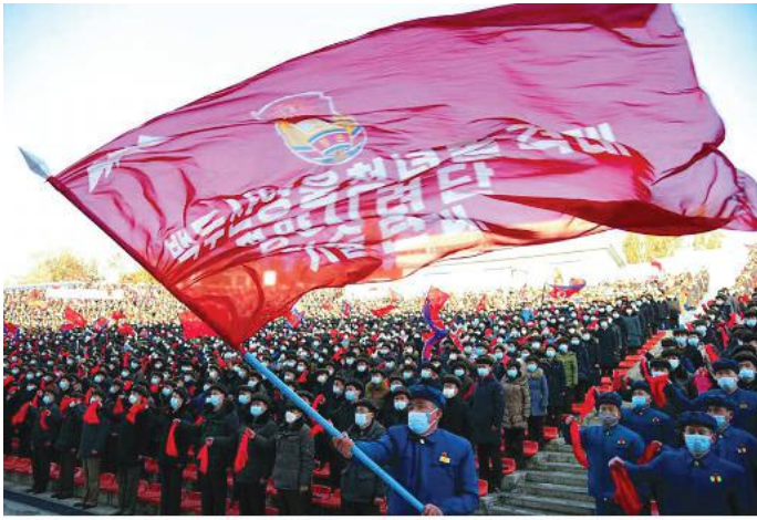
Youth shock brigade members and other young people in various parts of the country volunteering for the capital city construction

fully displaying the mettle of the Korean young people who are prepared to brave fire and water in response to the call of the Party and motherland and who love waging the revolution and working.