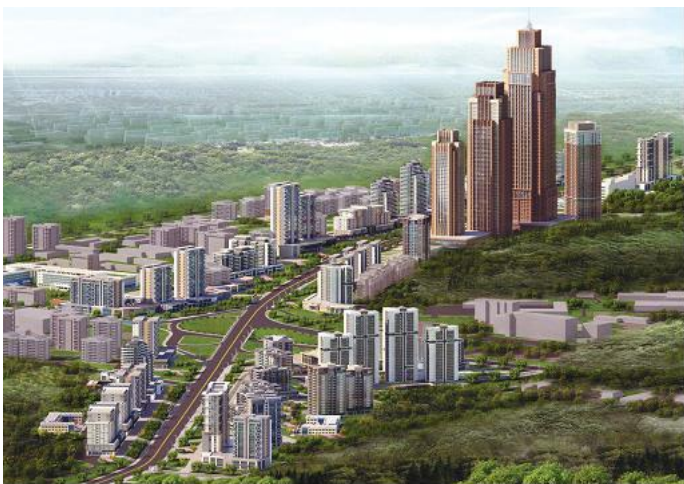
Artist's impressions of a new street to be built in the Sopho area at the northern gateway to Pyongyang