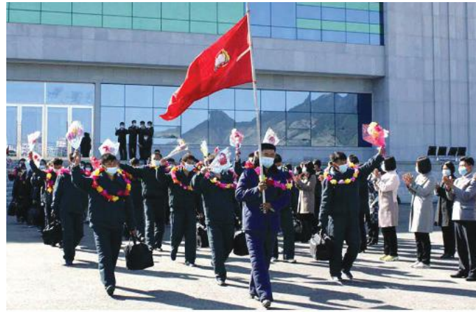
Young people leaving for the construction of a new street in Pyongyang amid warm send-offs