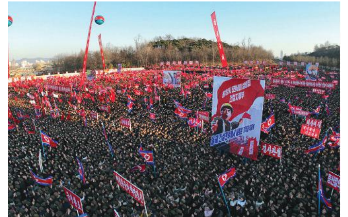
Young people at the groundbreaking ceremony for building a new street in the Sopho area in Pyongyang