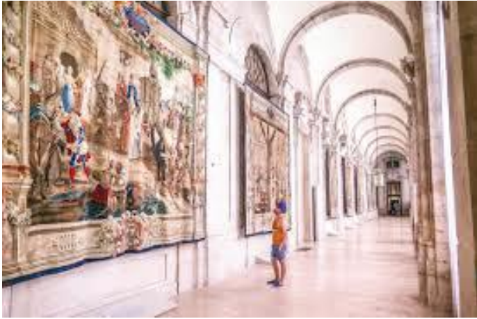
दरबारभित्र भित्तामा टाँगिएका बहुमूल्य कलाकृतिकरु