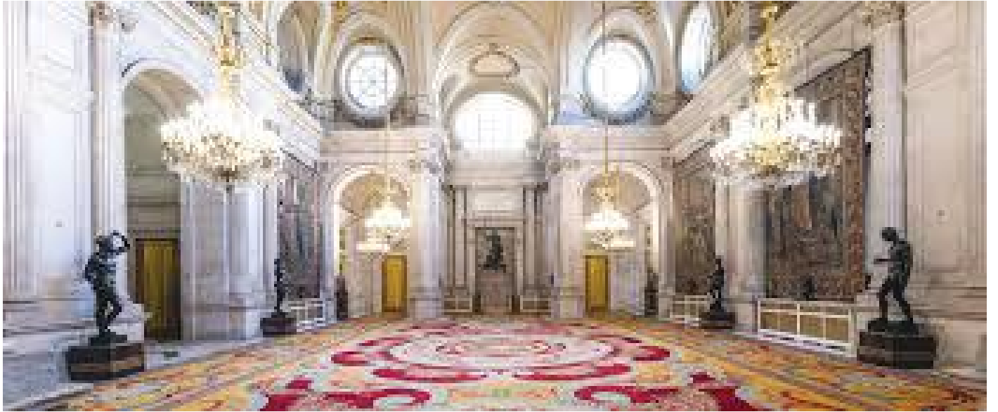
दरबारभित्रको मुख्य बैठक