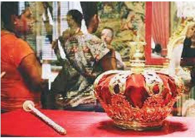
दरबारभित्र प्रदर्शनीमा राखिएको स्पेनी राजाको श्रीपेच