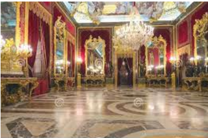
राजपरिवारको चार फोटोसहितको बैठक कक्ष