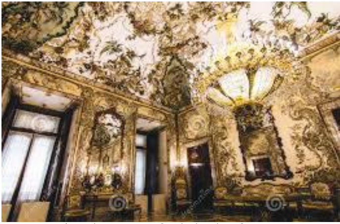
बैठकको दलानमा गरिएको फ्रेस्को ललितकला