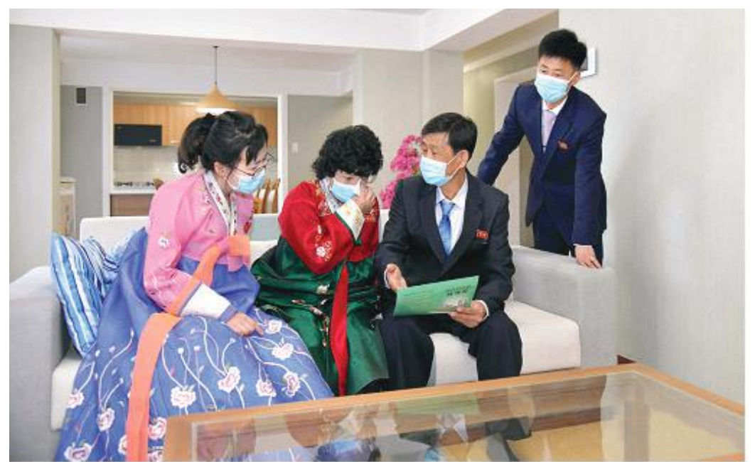
A worker couple after moving into a new luxury house

In the country the lives and health of the working class are a matter of national concern, a matter of paramount importance. The