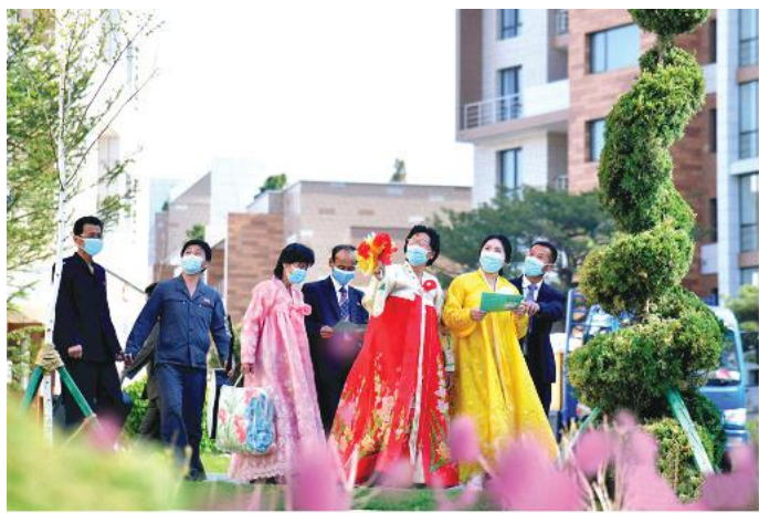
Working people moving into their new houses in the Pothong Riverside Terraced Houses District in April last year

Today they are setting up modern factories in various parts of the country and stepping up the work of putting the economy on a Juche-oriented, modern,