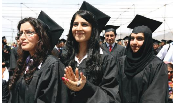
'देशभरका सार्वजनिक र निजी विश्वविद्यालयलाई महिला विद्यार्थीको प्रवेश रोकन' निर्देशन दिएको थियो । नगरेको जनाएका थिए । त्यस्तै, अफगानिस्तानका लागि राष्ट्रसंघीय विशेष दूतले समान शिक्षाको अधिकार