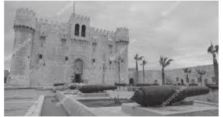
किल्लाभित्र प्रदर्शनमा राखिएका तोपहरू