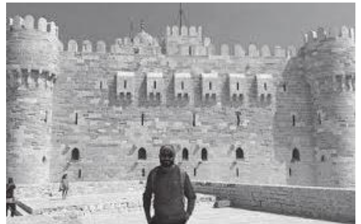
किल्लाको भित्री भाग यस्तो रहेछ