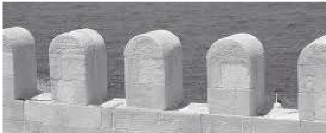
किल्ला वरिपरिको पर्खाल