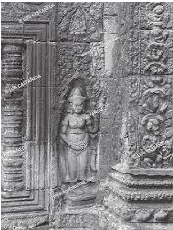
किल्लाभित्रको पुरातात्विक संग्रह