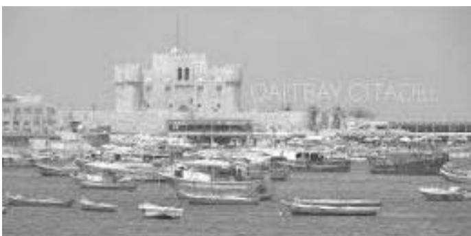
किल्ला बाहिरको खाडीमा सञ्चालनमा रहेका डुंगाहरू