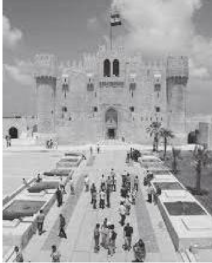
किल्लाको प्रवेशद्वारमा पर्यटकहरू