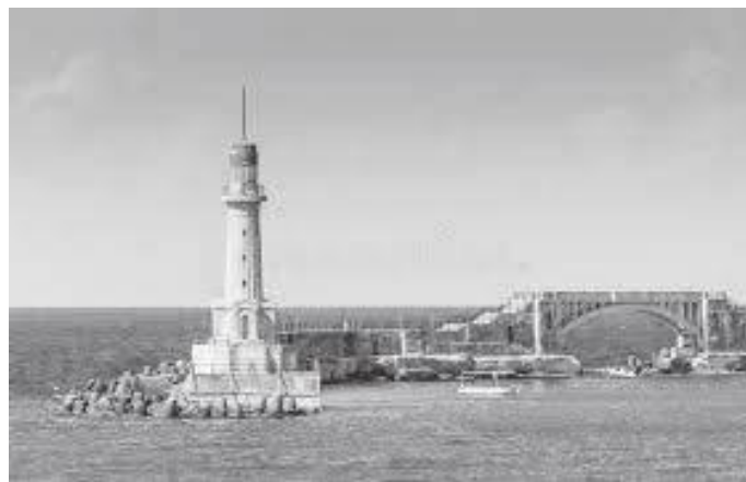
किल्लासँगै रहेको प्राचीन लाइटहाउस