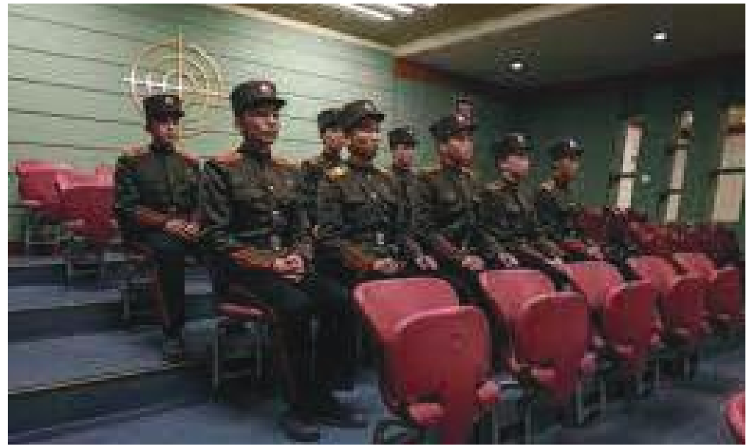
सैनिक शिक्षा लिँदै कोरियाली युवाहरु