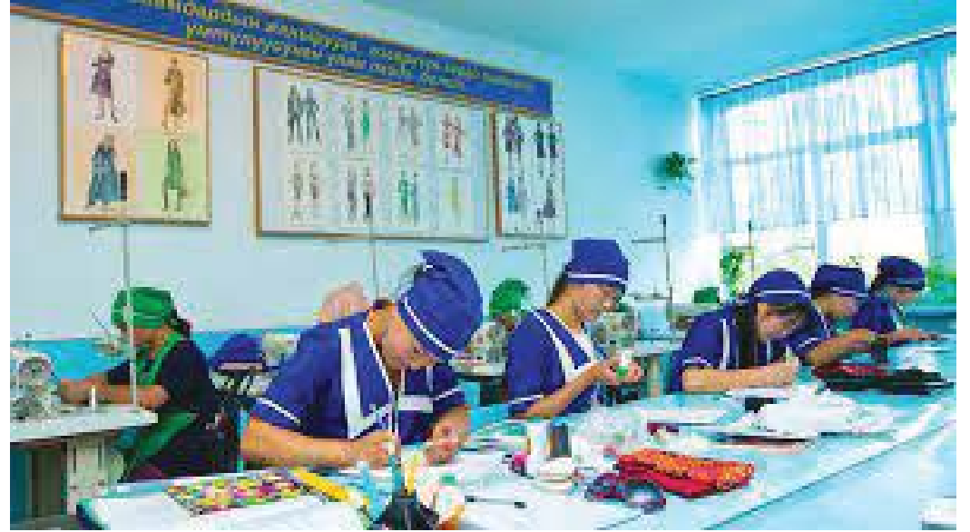
व्यावसायिक तालिम लिँदै कोरियाली युवतीहरु