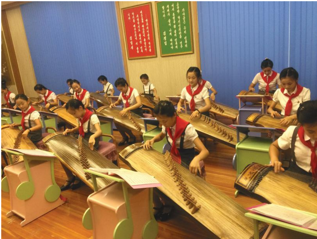
संगीतको कक्षा लिँदै बालबालिकाहरु