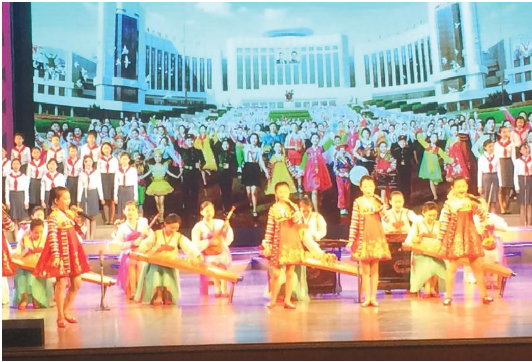
नृत्य एकेडेमीबाट तालिम प्राप्त बालबालिका