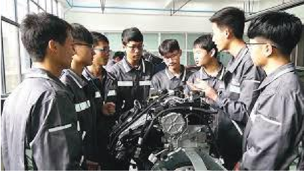
व्यावसायिक तालिम लिँदै कोरियाली युवाहरु