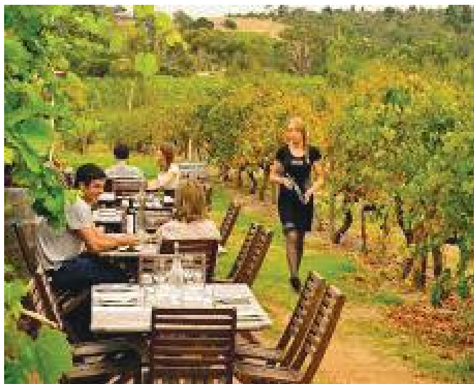
फर्मभित्र रहेको रेस्टुराँमा पर्यटकहरू

सेन्ट भिन्सेन्टको खाडीबाट आउने ताता र चिसा हावाको संगमस्थल भएको अनि फरक फरक उचाइमा रहेको उपत्यका जस्ता वातावरणीय विविधताको कारण पनि यहाँ उत्पादन हुने अंगुरहरूमा गुणात्मक विविधता पाइने कुरा बताइँदो रहेछ। त्यहाँको हावापानी, माटोको गुणमा भएको विविधता, नजिकै रहेको पर्वतीय श्रृंखला, सामुद्रिक प्रभाव आदि जस्ता कुराले माक्लारेन उपत्यकाको अंगुर अनि त्यसबाट बनेको वाइनलाई विश्व प्रख्यात बनाएको कुरामा उनीहरू गर्व गर्दा रहेछन्।