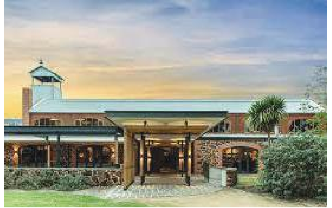
माक्लारेन उपत्यकामा रहेको धेरैमध्ये एक वाइन कारखाना

भोलिपल्ट मार्च १३ को एकाबिहानै ब्रेकफास्ट गरी ९ बजे नै हामी सबै आआफ्नो अतिथिदाताको कारमा आडेलाइडको नजिकै ३० किलोमिटरको दूरीमा रहेको माक्लारेन उपत्यका अवलोकन गर्ने उद्देश्यले त्यतातिर लाग्यौं। ७० भन्दा बढी अंगुर फार्मसहित