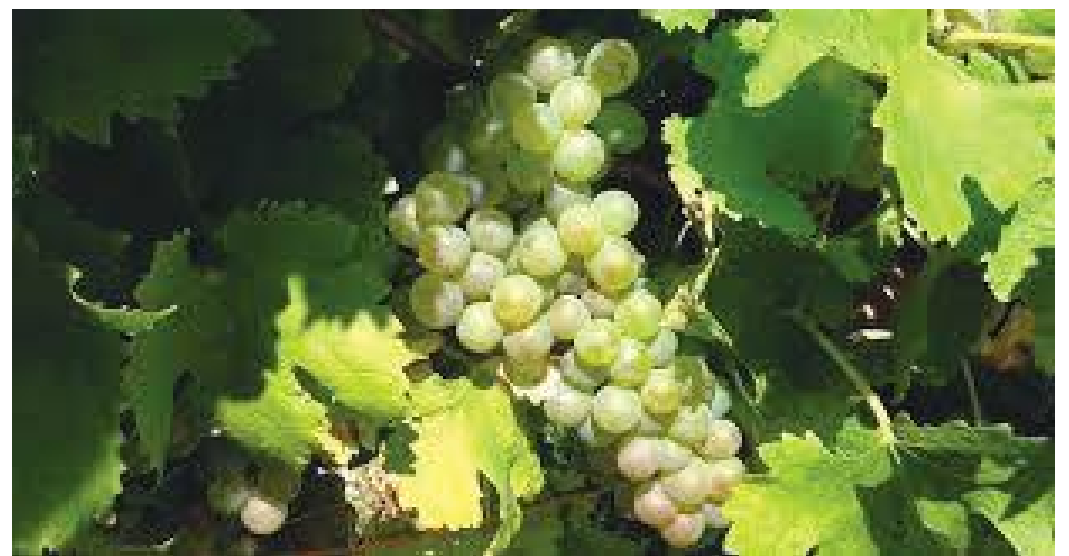
फार्ममा फलेका सेता अंगुरहरू