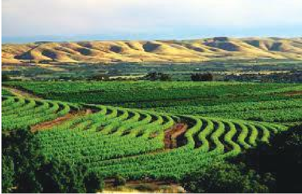
होचा पर्वतीय श्रृंखलाको काखमा रहेको माक्लारेन उपत्यका र अंगुरको बगैँचा