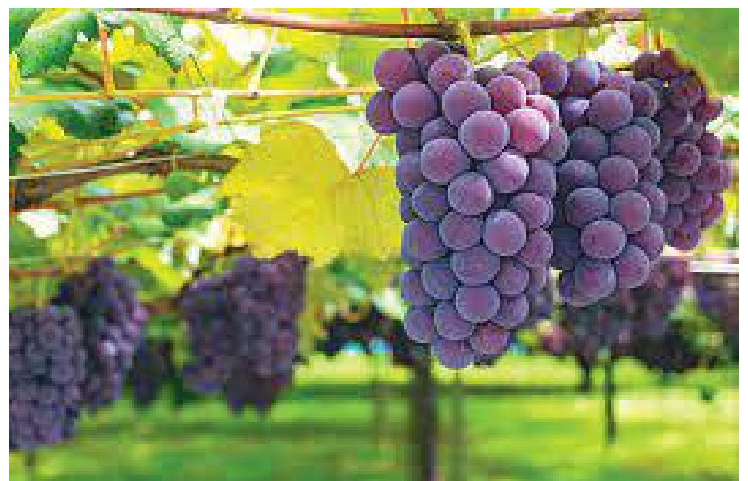
फार्ममा फलेका राता अंगुरहरू

त्यहाँ उत्पादन हुने वाइनका ब्राण्डहरूमा मुख्यतः सिराज (Shiraz), क्याभरनेट सोभिग्नो (Cabernet Sauvignon) ग्रिनास (Grenache) र सारडोन्नी (Chardonnay) हरू पर्दा रहेछन्। हाम्रो त्यस दिनको दिउँसोको खाना त्यहाँको एक रेस्टुराँमा भयो। दिनभर मज्जाले माक्लारेन उपत्यकामा बिताइ ४ बजेतिर हामी आडेलाइड फर्कियो। यस प्रकार हाम्रो आडेलाइडको चार दिनको बसाइ सम्पन्न भएको थियो।