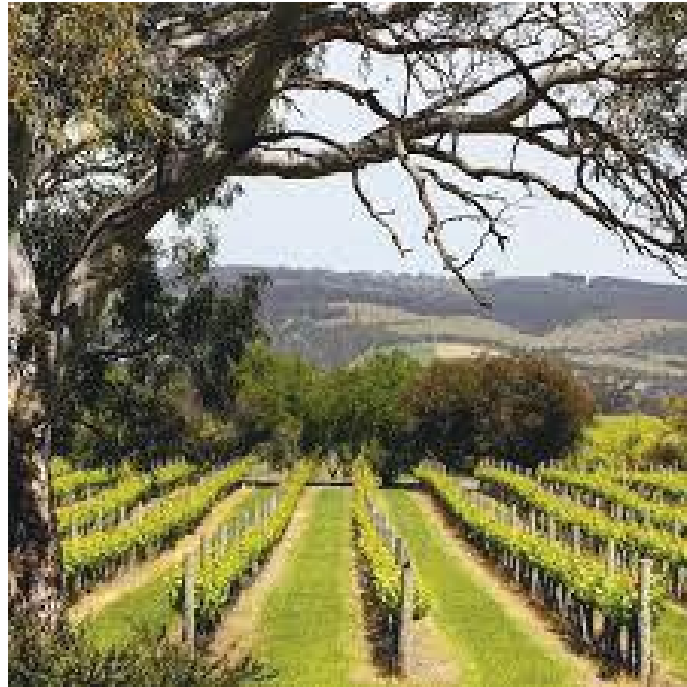
व्यवस्थित रूपमा गरिएको अंगुरको खेती

न्यानो सुख्खा हावापानी, माथि पहाडी श्रृंखला अनि तल