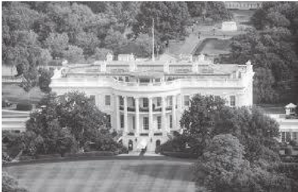
ह्वाइट हाउस परिसरमा देखिने हरियाली वातावरण

अप्रिल ४, २००३ को दिनभर हामी क्यापिटोल बिल्डिङ र त्यसको वरपर अवलोकन गर्नमा नै व्यस्त भयौं र बेलुकी ५ बजेतिर हामीलाई आतिथ्य दिने मित्रको डेरामा फर्कियो। रमतीको ट्रेन दिनभरको अवलोकनबाट हामी अलिकति थकित त छँदै थियो। मित्रहरूका साथ नेपाली खाना खाई गफसफ गर्दा रातिको १० बजिसकेको थियो। भोलिपल्ट बिहान हल्का नास्ता र चिया खाई हामी अमेरिकी राष्ट्रपतिको कार्यालय तथा निवास ह्वाइट हाउस अवलोकन गर्न त्यतातिर लाग्यौं।