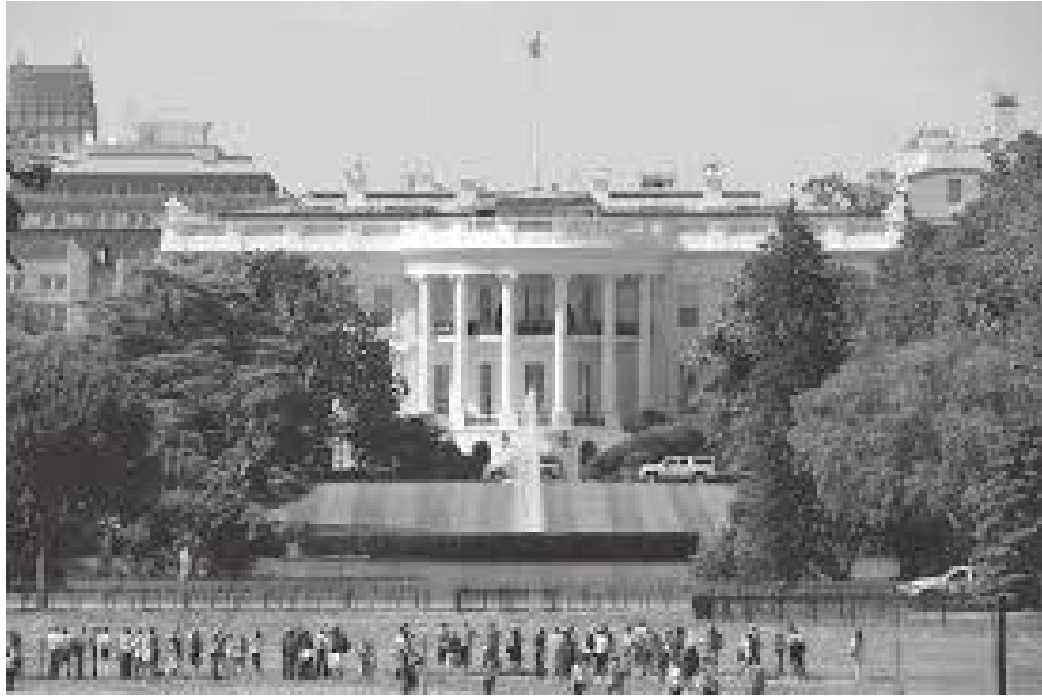
ह्वाइट हाउस अवलोकन गर्न जाने पर्यटकहरूको घुइँचो