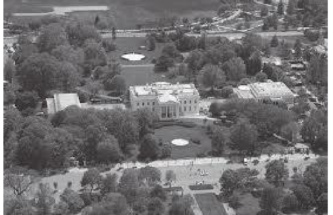
माथिबाट हेर्दा ह्वाइट हाउस परिसर