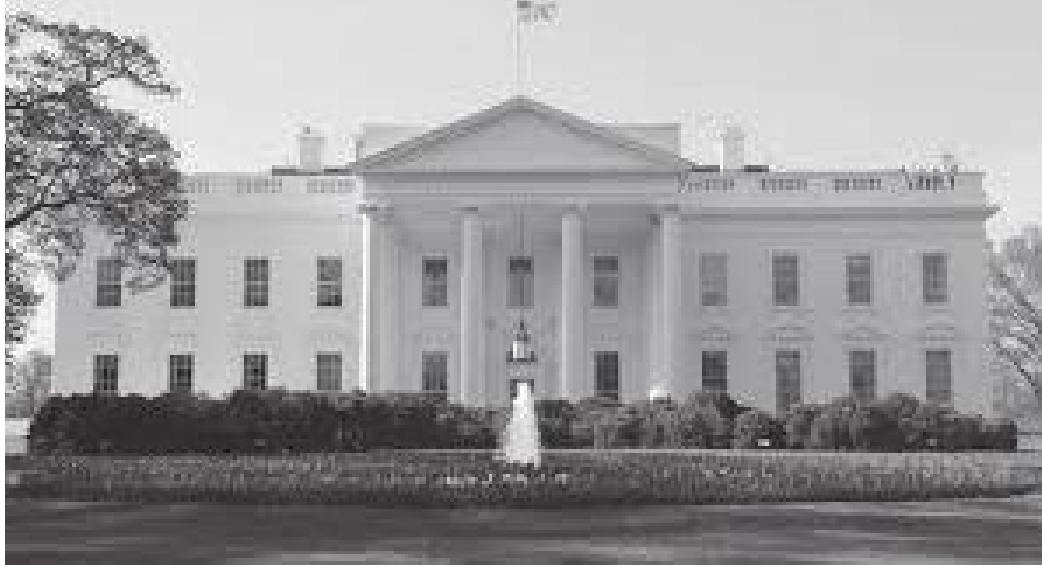
अगाडिबाट हेर्दा ह्वाइट हाउस