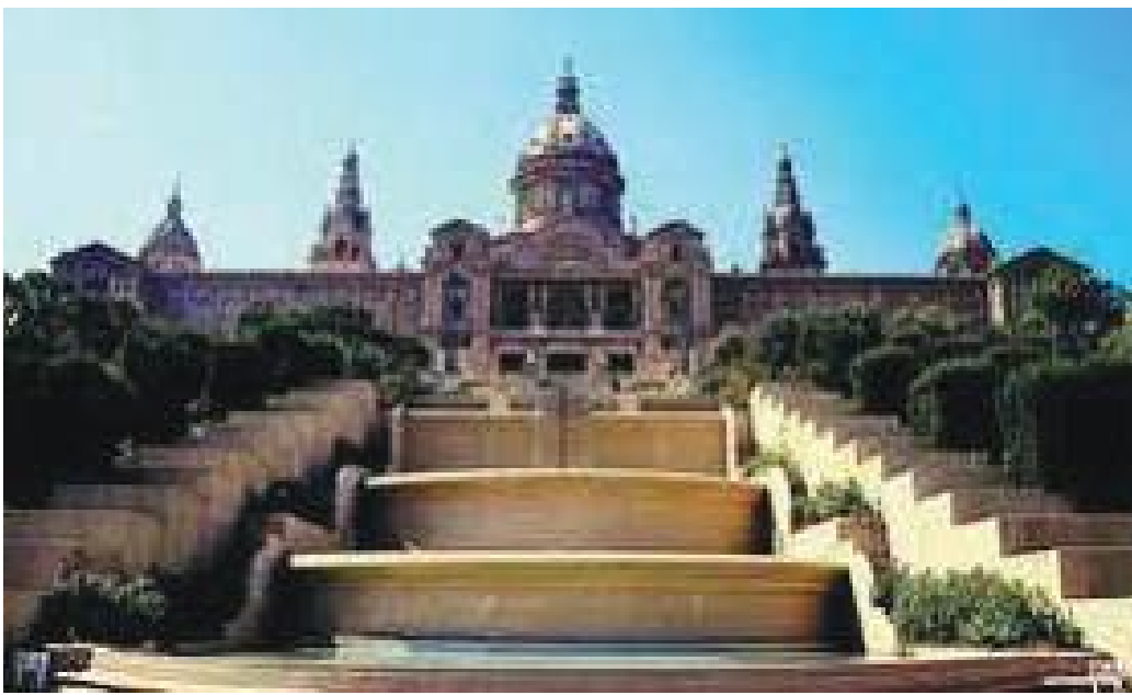
दुवैतिर खुडकिला अनि बीचमा पानीको फोहोरासहितको नहर