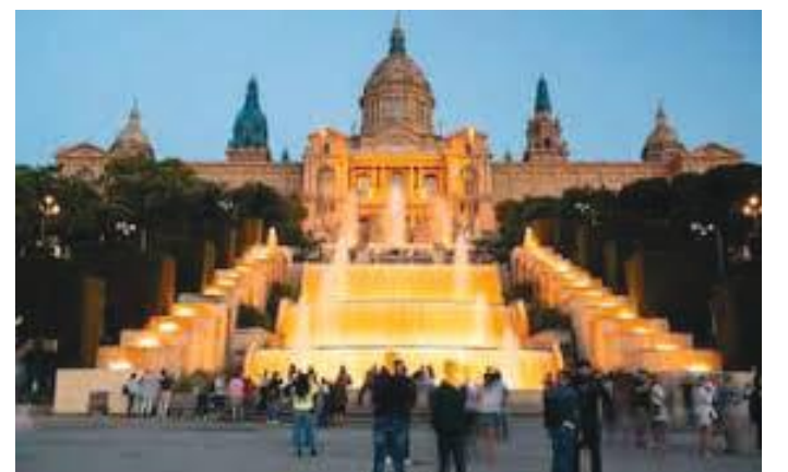
म्युजियम परिसरमा पर्यटकहरू साँझको बेला

हावा खाने अनि घुम्ने थलो भएको हुँदा हामी त्यहाँ पुग्दा यति धेरै मानिसहरू देख्यौं कि भण्डै हाम्रो शिवरात्रिको बेलाको जस्तो। म आफू इटालियन भाषा बुझ्ने र स्पेनी र इटालियन भाषा अलि अलि मिल्ने हुँदा हामीले त्यहाँ यसो भलाकुसारी गर्दा के थाहा पायौं भने त्यहाँका वासिन्दा कातालानीहरू आफूलाई स्पेनिशभन्दा पनि कातालानी भन्ने रुचाउँदा रहेछन् र स्पेनबाट विखण्डन भई कातालोनिया स्वतन्त्र हुनुपर्छ भन्ने प्रवल भावना रहेको हामीले महसुस गर्नुभयो। हुन पनि त्यहाँ कतै कातालोनिया भण्डा फहराएको पनि देखियो। बेलुका भएको कारण हामी म्युजियमभित्र प्रवेश गरी अवलोकन गर्ने कुरा पनि भएन। बाहिरवाटै हेर्नुभयो।