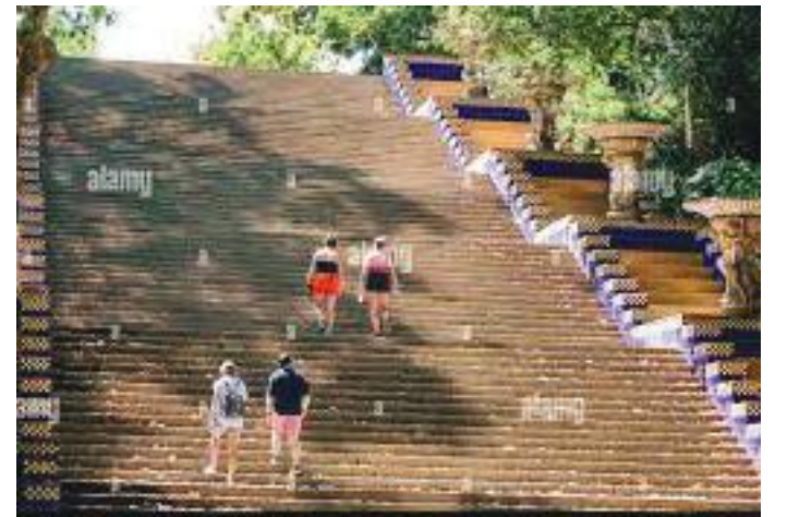
कातालोनको म्युजियमसम्म पुग्ने खुडकिला