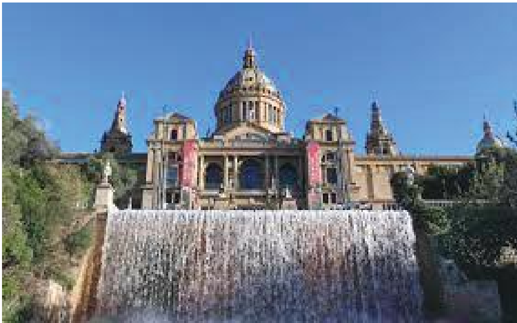
खुडकिला बीचको भरनासहितको नहर