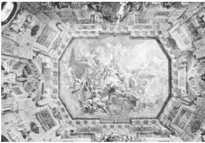
दरबारको दलिनमा गरिएको फ्रैस्को कलाकृति