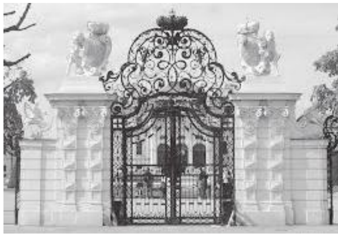
दरबारको फलामले बनेको मुख्य प्रवेशद्वार