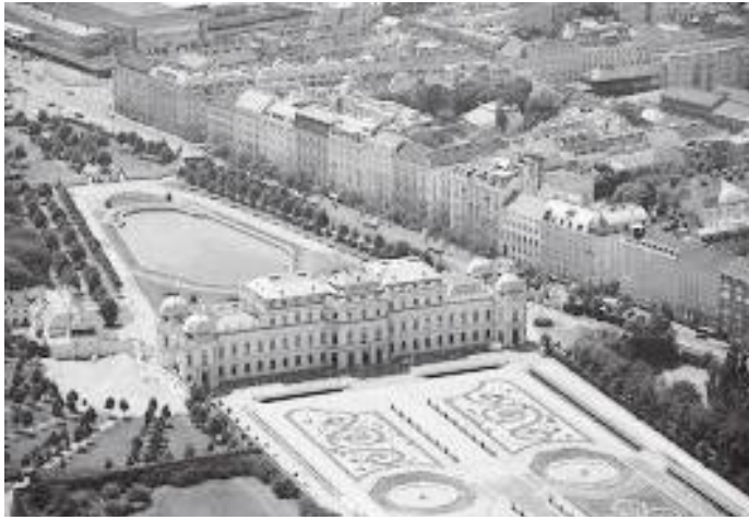
माथिबाट हेर्दा माथिल्लो दरबारको अगाडिको भाग र पछाडिको पोखरी