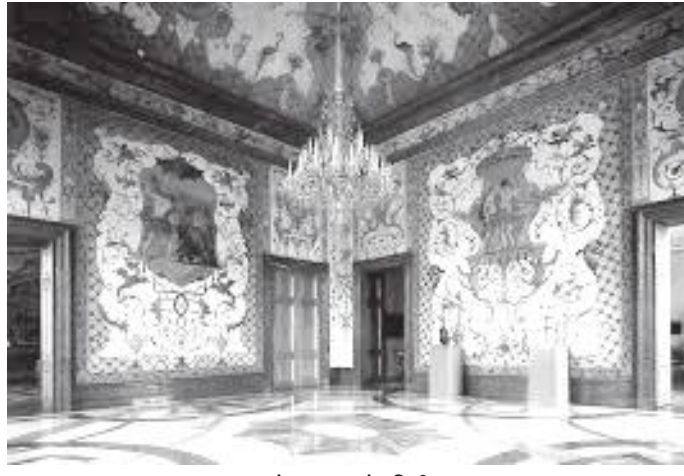
तल्लो दरबारको भित्री भाग