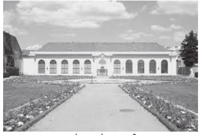
तल्लो दरबारको सुन्तला बगैचा

सान स्टेफान क्याथेड्रल अवलोकन गरिसक्दा दिनको १२:३० भएको थियो। अझै आफूसँग ५ घण्टाजति फुर्सदको समय भएको हुँदा भियनामा रहेको विश्व विख्यात बेलभेदेरे दरबार, आर्ट ग्यालेरी (म्युजियम) र बगैचा हेर्ने विचार गरी क्याथेड्रलबाटै भूमिगत शहरी रेल (मेट्रो) चढी करिब २५ मिनेटमा बेलभेदेरे दरबार पुगें। परिसरमा माथिल्लो र तल्लो गरी दुई ऐतिहासिक दरबारहरू रहेछन्।