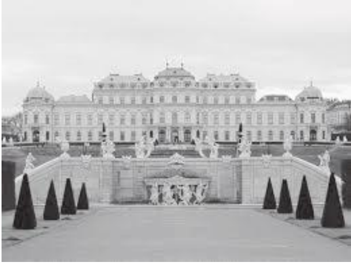
बेलभेदेरेको माथिल्लो दरबारको अगाडिको भाग यस्तो रहेछ