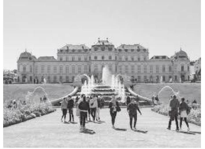
दरबार परिसरमा रहेको फोहोरा र भर्ना