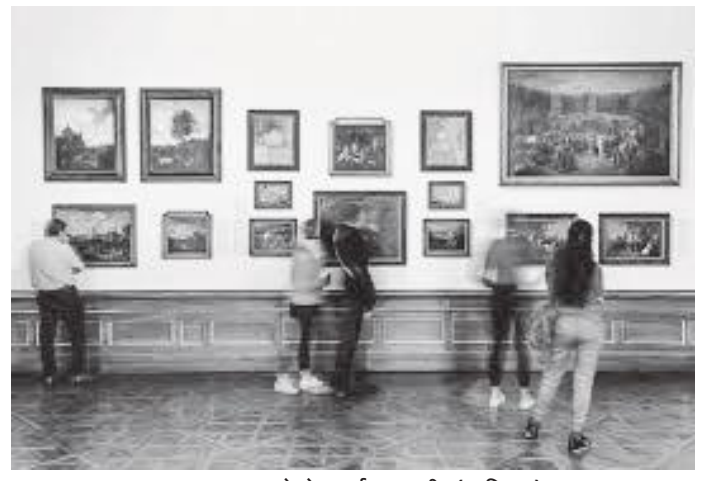
दरबारमा रहेको आर्ट ग्यालरी (म्युजियम)