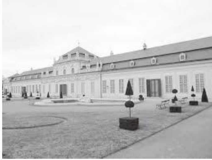
बेलभेदेरेको तल्लो दरबार अगाडिबाट हेर्दा