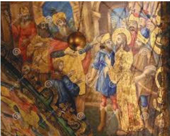
चर्चभिन्नको प्यासन अफ जेसस नामक तैलचित्र

इतिहास खोतल्दै जाँदा सन् ७० को जेरुसेलम घेराउ (Siege of Jerusalem) पछि भएको पहिलो रोमन