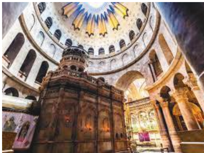
चर्चको भित्री गज्जर (सापेल)