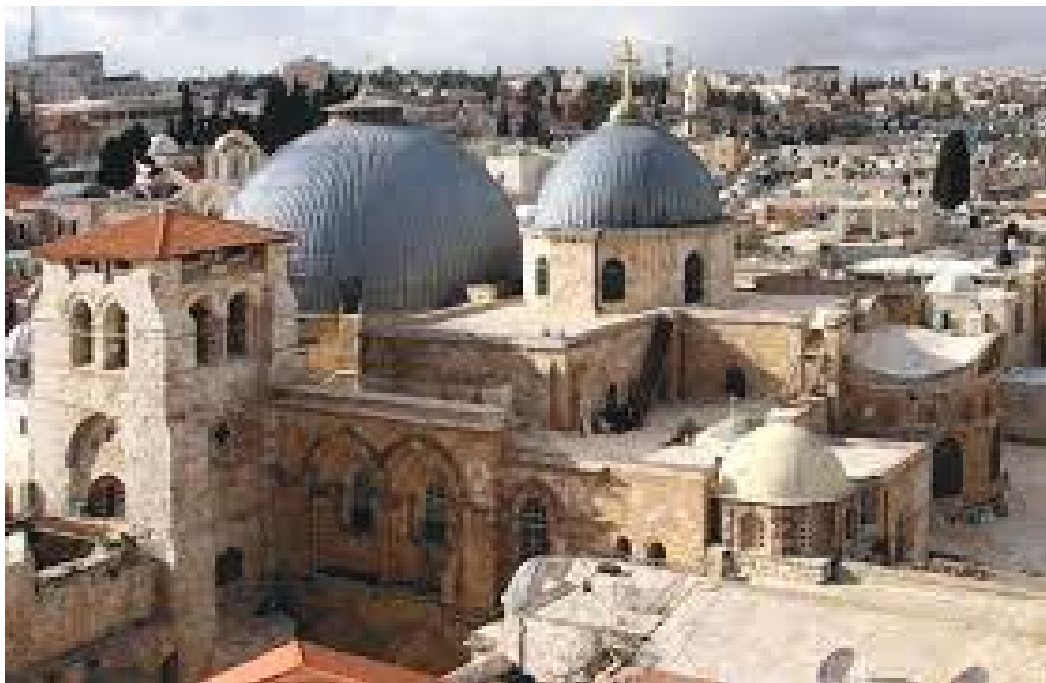
बाहिरबाट हेर्दा पवित्र सेपुलक्रे चर्च