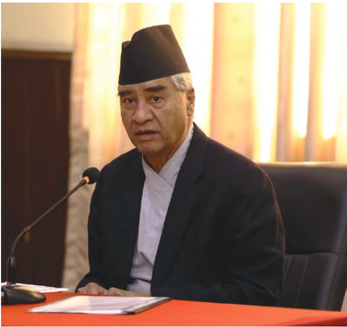
देउवाले पहिलो पटक भारतको भ्रमण गर्न थालेका हुन् । यसअघि उनी भारतका प्रधानमन्त्री नरेन्द्र मोदीको गृहारज्य

नारायण खड्का, ऊर्जामन्त्री पम्फा भूसाल र अन्य केही मन्त्री र विभिन्न मन्त्रालयका सचिवहरू सहभागी हुनेछन् । भ्रमणका क्रममा प्रधानमन्त्री देउवाले भारतीय उपराष्ट्रपति बेकैया नायडुसँग पनि भेट गर्ने कार्यक्रम छ । भारतका राष्ट्रपति रामनाथ कोविन्द नेदरल्यान्डस र तुर्कमेस्तान भ्रमणमा गएकाले उपराष्ट्रपतिलाई भेट्ने कार्यक्रम निश्चित गरिएको हो । प्रधानमन्त्री देउवाले शनिवार भारतीय समकक्षी नरेन्द्र मोदीसँग भेटवार्ता गर्नेछन् । उनले भारतीय विदेशमन्त्री उस जयशंकर र राष्ट्रिय सुरक्षा सल्लाहकार अजित डोभालसँग पनि भेटवार्ता गर्ने कार्यक्रम छ । दिल्लीमा उच्चस्तरीय भेटवार्ता सकेर देउवा भारतको ऐतिहासिक धार्मिक नगरी बनारस जानेछन्, त्यहाँ उनले नवनिर्वाचित मुख्यमन्त्रीसँग भेटवार्ता गर्नेछन् । रक्षामन्त्री राजनाथ सिंह र रेलमन्त्री तथा सूचना प्रविधि मन्त्री अश्विनी वैष्णव भने प्रधानमन्त्री मोदीको प्रतिनिधिमण्डलमा सहभागी हुने भारतीय कूटनीतिक स्रोतले जनाएको छ । पाँचौँ पटक प्रधानमन्त्री भएपछि