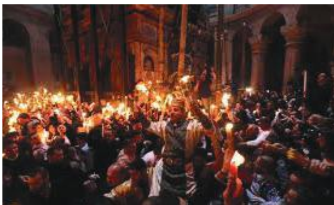
क्रिस्चियन पिल्ग्रिमेजको चित्र