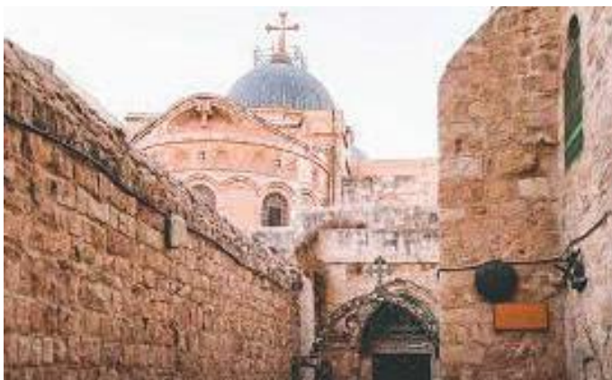
चर्चसम्म पुग्ने गल्ली भिया डोलोरोसा