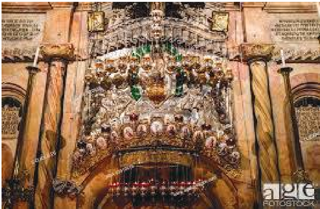
चर्चको भित्तामा रहेको रातो सिंगमर्मरकाका खोप