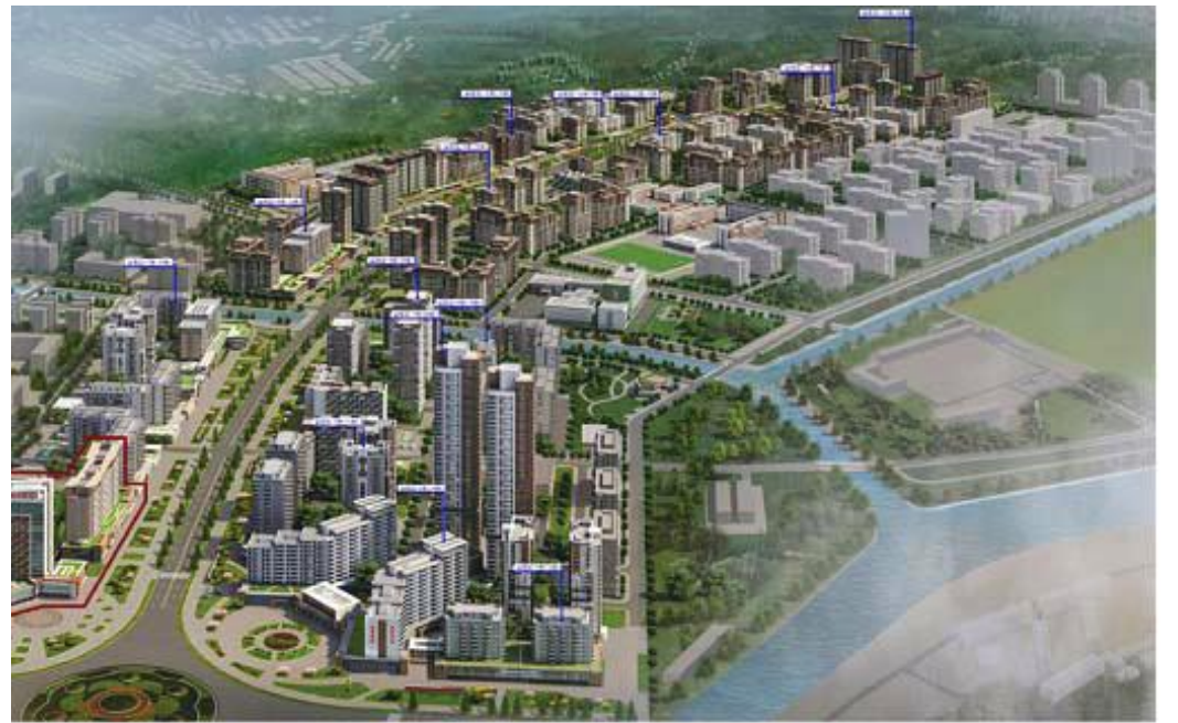
Part of an artist's impression of the apartment houses to be built in the Hwasong area on the second stage