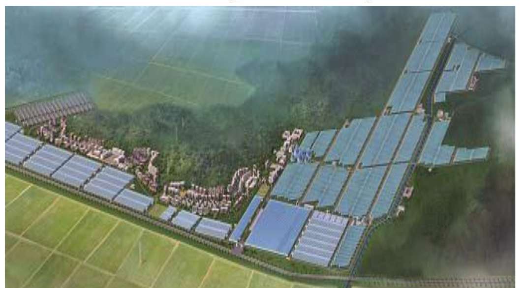
Part of an artist's impression of the large-scale Kangdong Greenhouse Farm