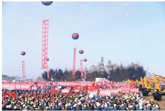
Groundbreaking ceremony held on February 15 for the second-stage construction in the Hwasong area for building 10 000 flats

When the second-stage housing construction in the Hwasong area, which is the third year's task of the project of building 50 000 flats in Pyongyang, is completed, the area will be turned into a beautiful and magnificent area, in which the people-first principle of the WPK is thoroughly embodied and the formative and artistic features is combined with modern civilization.