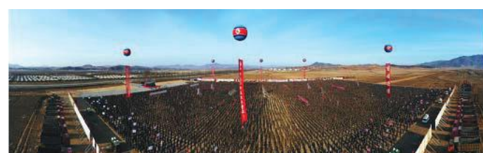
Groundbreaking ceremony held in the Kangdong area of Pyongyang in February for the construction of the Kangdong Greenhouse Farm