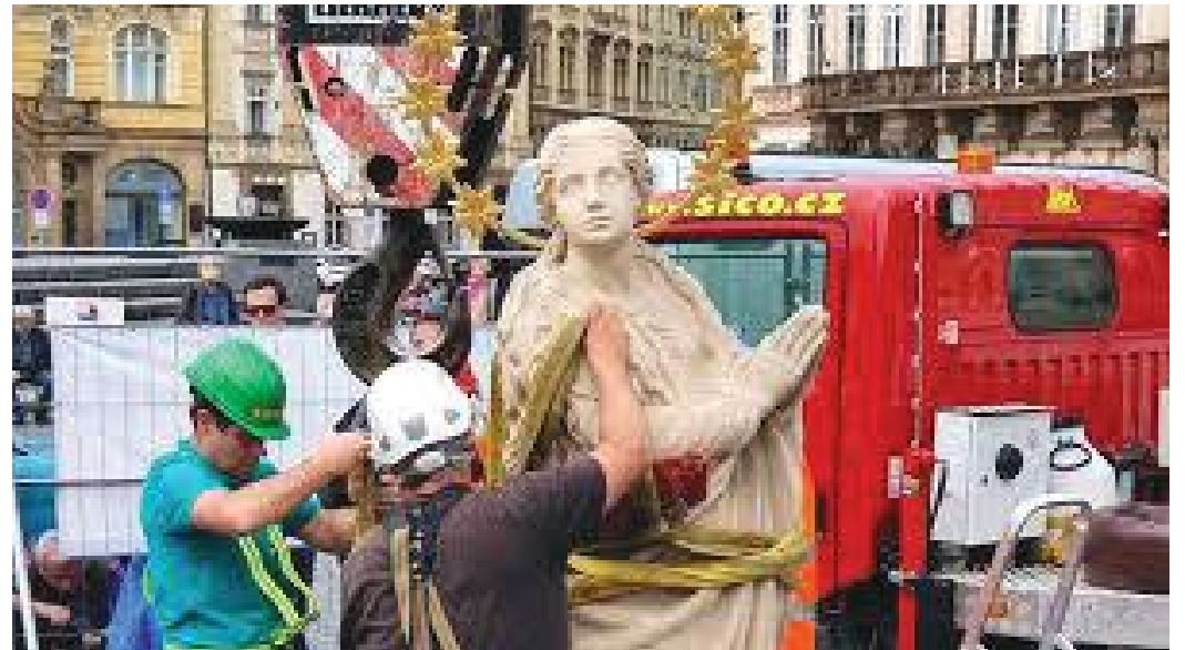
पुनर्निर्मित मेरीको सालिक

मे ७ २०१५ का दिन प्रागको Old Town Square अवलोकन गरी सबदा नसक्दै दिनको १ वजेको थियो। हामी तत्पश्चात् त्यहीँको एक रेष्टुराँमा हल्का खाना खाई पुनः स्वययारमा रहेको Marian column रहेको स्थल अवलोकन गर्नेतर्फ केन्द्रित भयौं।