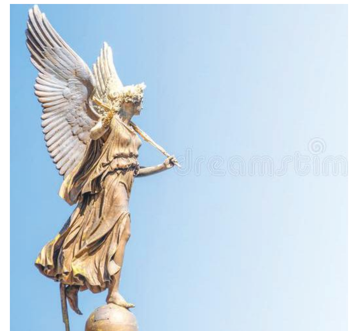
स्तम्भसँगै रहेको चार परीहरूमध्ये एक