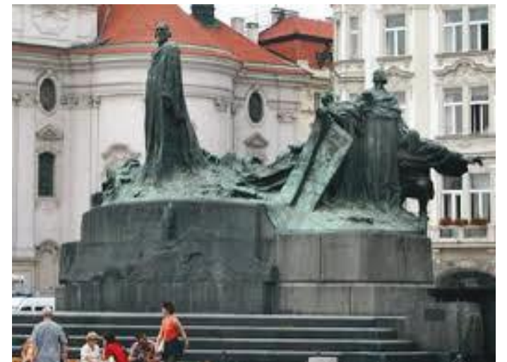
स्तम्भ ठडिएको गोलाकार गजुरसहित जग

सञ्जालमार्फत ठडिएको स्तम्भको तस्वीर हेर्न पाउँदा ७ वर्षअगाडि पुगेको प्रागको त्यो Old Town Square र स्तम्भ ठडिने भनेको स्थलको सम्झना अहिले पनि मेरो मगजमा ताजै छ।