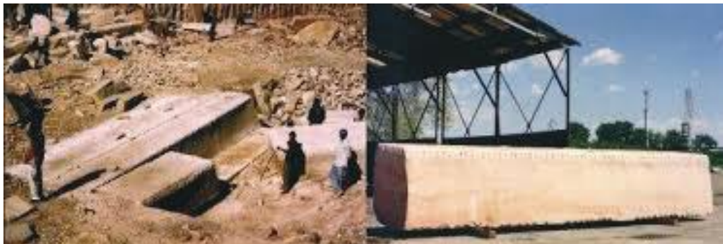
स्तम्भका भग्नावशेष यत्रतत्र थुप्रिएको अवस्था