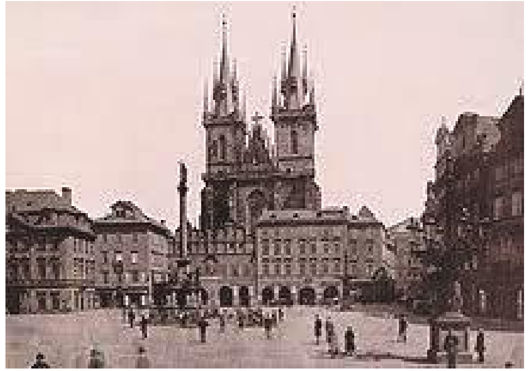
ओल्ड टाउन स्क्वायरमा रहेको मेरीको स्तम्भको ढलु अगाडिको अवस्था