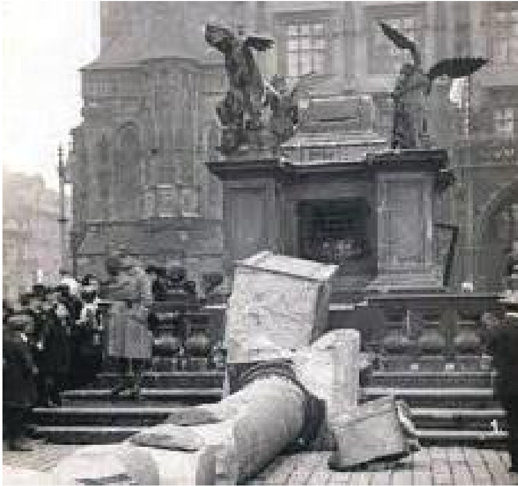
भग्नावशेषको रूपमा रहेको स्तम्भ यस्तो रहेछ