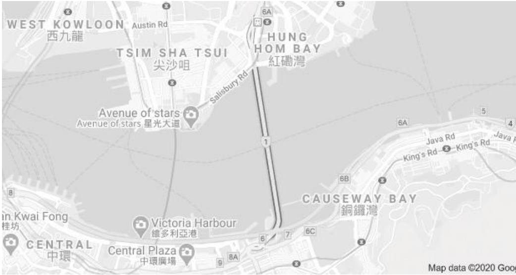
समुद्रमुनिको टनेलको नक्सा