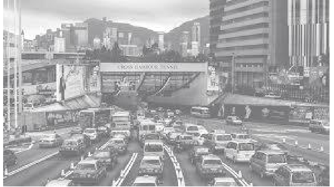
टनेलभित्र पस्न लामबद्ध गाडीहरू