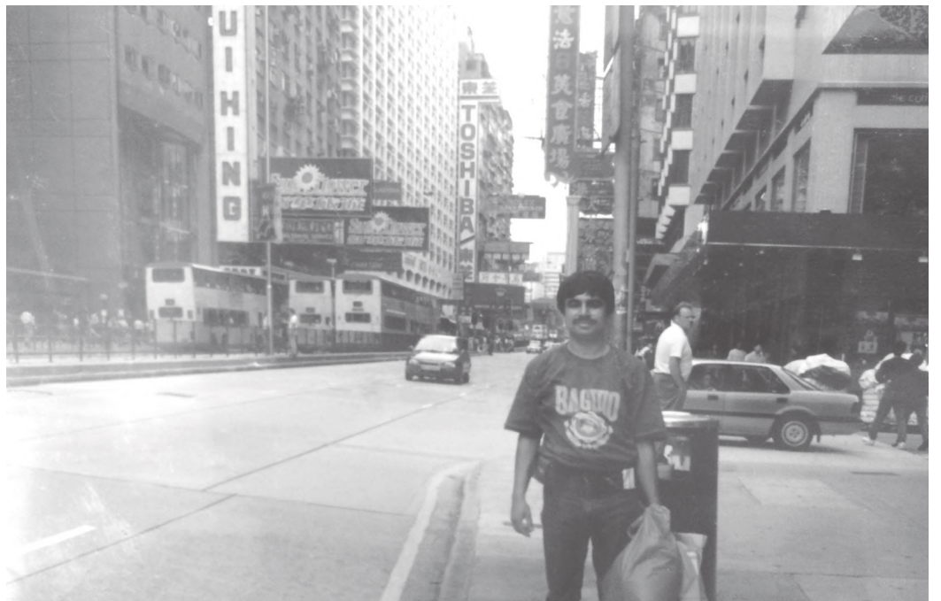
हडकडमा सुरेन्द्र सन् १९९३ मा

कोलुनबाट टनेल पार गरी हामी हडकड शहरको मुटुमा पुग्यौं। केही साथीहरूसँग किनमेल गर्नतर्फ लागे। म चाहिँ आफ्नो क्यामेरामा हडकड सहरको सुन्दर तस्वीरहरू कैद गर्न थालें। करिब ३ घण्टा हडकड सहर घुमी सोही टनेलबाट कोलुन फर्की वेलुकी ५ बजेको प्लेनबाट हामी काठमाडौं फर्क्यौं।