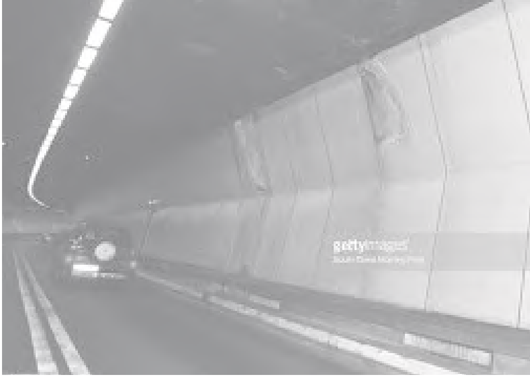
टनेलको भित्री भाग