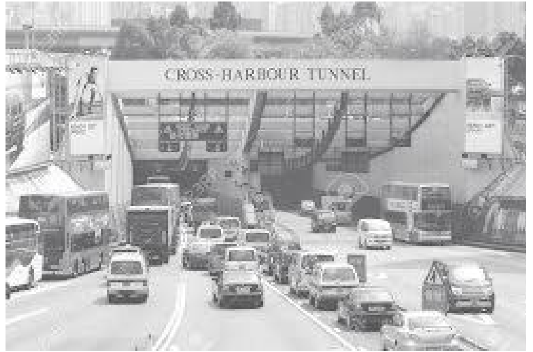
सुरुङ प्रवेश यस्तो देखिन्छ