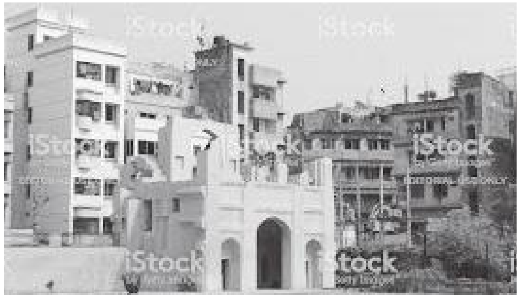
किल्लाको मुख्य द्वार