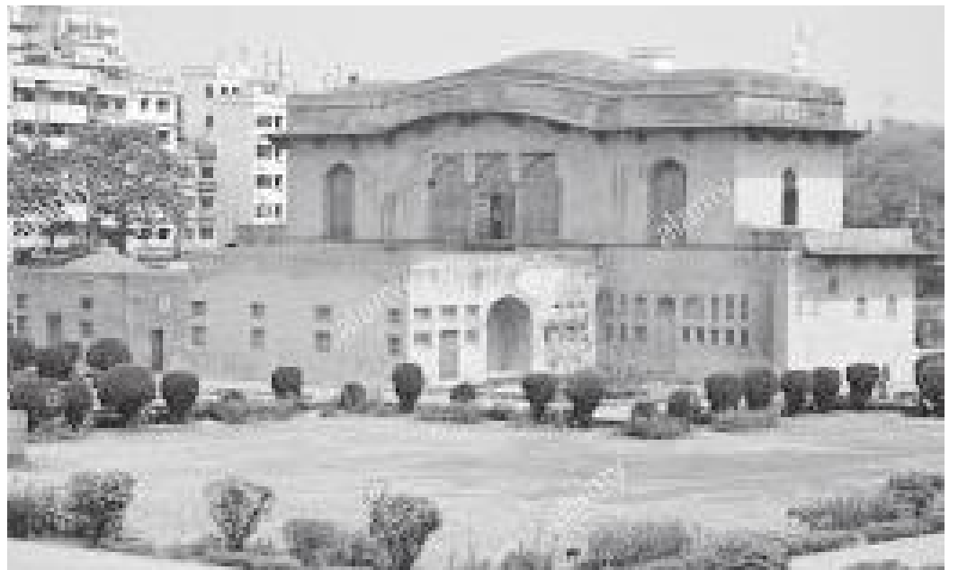
किल्लामित्र रहेको नवाबको निवास दिवान इ आम