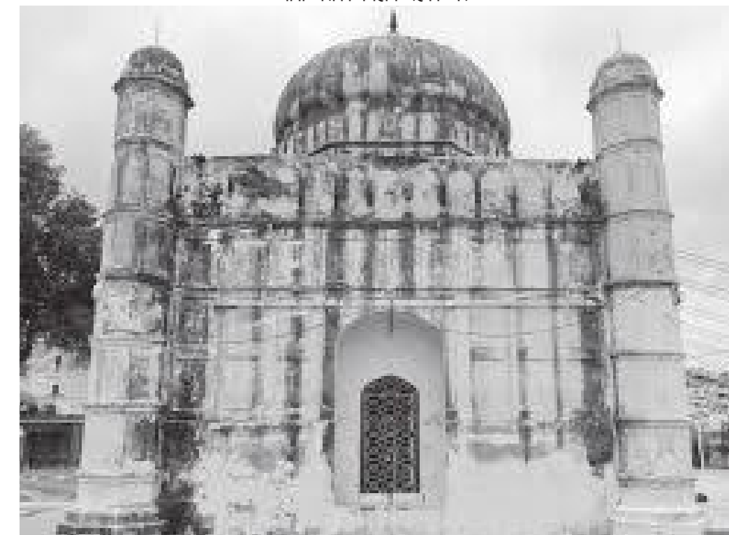
किल्लामित्र रहेको १७ औं शताब्दीको मस्जिद

कलात्मक तरिकाले रंगाएका रहेछन्। पछि सन १८४४ यस किल्लाको नाम लालबाघ किल्ला राखिएको रहेछ।