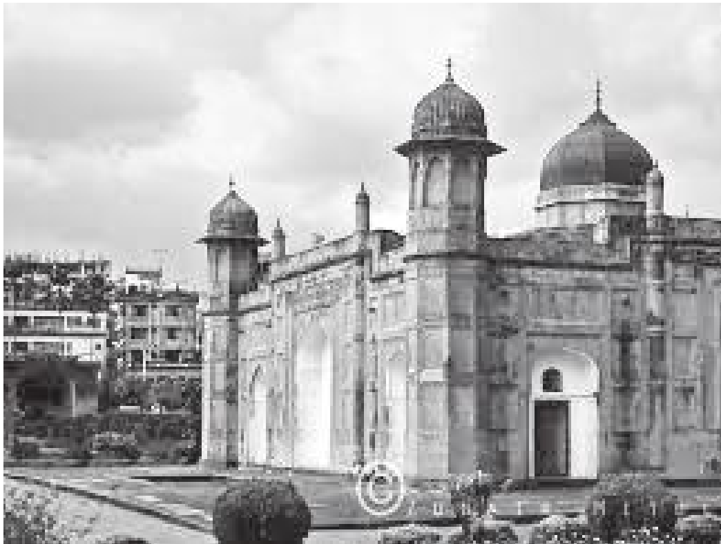
बीबी परीको चिहान रहेको घर