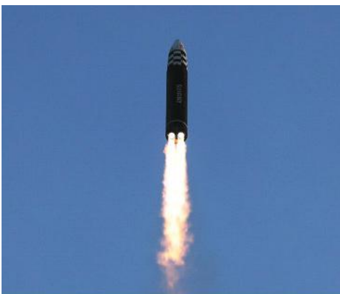
ICBM Hwasongpho-17 flying into the space