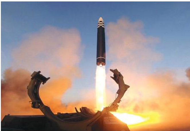
ICBM Hwasongpho-17 fired in a drill on March 16

The drills were aimed at sending the enemy a stronger warning and bringing home to them the concern over an armed conflict which became a threatening reality. And they clearly demonstrated the country's tough will for physical response.