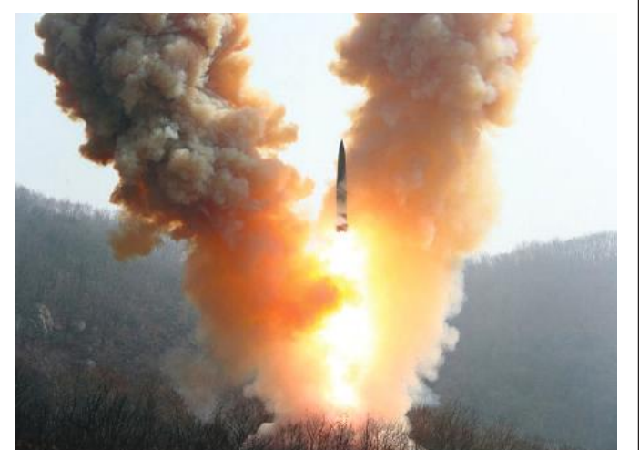
Scene from the combined tactical drill simulating nuclear counterattack stage 1 March 18 and 19 to demonstrate the DPRK's tougher will for physical response and send a warning to the hostile forces