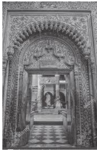
मन्दिरको मुख्य द्वार

सन् १८३५ सिख महाराजा रणजित सिंहले एक टन सुनबाट यस मन्दिरको गजुर लेपन लगाइदिएका रहेछन्। यस मन्दिरको बारेमा असंख्य किंवदन्ती पनि सुन्नमा आउँदो रहेछ। जस्मा एक पटक ब्रह्मा र विष्णुबीचको शक्तिशाली भन्ने