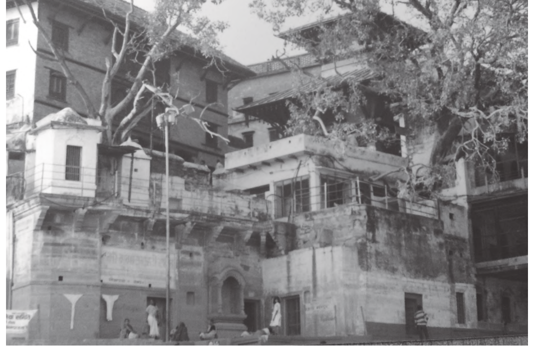
वनारसमा रहेको नेपाली मन्दिर