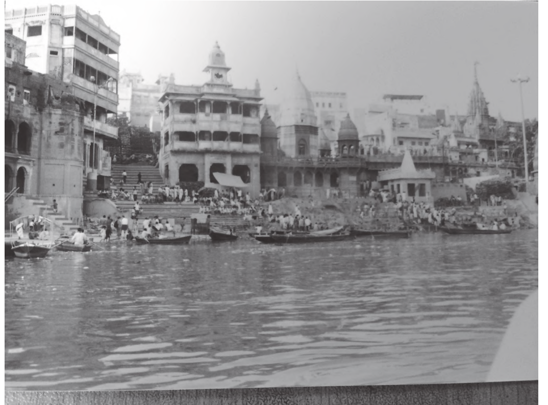
परबाट हेर्दा गंगा नदीसहित विश्वनाथ मन्दिर र घाटको दृश्य