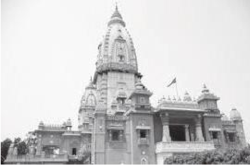
बाहिरबाट हेर्दा मन्दिर यस्तो देखिन्छ