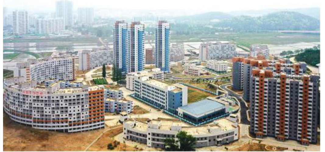
Part of the neighbourhood built in the Taephyongarea in Pyongyang