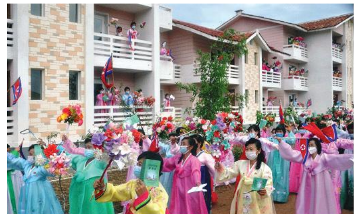
Agricultural workers move to new houses.