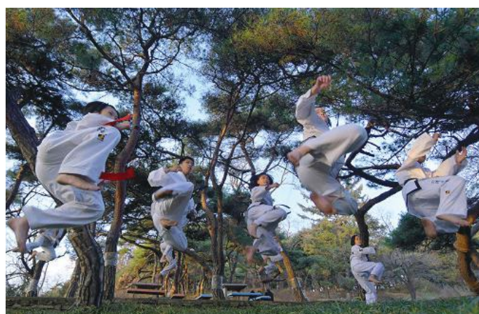
Young Taekwon-Do practitioners demonstrate skills of high difficulty.