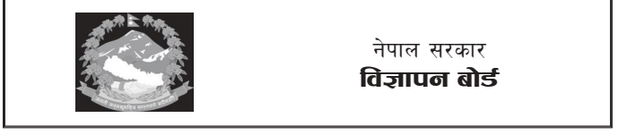
नेपाल सरकार विज्ञापन बोर्ड