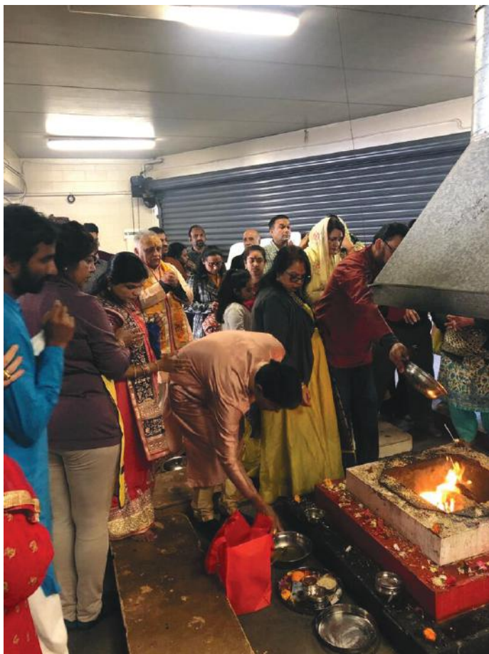
मन्दिरभित्र पूजाआजाको क्षण