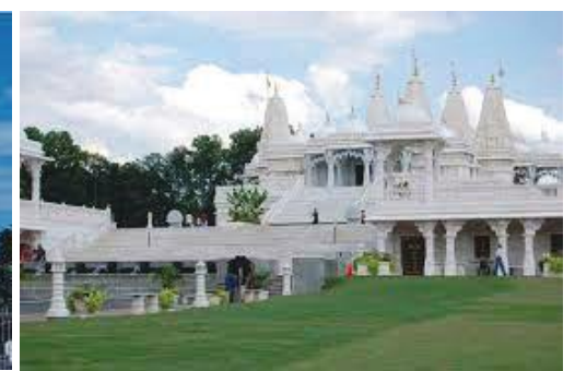
मन्दिर परिसरको भित्री भाग