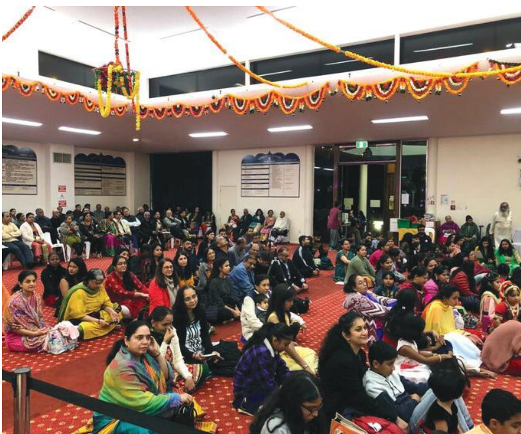
मन्दिरको प्रार्थना कक्ष यस्तो रहेछ