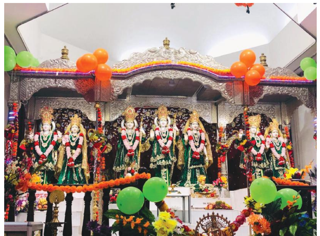
मन्दिरमा रहेका हिन्दु देवताहरूको मूर्ति