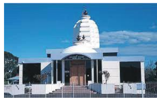
मन्दिरको मुख्य द्वार