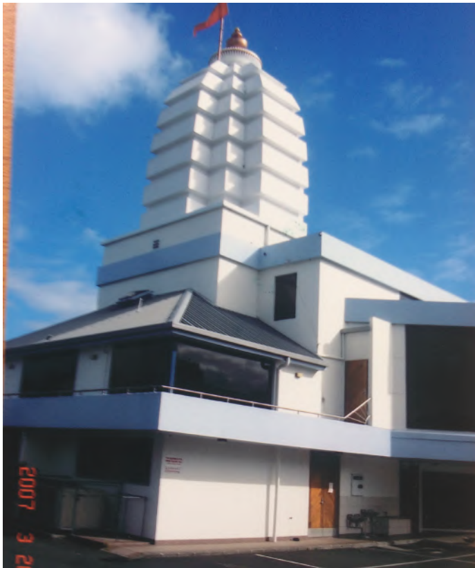
बाहिरबाट हेर्दा हिन्दु मन्दिर