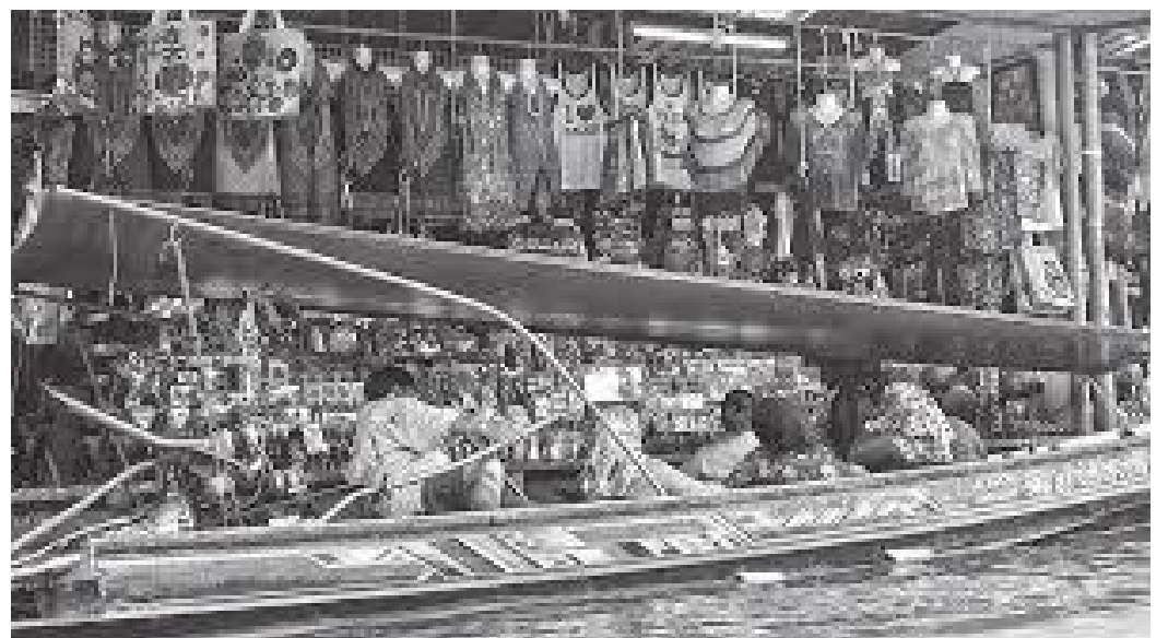
तैरन बजारका गिफ्ट पसल

सन २००३ नोभेम्बरको भारत भ्रमण कालमा भएको दिल्ली र बनारसको विश्व सम्पदा तथा पर्यटकीय स्थलहरूको अवलोकन गरेपछि नयाँ देश घुम्ने मौका पुनः २००५ को जुलाईमा पयो। २००५ को जुलाई महिनाबाट म रोटरी क्लब डिल्लीवजारको अध्यक्ष भएको थिएँ। त्यही महिनाको अन्ततिर रोटरी क्लब काठमाडौँ मेट्रोले एअर इन्टरनेसनल नेपालसँगको सहकार्यमा आफ्नो क्लबको कोष निर्माण (Fund Raising) गर्ने भनेर रु २५००० मा ४ दिने थाइलेण्ड भ्रमणको प्याकेज प्रोग्राम बनाएको रहेछ। उक्त ४ दिनमा बैकक र पताया सामुद्री तट डुलाउने कार्यक्रम पनि रहेछ। धेरै पटक विदेश भ्रमण गर्दा बैकक एअरपोर्ट ट्रायनिङमा पर्ने भएको कारण मैले बैकक भ्रमण गर्न पाएको थिएँ। त्यसैले उक्त प्याकेज प्रोग्राममा म सम्मिलित हुने निर्णय गरी रु २५००० भुक्तानी गरिदिएँ। सो अनुरूप रोटरीक्लब सदस्य, सदस्यका श्रीमती तथा छोरा गरी हामी १५ जना २००५ को जुलाई महिनाको २७ तारिखका दिन एअर इन्टरनेसनल नेपालको विमानद्वारा तीन बजेतिर काठमाडौँबाट बैकक पुग्यौँ। बैकक एअरपोर्टबाट हामीलाई सोभै हामी बस्ने होटलमा लगियो। त्यस दिन होटल वरिपरिको शहरी इलाका घुमेर विताइयो। भोलिपल्ट २८ जुलाईको दिन एक विहानै ब्रेकफास्ट गराए पछि हामीलाई बैकक शहरबाट एक घण्टाको दुरीमा रहेको डामनोएन सादुआक तैरन बजार डुलाउन लगियो।