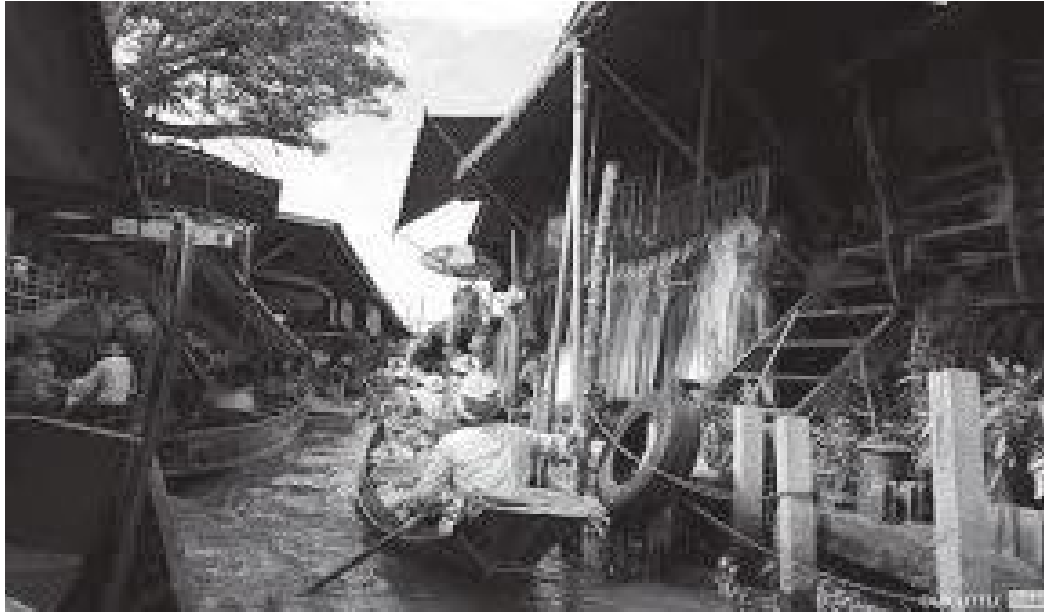
दुवैतर्फ काठेघर भएको साँघुरो नहर