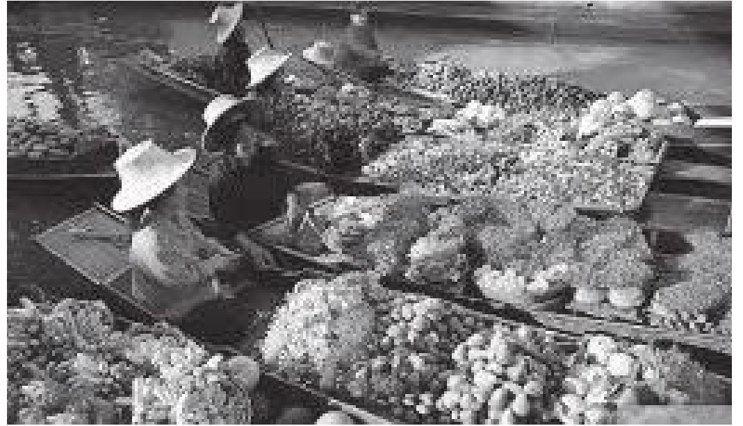
डुंगामा विक्रीमा राखिएका फूल र फलफूलहरू