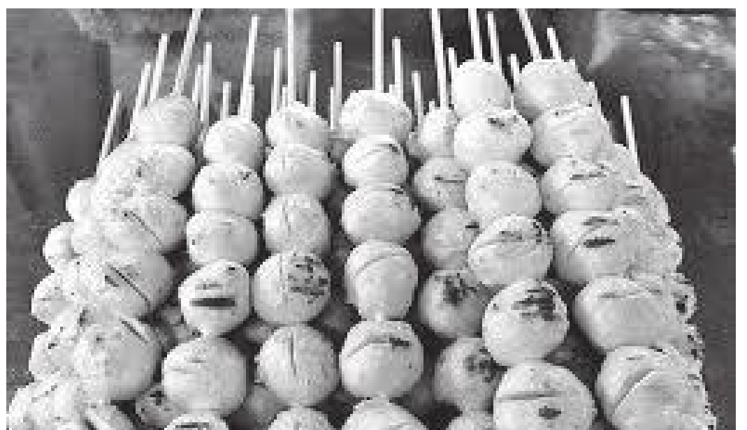
तैरन बजारमा खान पाइने तयारी खानेकुरा

ठमेल भनेजस्तै बैककको सवैभन्दा लोकाप्रिय पर्यटकीय स्थल रहेछ। दिउँसो प्रचण्ड गर्मी हुने हुनाले यहाँ एक विहानै बजार चालु हुँदो रहेछ। हामी पनि त्यहाँ विहान आठ बज्नुअघि नै पुगिसकेका थियौँ। तैरन बजार डुल हरेक दुई जना वा दुई जनाभन्दा बढीले एक कलात्मक रुपबाट सिंगारिएको लामपुच्छे डुंगा लिई त्यसै डुंगाबाट पूरा बजार अनि बस्ति, जंगल डुल्ले अनि डुल्दा डुल्दै कुनै पानीमाथि तैरिएको रेष्टुरामा गएर लंच गर्नुपर्ने रहेछ। हामी सबैले त्यसै गर्नुपर्ने। हाम्रो पोखरामा पनि बोटिङ गरिन्छ तर प्राकृतिक रमणीयताको लागि मात्रै हुन्छ तर त्यहाँ त जीवन नै पानीमाथि चलेको रहेछ। त्यहाँ प्लाष्टिक ट्युबमा गरिने अर्किड (सुनाखरी खेती), नरिवल खेती, विभिन्न किसिमका सुगन्धित तेल, प्राकृतिक रुपमा गरिएको मीरी पालन आदि जस्ता कुराहरूको व्यवशाय र उत्पादन अवलोकन गर्न पाउँदो रहेछ। बस्तिभित्र पसेपछि नहरहरू साँघुरिँदै जाँदा कतै किनारका ससाना काठेघरभित्र पानी छिल्ला छिल्ला जस्तो हुने रहेछ। २० मिनेटको बस्तिभित्रको डुंगा सफारीको अनुभव जीवनमा कहिले पनि विसन नसक्ने खालको रोमान्चक हुने रहेछ। तैरन बजारमा I was there लेखिएको टिसर्ट देखि दुखेको शरीरमा घस्ने टाइगर वामसम्म, काठका ससाना हात्तीदेखि विभिन्न किसिमका सोभेनियरले त्यहाँको बजार खचाखच हुँदो रहेछ। त्यसै गरी विक्री गर्न सजाएर राखिएका विभिन्न किसिमका उष्ण प्रदेशीय (Tropical) फलफूलहरूले बजारलाई ज्यादै मनमोहक र रगीत बनाएको देखिदो रहेछ। खानेकुरामा नरिवलका परिकार, नुडल्सहरू ब्याप्त हुदा रहेछन। हामी त्यहा दिनको एक वजेसम्म वसी बैककको चिडियाखाना अवलोकन गर्न तर्फ हिँड्यौँ।