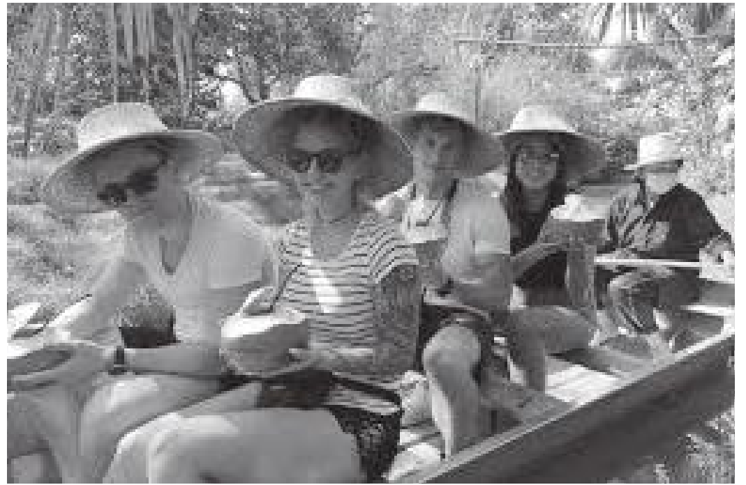
जंगल बीचबाट गुज्रँदै डुंगामा तैरन बजार जाँदै पर्यटकहरू