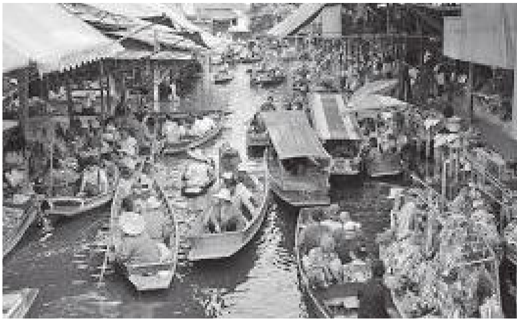
माथिबाट हेर्दा तैरन बजारको दृश्य