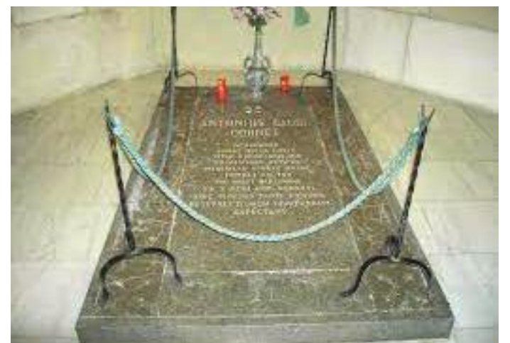
वासिलिकाको छिँडीमा रहेको विश्वविख्यात वास्तुविद गाउडीको विहान