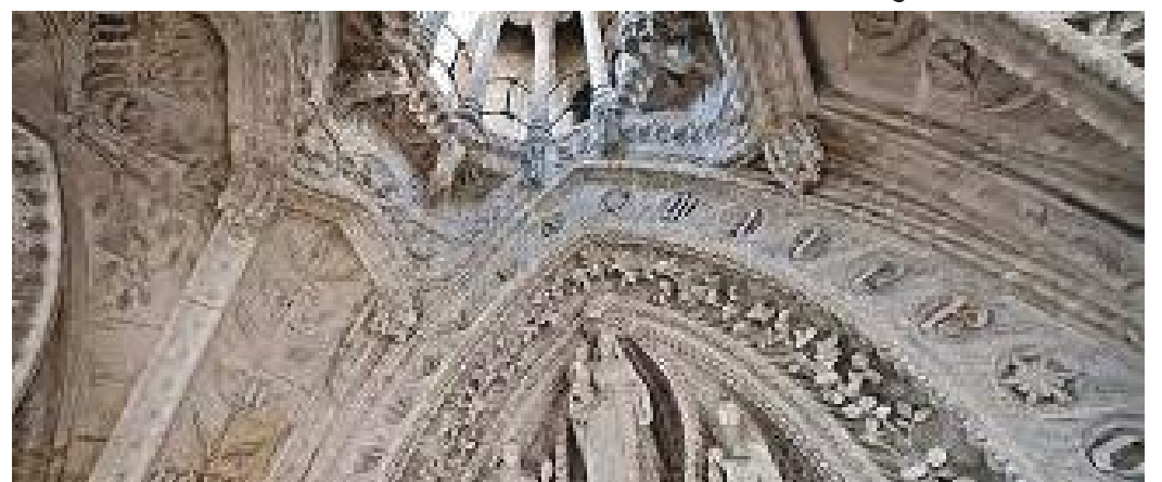
प्रवेशद्वारमा कुँदिएको कला यस्तो रहेछ