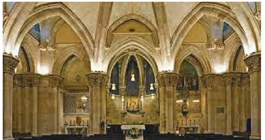
वासिलिकाको छिँडी (Crypt) यस्तो रहेछ

छाडेर हिँडेको कारण वास्तुविद आन्तोनी गाउडीको जिम्मामा डिजाइनको काम आएछ। उनले जिम्मा पाएपछि वासिलिकाको डिजाइनलाई पूरै परिवर्तन गरेका रहेछन्।