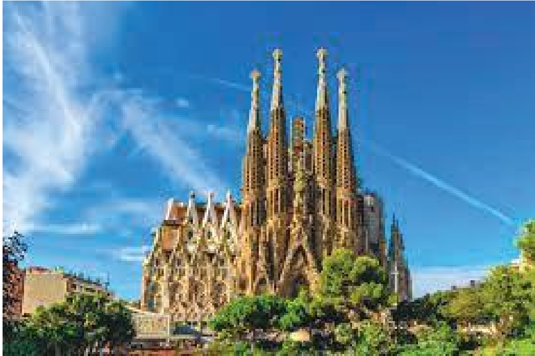
अगाडिबाट हेर्दा वासिलिका यस्तो देखिन्छ

वासिलोनाको ऐतिहासिक म्युजियम परिसरबाट निस्कँदा करिब १२ बजेको थियो। त्यहाँबाट वासिलोनाको विश्वविख्यात साग्रादा फामिलियाको वासिलिका ३ किलोमिटरभन्दा केही बढीको दूरीमा रहेछ। वासिलोना शहर घुम्दै हेर्दै अगाडि बढेको हुँदा हामीलाई मजै भइरहेको थियो। करिब सवा घण्टाको हिँडाइपछि हामी वासिलिका परिसरमा पुग्यौं।