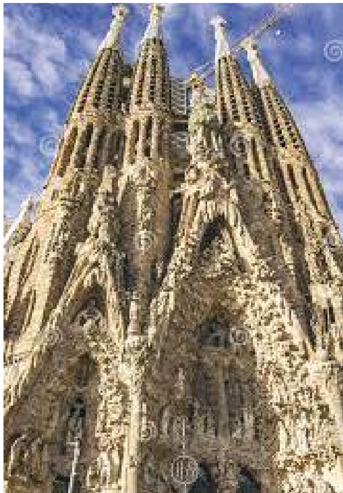
गहन रूपमा कुँदिएका वासिलिका टावर र प्रवेशद्वार

गरी त्यही सालको १९ मार्चमा गोथिक डिजाइन अनुरूप शुरु गरेका रहेछन्। शैलीमा वासिलिकाको छिँडीको निर्माण तर छिँडीको निर्माण कार्य सम्पन्न हुँदा कार्य वास्तुविद फ्रान्चिस्को दे पाउलाको नहुँदै वास्तुविद फ्रान्चिस्कोले काम