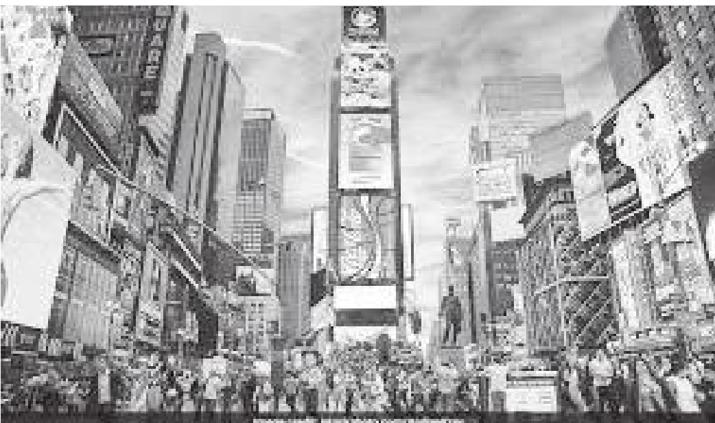
टाइम्स स्क्वायरमा देखिने विज्ञापनका होर्डिङ बोर्डहरू