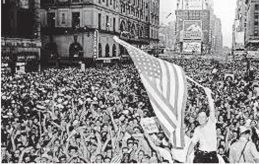
जापानविरुद्धको युद्धमा अमेरिकी विजयपश्चात टाइम्स स्क्वायरमा भएको विजयोत्सव सभा