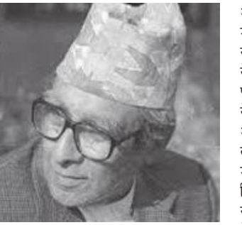
पहाडी, हिमाली पृष्ठभूमि र त्यहाँको प्रकृति, संस्कृति, लोकधुकधुकीलाई उनले सदैव आत्मसात् गरिरहे। त्यसैले घिमिरेका कविता, गीत सबै नेपालीका धुकधुकी बन्ने गरेका हुन्। माधव घिमिरे मिठो शैलीमा भाषण गर्थे। मञ्चमा उभिएपछि घण्टौं श्रोतालाई मन्त्रमुग्ध पारेर लट्याउँथे, कविताको व्याख्या गर्थे। कविताका लागि छन्द र लयको अपरिहार्यताको वकालत गर्थे। उनले मुक्त लय (गद्य शैली) मा कविता लेखेनन्। तर कथालेखनमा प्रवेश मात्र गरे पनि उनको निबन्ध लेखन शैली विशिष्ट प्रकारको र अभिरूचिपूर्ण लाग्दछ। 'चारुचर्चा' र 'आफ्नो बाँसुरी आफ्नै गीत' जस्ता सङ्ग्रहले यस कुराको पुष्टि गर्दछन्।