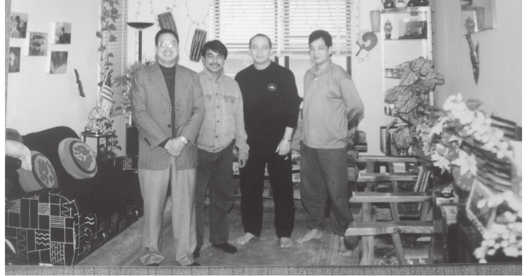
न्युयोर्कमा हामीलाई आतिथ्य दिने मित्रहरूको अपार्टमेन्टमा