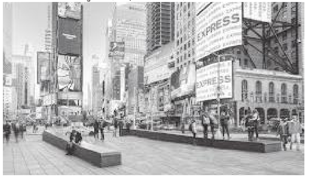
टाइम्स स्क्वायरको पैदलयात्री खण्ड