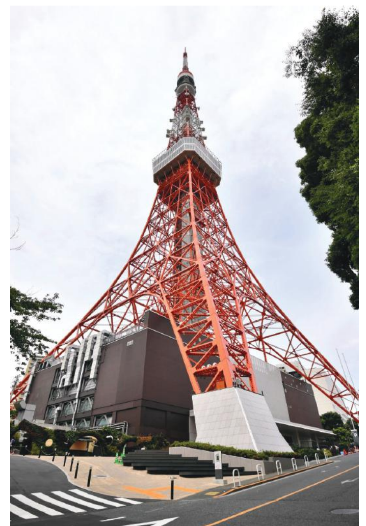
टावर उडिएको ४ तले जग जसलाई फुट टाउन भनिन्छ

जोयोजी मन्दिर अवलोकन गरिसक्दा मध्याह्नको भण्डै १ बजिसकेको थियो। तत्पश्चात् मित्र आवेले नजिकैको एक रेस्टुराँमा दिउँसोको खाना (लन्च) गर्न लगिन्। करिब १ घण्टा खाना खानमै बित्यो। तत्पश्चात् उनले मलाई जोयोजी मन्दिरकै पछाडि रहेको टोकियो टावर अवलोकन गर्न लगिन्।