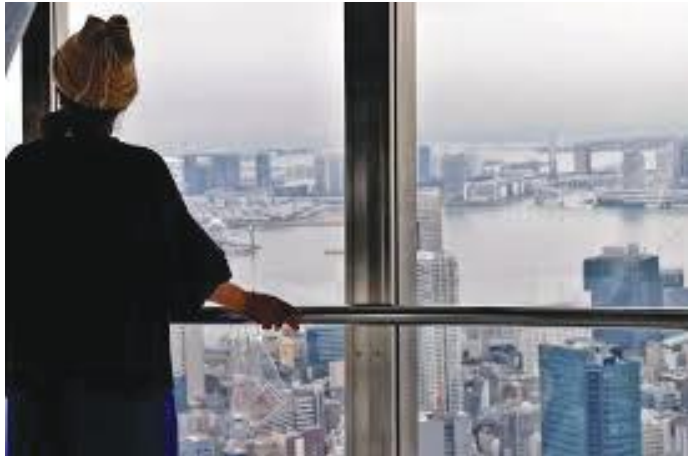
टावरको दृश्यावलोकन गर्ने बार्दली