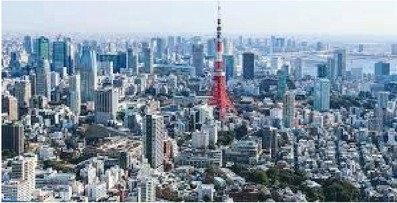
टोकियो सहरबीच टोकियो टावर यस्तो देखिन्छ