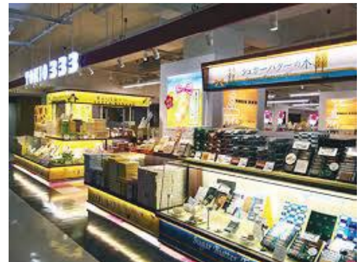
फुट टाउनभित्र रहेका पसलहरू