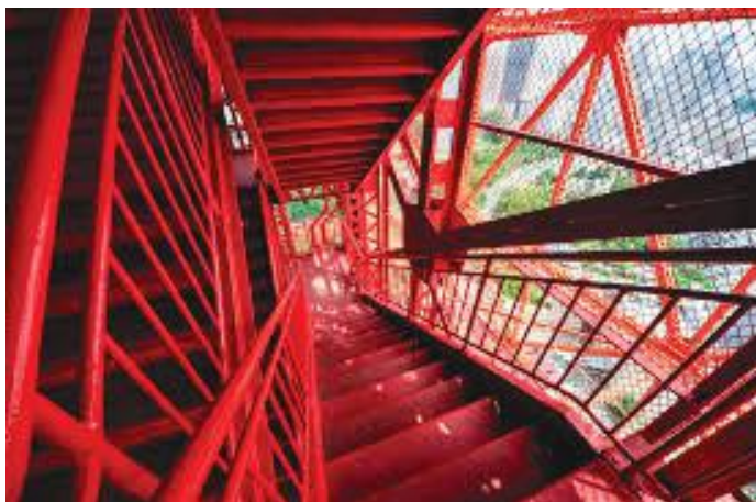
टावरको टुप्पामा पुग्ने भन्ज्याङ