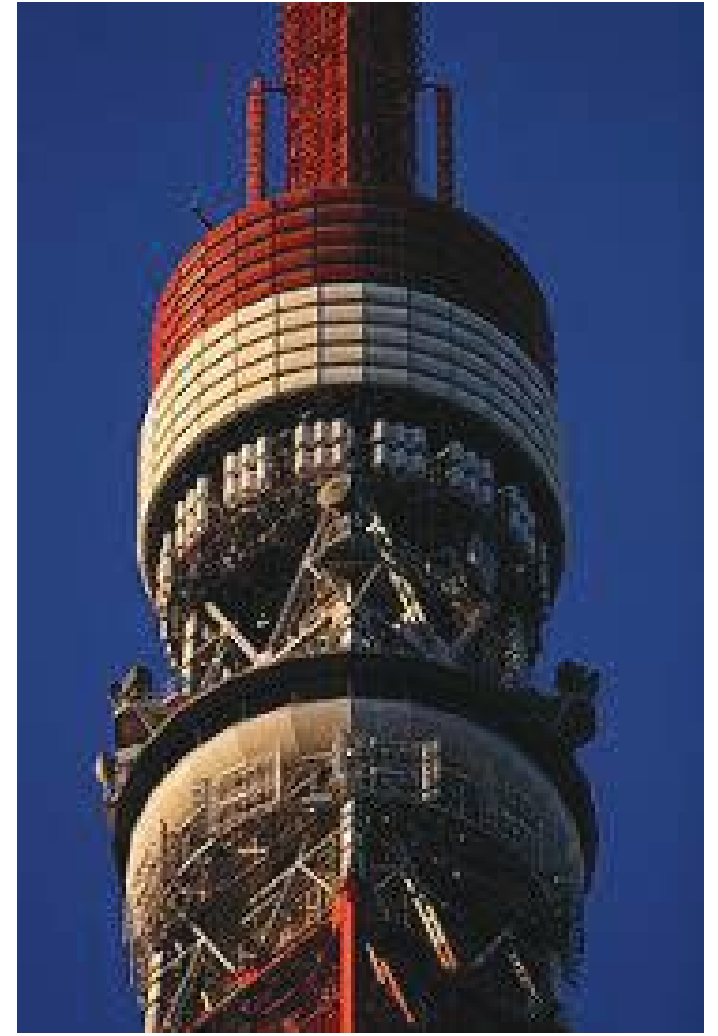
बाहिरबाट हेर्दा टावरको दृश्यावलोकन बार्दली