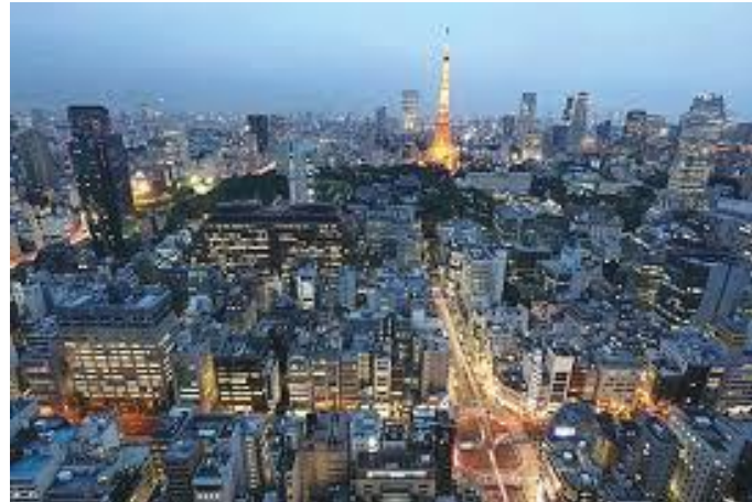
टावरको टुप्पामा हेर्दा टोकियो सहर यस्तो देखिन्छ