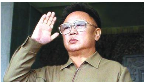
accordance with the entire nation's aspirations to reunification.

Because the great leader provided the three charters of national reunification, our nation is in a position to develop the struggle for national reunification with the clear objective, direction, confidence and courage and to realize its cherished desire for its reunification successfully by its united effort. The three charters of national reunification are, indeed, the banner of national reunification as well as the justest and most realistic fighting programme for reunifying the country independently and peacefully.