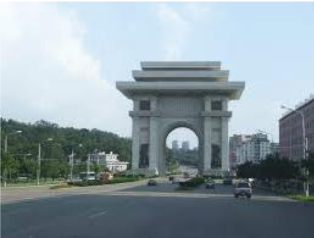
विजय द्वारको पछाडि देखिएको मोरान पहाड