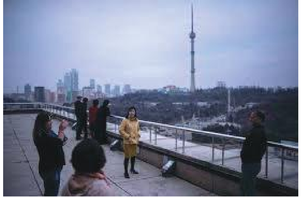
विजयद्वारबाट देखिने प्योङयाङ सहरको दृश्य