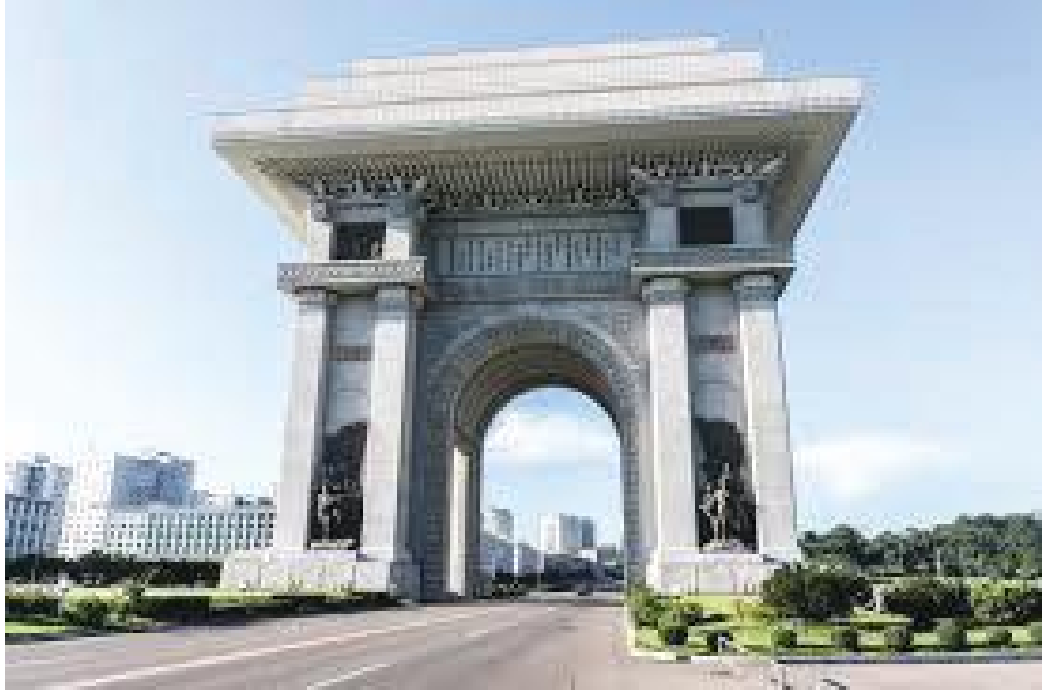
आर्क अफ ट्रिअम्फ अगाडिबाट हेर्दा