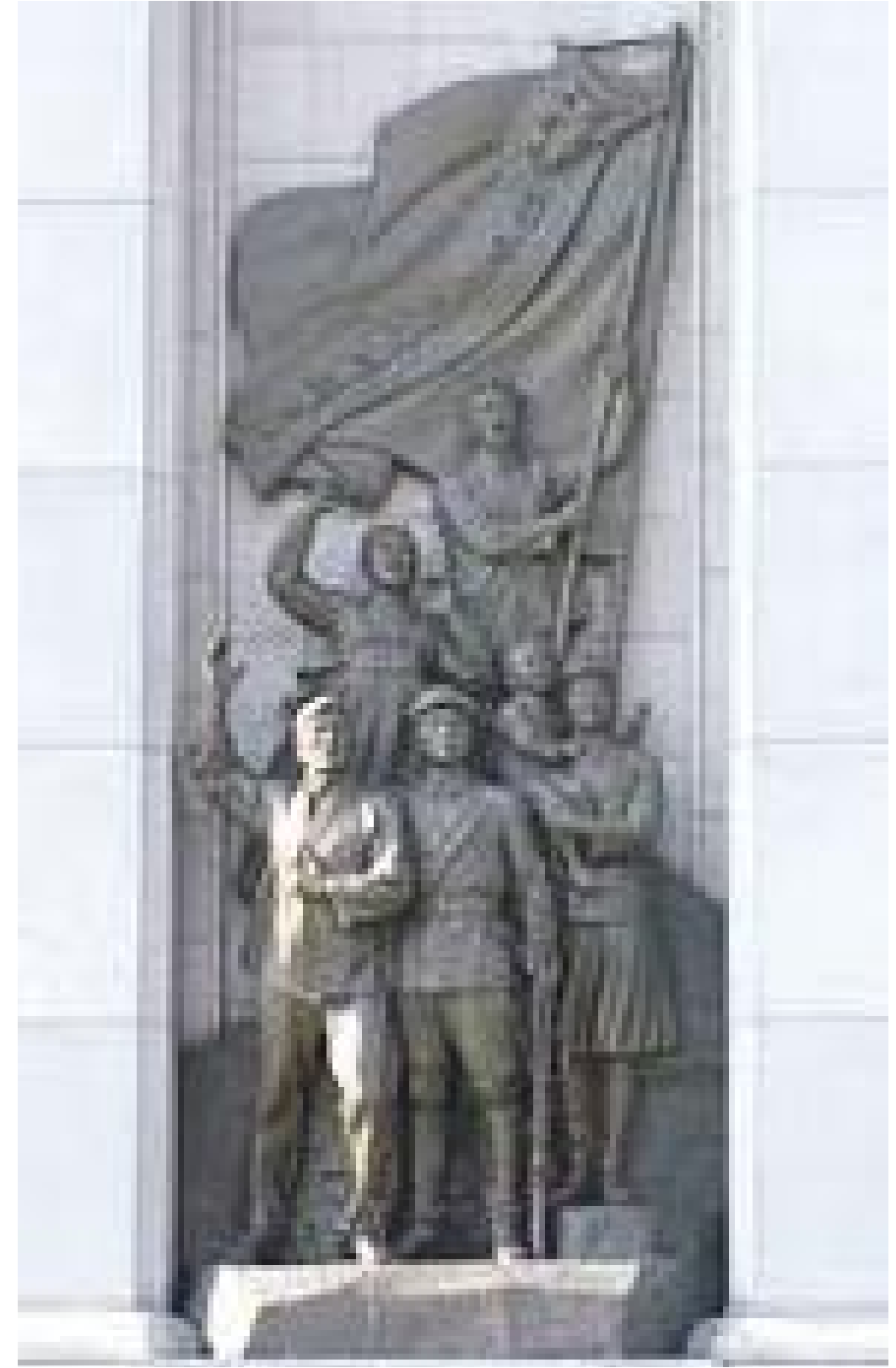
द्वारको स्तम्भमा कुँदिएका मूर्ति युद्धका चित्र

१० अगस्तकै दिन प्योङयाङको भूमिगत रेल (सबवे) अवलोकन गरेपछि हामी त्यही रेल चढेर आर्क अफ ट्रिअम्फ (धनुषाकार विजय द्वार) अवलोकन गर्न त्यतातिर लाग्यौं।