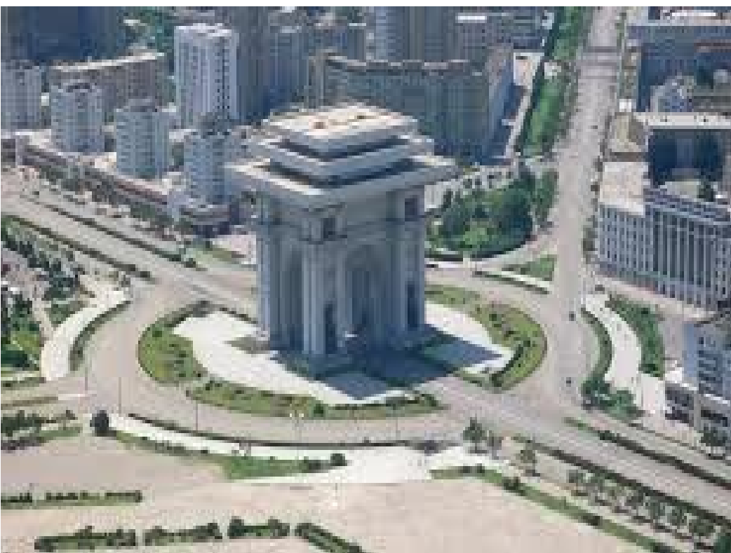
माथिबाट हेर्दा चार स्तम्भमा देखिएको विजय द्वार