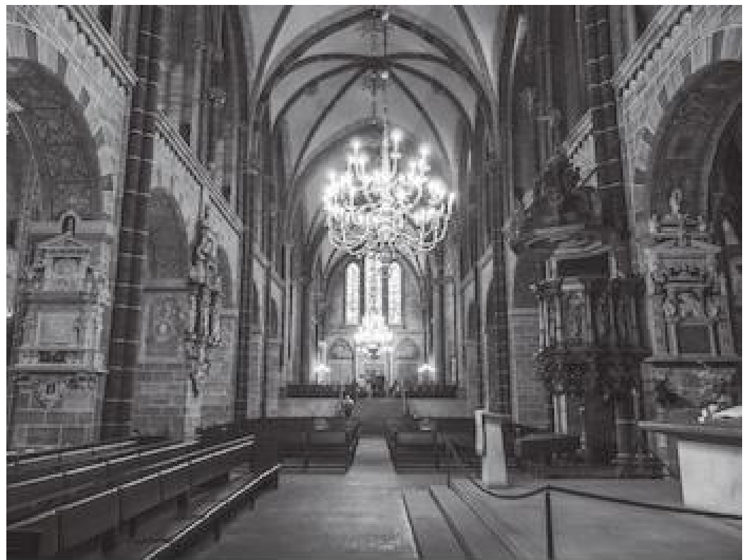
किनारामा दुई पथसहितको क्याथेड्रलको मुख्य प्रार्थना कक्ष

ब्रेमेनको लेडी चर्च अवलोकन गरेपछि म बेलुकी डेरातर्फ फर्किएँ। बस्दै जाँदा ब्रेमेन मेरो लागि अब नौलो रहेन। सिनेटमा काम सिकने सन्दर्भमा नयाँ साथीहरूसँग चिनजान बढ्दै गएको थियो। आफूले नेपालबारे उनीहरूलाई भन्नु र उनीहरूले ब्रेमेनबारे मलाई बताउनुमा नै हाम्रा फुसदका समय बिट्दै गएको थियो। ब्रेमेनमा अवलोकन गर्नुपर्ने त्यहाँको क्याथेड्रल बाँकी भएको कारण सिनेटको काम सकेर एक दिन दिउँसो साढे दुईतिर म ब्रेमेनको क्याथेड्रल पुगी पुरै दिन त्यसलाई अवलोकन गरी बिताएँ।