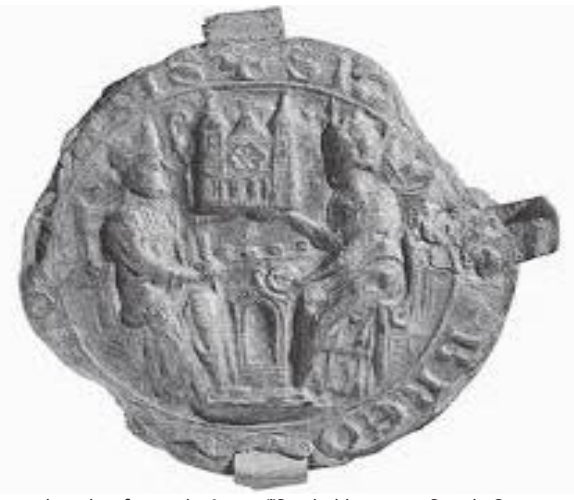
क्याथेड्रलको दुई टावरको बीचमा टाँसिएको ब्रेमेन नगर परिषदको निशाना छाप