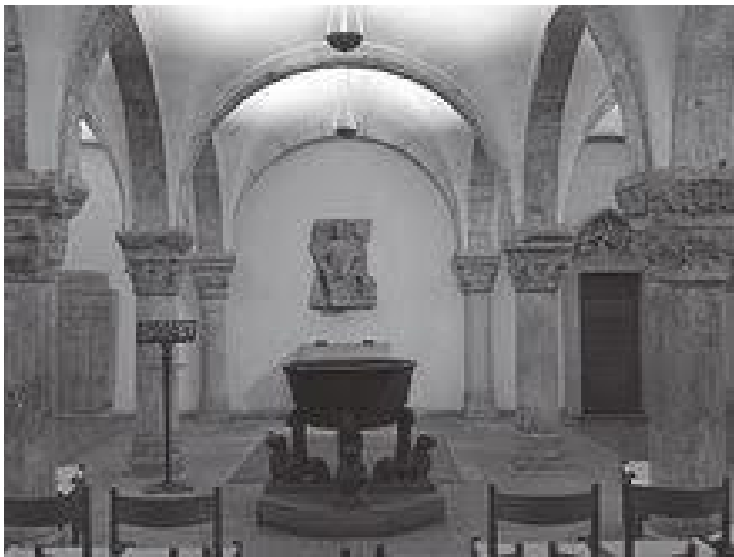
क्याथेड्रलभित्रको सबैभन्दा पुरानो कक्ष