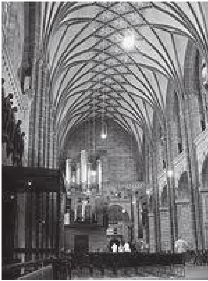
क्याथेड्रलभित्रको धनुषाकार कलात्मक दलिन