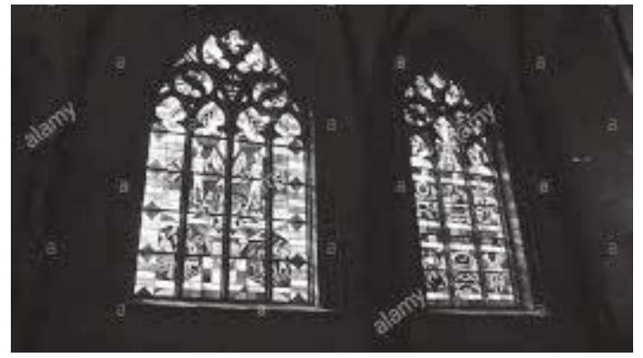
क्याथेड्रलभित्रको कलात्मक सिसाका भ्यालहरू