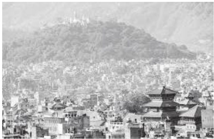
काठमाडौंको घनाबस्तीबाट देखिने स्वयम्भू