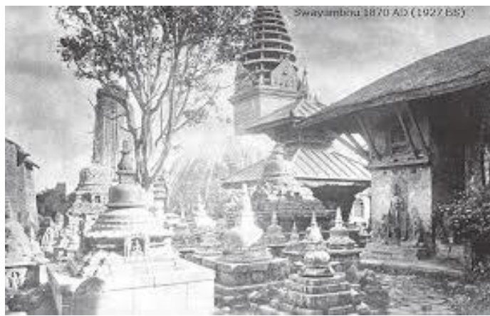
बच्चामा मैले पहिलोपटक देखेको स्वयम्भू