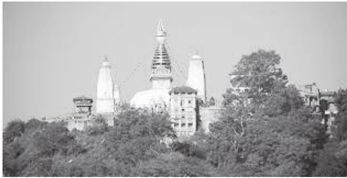
स्वयम्भू तलबाट हेर्दा