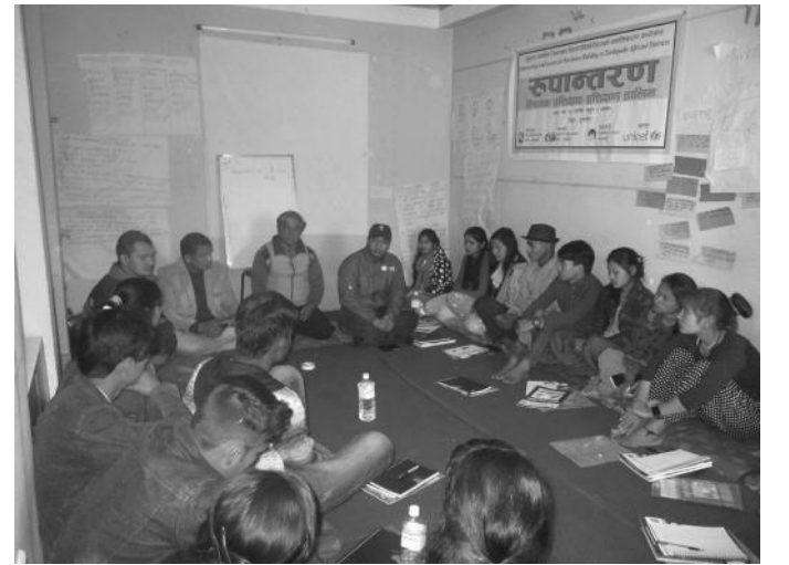
अभियान रूपान्तरण कार्यक्रमका केही भलकहरू