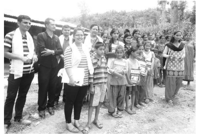
अभियान रूपान्तरण कार्यक्रमका केही भलकहरू