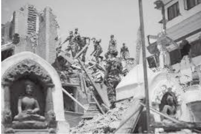
२०७२ को भूकम्पले स्वयम्भू परिसरमा पुऱ्याएको क्षति