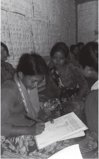
लिखित रूपमा तयार गर्दै सहभागी