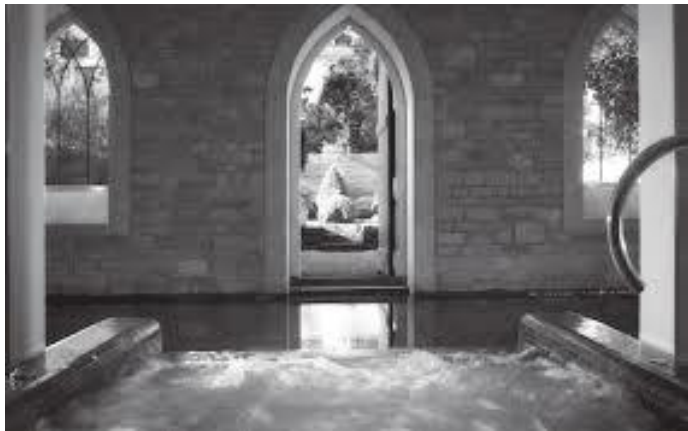
घरभित्रको प्राकृतिक तातोपानीको नुहाउने स्थल