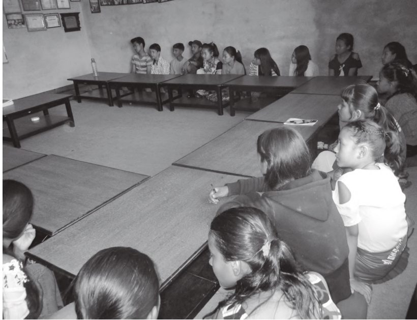
तालिममा सहभागी बालबालिकाहरू