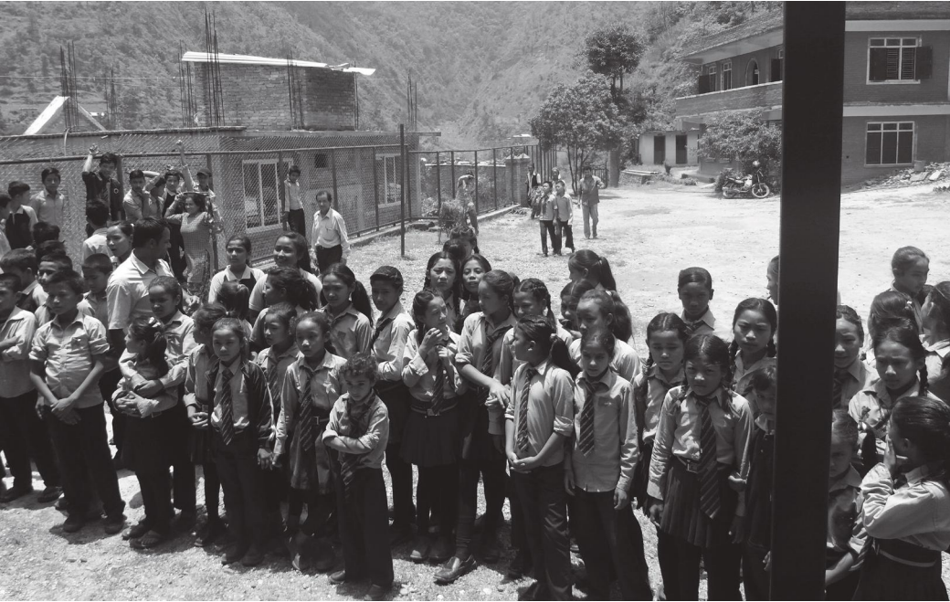
नाटक हेर्दै विद्यालयका बालबालिकाहरू