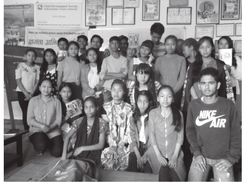
अभिमुखीकरण कार्यक्रमका सहभागीहरू