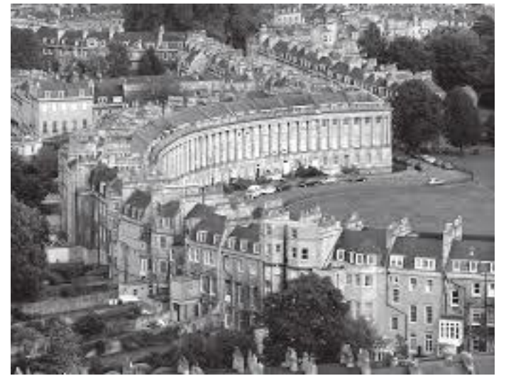
माथिबाट हेर्दा रोयल क्रसेन्टको ३० वटा घरको लहर यस्तो देखिन्छ

नम्बरका घरहरूमा क्षति पुगेको रहेछ । विश्वयुद्धपछि क्षतिग्रस्तहरू जिर्णोद्धार गरी बाथको शहर परिषद केही समयको लागि त्यहाँ बसेको रहेछ पछि घरको पुरातात्विक महत्वलाई दृष्टिगत गरी