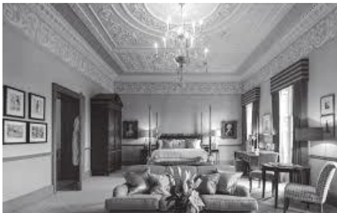
घरभित्रको महँगो पाहुना कक्ष