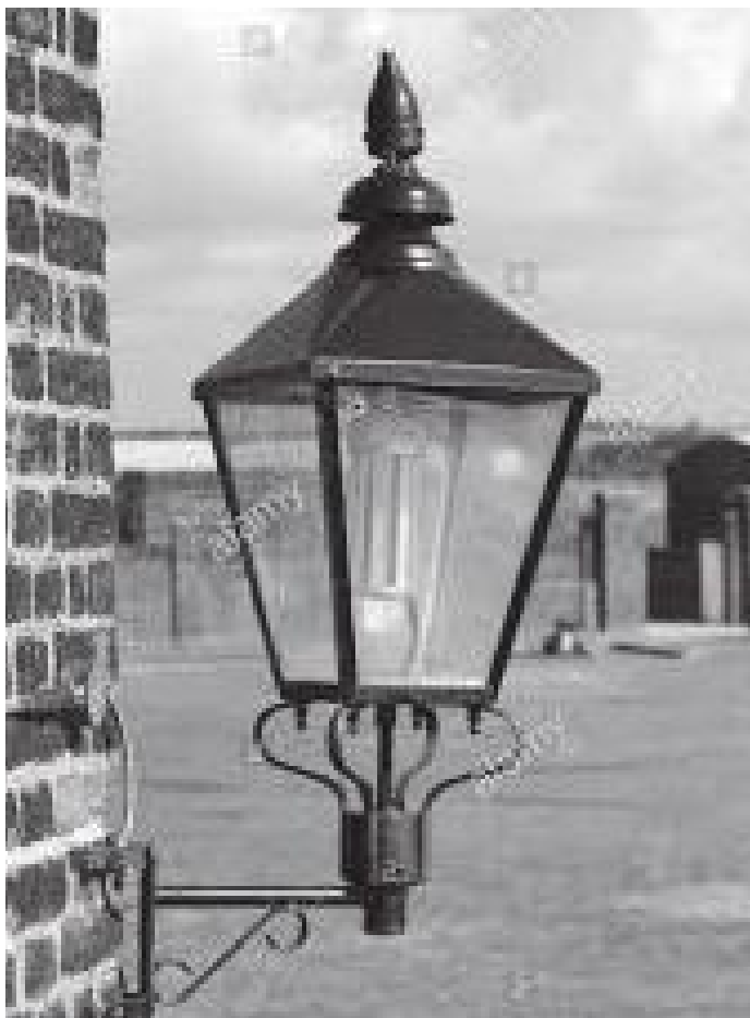
घरको भित्तामा टाँसिएका फलामका लालटिनहरू