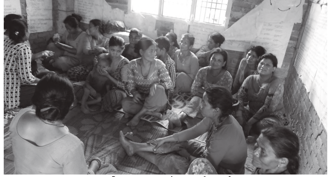
अन्तरक्रियाका क्रममा आफ्नो कुरा राख्दै सहभागीहरू