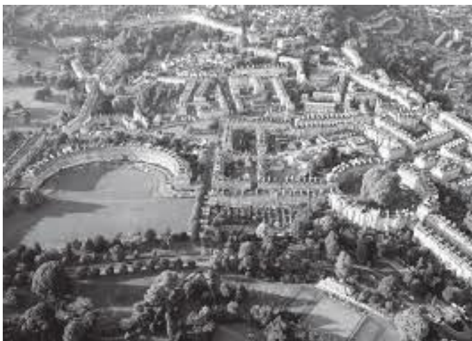
हरियाली गाउँको बीचमा रहेको सानो क्रसेन्ट सहर