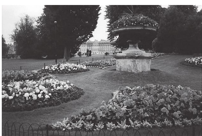
रोयल क्रसेन्टसँगै रहेको भिक्टोरिया पार्क

ग्लोस्टरको क्याथेड्रल अवलोकन गरिसकेपछि हामी ब्राइटनतर्फ लाग्यौं । ब्राइटनमा विश्वप्रख्यात रोयल क्रसेन्ट शाही स्नानग्राम अवलोकन गर्नेतर्फ लाग्यौं ।