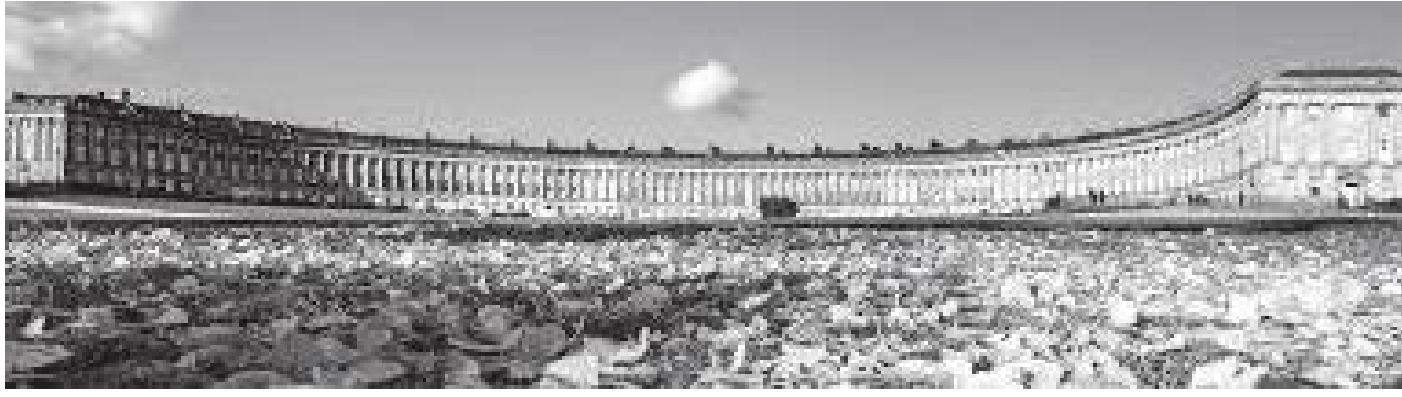
अगाडिबाट हेर्दा ३० घरका लहर यस्तो देखिन्छ