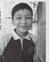
रोमन वि क (काठ्ठे)

शुभकामना छ रोशी नदी तिमीलाई वधा छद रोशी विद्यालय हजुरलाई धन्यवाद छ रोशी वाडयम प्रतिष्ठानलाई आभारी छु रोशी क्लव र साप्ताहिक पत्रिकालाई भगवान एक रुप अनेक अनेकौ छौ काम एक गर्दछौ अनेक क्षेत्र भइ सधै सेवामा समर्पित लाग्नु रोशी तिमी सम्मान गर्दछौ हजुरहरूको कामलाई हामी