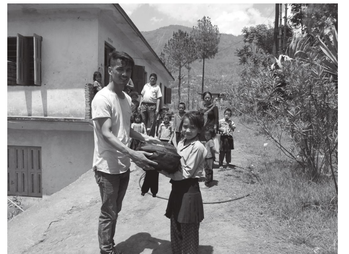
शैक्षिक सामग्री ग्रहण गर्दै बालिका