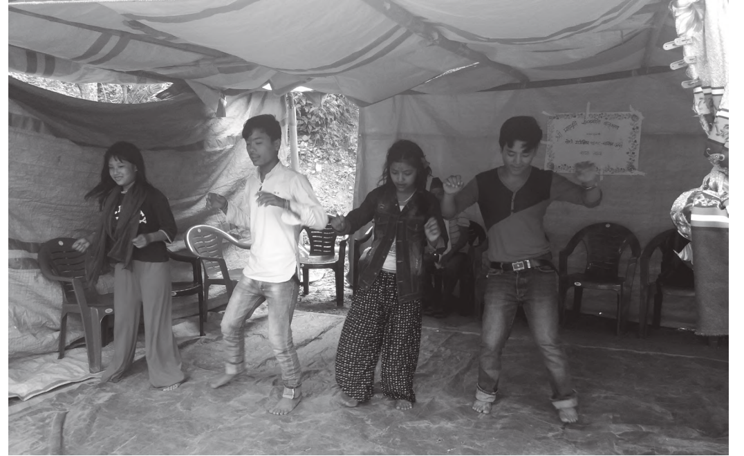
नाटकमा अभिनय गर्दै बालबालिकाहरू