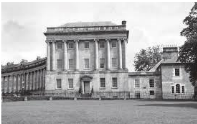
घरको मुख्य मोहोडा