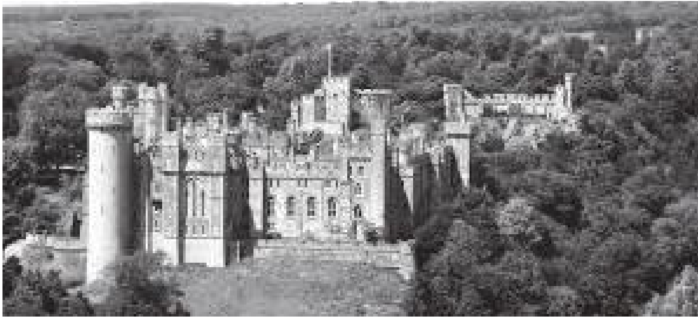
अगाडिबाट आरुण्डेलको दरबारसहितको किल्ला यस्तो देखिन्छ