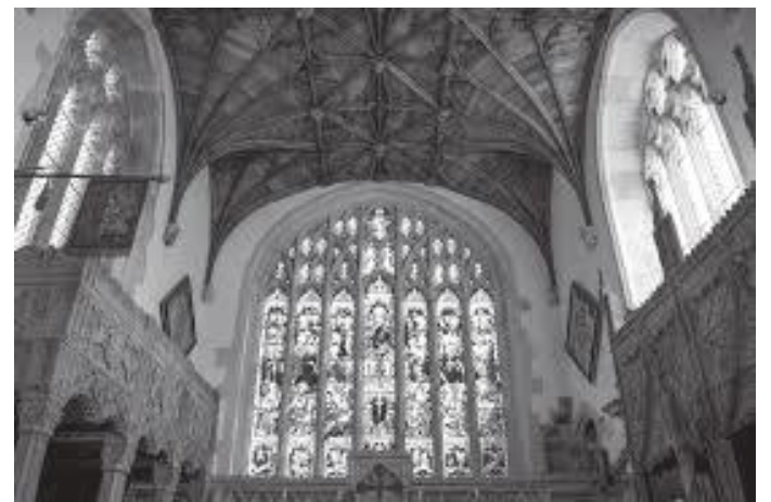
दरबारभित्रको फिच्छलान गजुरको भित्री भाग

गरी यस दरबारलाई सिंगारेर पुरै दरबारको जिम्मा राष्ट्रिय कोष खडा नयाँ जस्तै बनाएका रहेछन् भने गरी त्यसलाई दिने भनिए तापनि सो महारानीको शयनकक्ष ठूलो मेहनतका साथ बनाउन लगाएका रहेछन् । यही मौकामा यस दरबारभित्र यसलाई सार्वजनिक दर्शनीय स्थलको भिक्टोरिया कालिन महँगा फर्निचरहरू रूपमा विकास गरी देश विदेशका पनि भित्रिएका रहेछन् । सन् १९७५मा पर्यटकहरूको लागि खुला गरिएको १६औं ड्युकको मृत्युपछि यस रहेछ ।