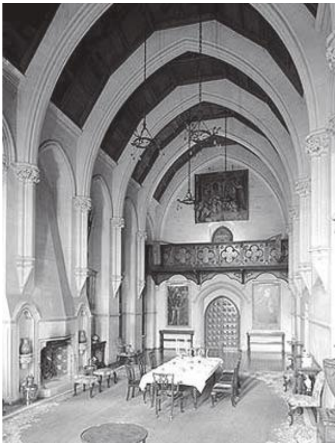
आरुण्डेलको दरबारको भित्री भाग