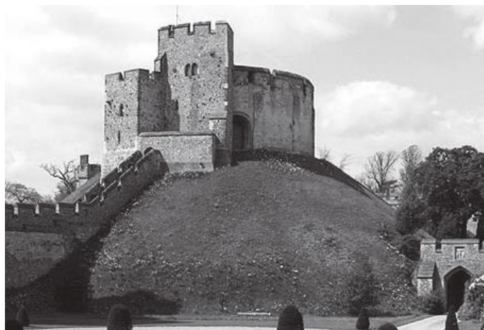
आरुण्डेलको स्टोन सेल तलबाट हेर्दा