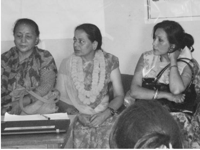
स्वास्थ्य सम्बन्धी तालिमको उद्घाटनमा १४ नम्बर वडा अध्यक्ष तथा सदस्यहरु