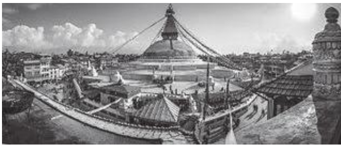
बौद्धनाथ र वरिपरि