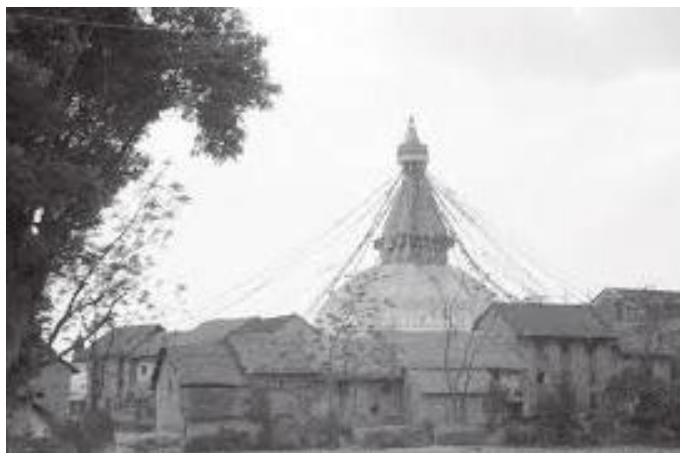
म नौ वर्षको हुँदा देखेको बौद्धनाथ

कुरा २०२४ सालतिरको हो । विजय मेमोरियल स्कुलमा ७ कक्षाको वार्षिक परीक्षा दिएर मीन पचासको जाडोको छुट्टीमा थियौं हामी बालबालिका । त्यति खेर मेरो उमेर नौ वर्ष पूरा भएर १० वर्ष लागेको मात्र थियो । अहिलेको जस्तो जहाँबाट जहाँ जान पनि बसको व्यवस्था थिएन । त्यतिखेर गौशाला रत्नपार्कको रूटमा मात्र बस चल्थ्यो । गौशालाबाट उत्तर जहाँ जान पनि हिँडेर जानुपर्ने हुँदा बानेश्वरबाट वौद्धनाथसम्म जान पनि अवसर नै कुनै पर्दथ्यो । भन्नु हामी बालबालिका एकलै त्यति टाढा जाने कुरा पनि हुँदैनथ्यो । विजय मेमोरियल स्कुल डिल्लीबजारमा भएको कारण रत्नपार्क र रानीपोखरीसम्म मात्रै मैले देखेको थिएँ । बानेश्वरबाट शंखमूल हुँदै पाटन हिँडेर जाने बाटो अनकन्टार थियो । गठेले बालबालिकालाई समातेर लैजान्छ भन्ने डर हामीलाई देखाइएको हुँदा एकलै त्यो बाटो हिँडने कुरा पनि थिएन । यसैबीच हामी उही उमेरका साथी भाइहरूबीच सुन्दरीजलको सुन्दरीमाईको मन्दिरमा पिकनिक जाने तय भयो । पुरानो बानेश्वरबाट गौशालासम्म बस चढ्ने कुरा पनि भएन । तसर्थ माघ महिनाको एका बिहान हामी ७ जना बालबालिकामध्ये बानेश्वरबाट लाग्यौं सुन्दरीजल पिकनिक गर्न जान भनेर ।