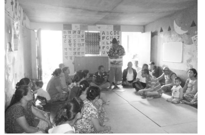
अभिभावक छलफल कार्यक्रमका सहभागीहरु