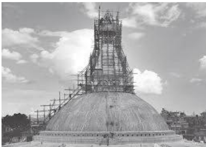
बौद्धनाथ भूकम्पपछि पुनर्निर्माण हुँदै