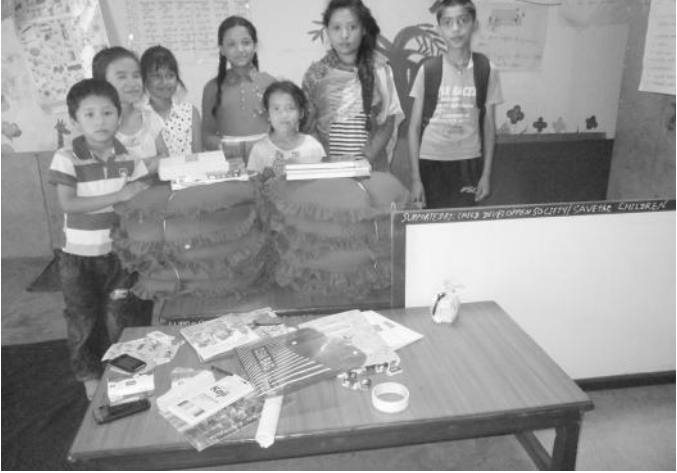
शंखमूलस्थित कोचिङ कक्षाको सामग्री हस्तान्तरण पछिको तस्विर