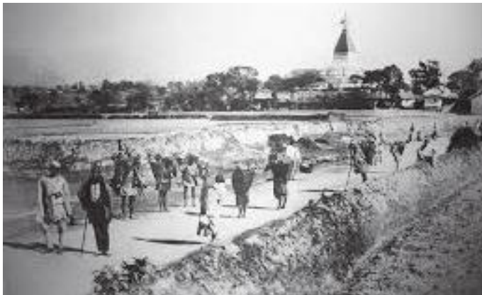
बौद्धनाथको यही बाटोबाट हिँडेर हामी सुन्दरीजल गएका थियौं