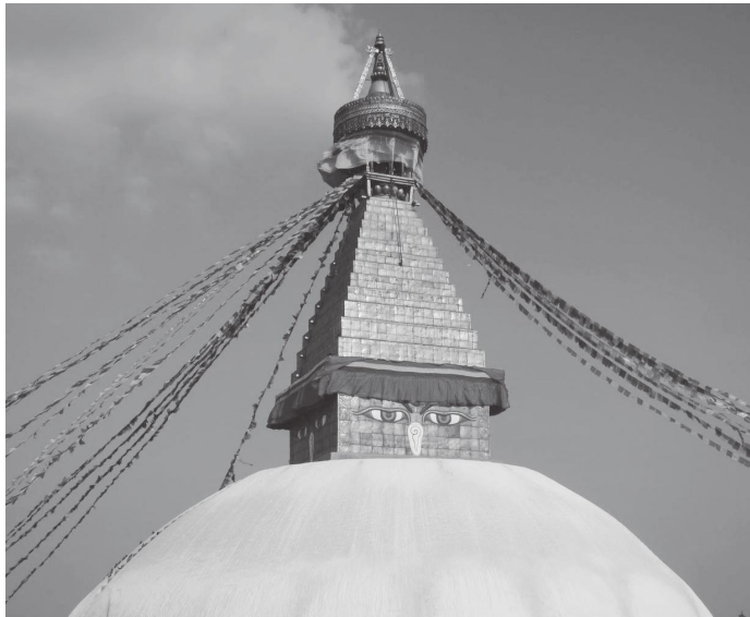
३५ किलो सुनको जलपले बनिएको नयाँ बौद्धनाथ स्तुपा