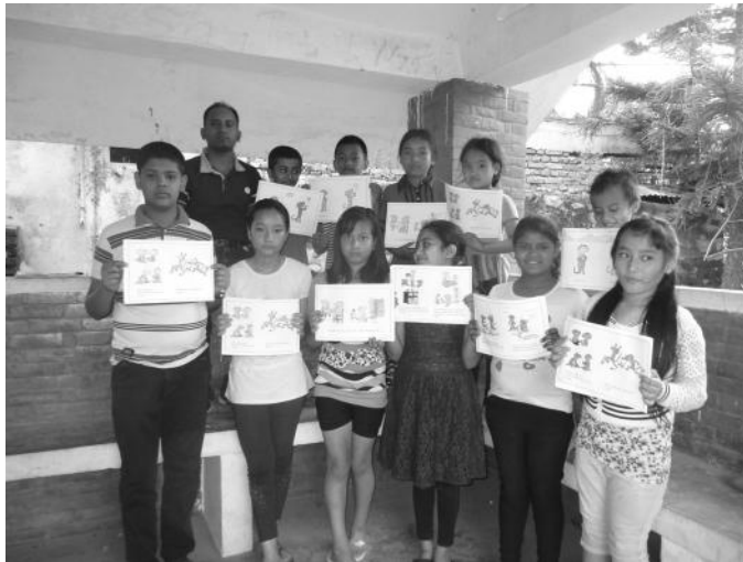
इन्द्रायणी बालक्लवका पदाधिकारी सामुहिक तस्विरमा