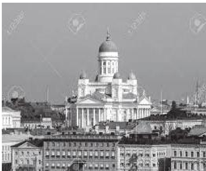
क्याथेड्रल मुख्य डोमसहित अन्य चार साना डोमहरू