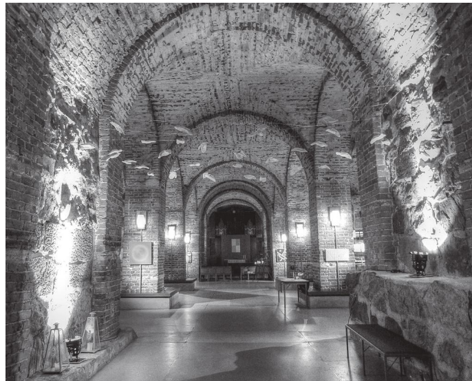
क्याथेड्रलको क्रिप्ट (छिडी) यस्तो रहेछ