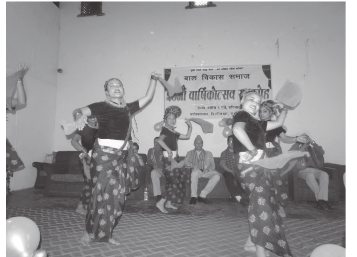
नृत्य प्रस्तुत गर्दै बालकलका पदाधिकारीहरू