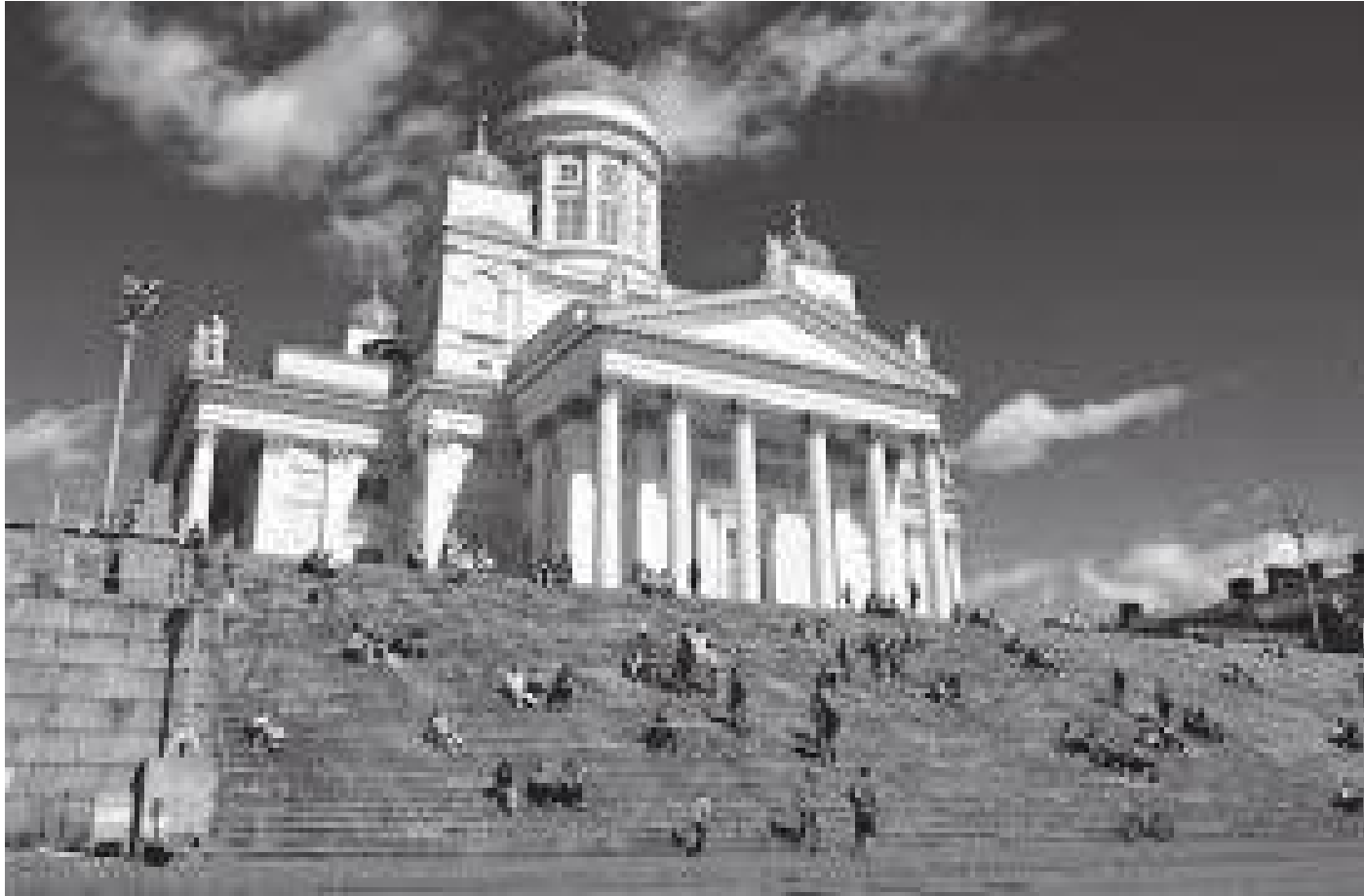
अगाडिबाट हेर्दा क्याथेड्रल यस्तो देखिन्छ