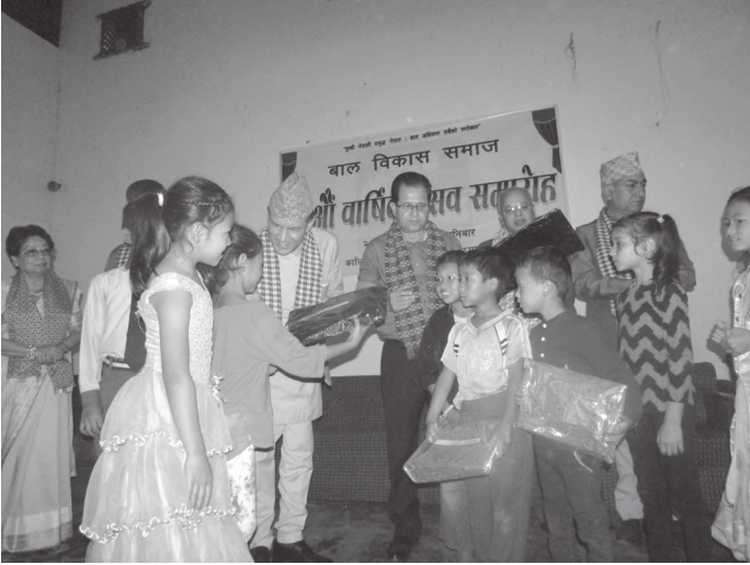
पुरस्कार ग्रहण गर्दै छात्रवृत्तिका बालबालिकाहरू