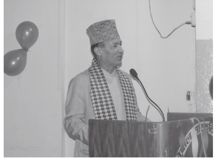
मन्तव्य राख्दै कार्यक्रमका प्रमुख अतिथि