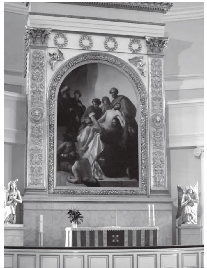
क्याथेड्रलभित्र सजाइएका पेन्टिङहरू

चर्च र यसको परिसरलाई हेलसिन्कीकै सबैभन्दा महत्वपूर्ण स्थल मानिदो रहेछ। क्याथेड्रलमा पर्ने बित्तिकै सबैभन्दा पहिले रसियन बादशाह अलेक्जेण्डर दोस्रोको मूर्ति देखिदो रहेछ। नवशास्त्रीय शैलीमा बनेको यो क्याथेड्रलको बीचका हरियो गजुर (डोम) लाई चारैतिरबाट अतिरिक्त ससाना गजुरहरूले घेरेको रहेछ। मुख्य क्याथेड्रलको डिजाइन कार्ल लुडविग एञ्जेलले गरेका रहेछन् भने यसका ससाना चार डोमहरू उनीपछिका अर्का वास्तुविद एन्स्ट लोहरमानले गरेका रहेछन्। मुख्य चर्च क्याथेड्रलसँगै उनैले डिजाइन गरेको ससाना सुन्दर भवनहरू पनि रहेछन्। ग्रीक क्रस वास्तुकला याने बीचमा चार कुने स्क्वायर र चारैतिर एकै समानले फैलिएका मोहोडाहरू रहेछन्। यिनै लोहरमानले दुईवटा घण्टाघर क्याथेड्रलसँगै बनाएका रहेछन्, यसबाहेक १२ वटा पादरीहरूको घातुको