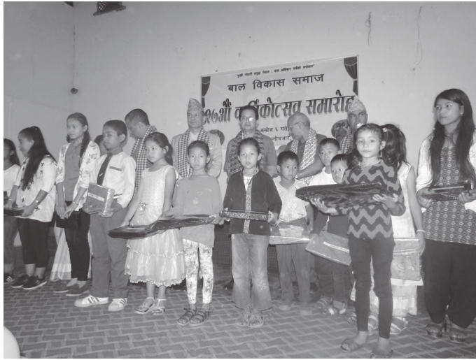
सामुहिक तस्विरमा बालबालिका तथा अतिथि गण