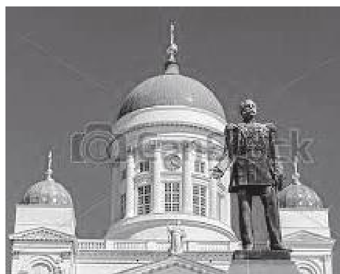
क्याथेड्रल अगाडि रहेको रसियन बादशाहको मूर्ति