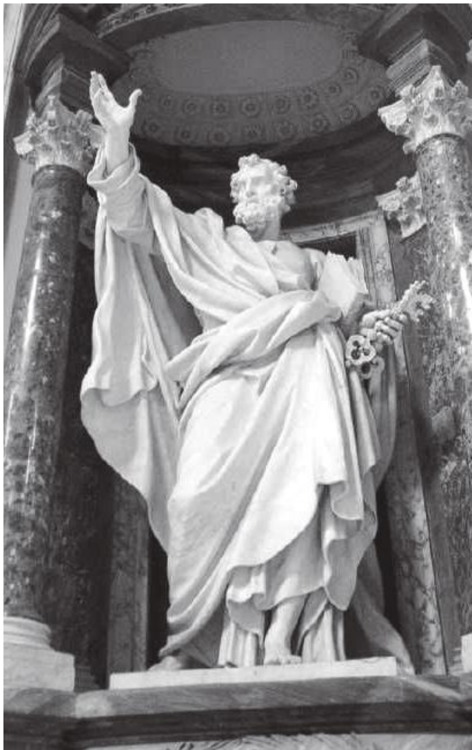
क्याथेड्रलभित्र दलिनमुनिको भित्तामा टाँसिएको पादरीको मूर्ति