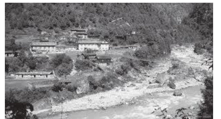
लुक्लापछिको हाम्रो पहिलो विश्रामस्थल फाक्दिड

छैटौं दिन विहान भने हामी सबै उठ्यौं। सातैबजे हामी आफ्नो