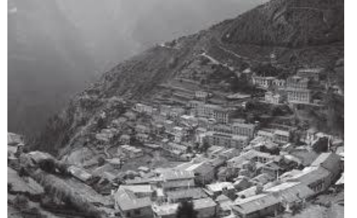
स्याङबोचेबाट नाम्चे भर्दा देखिने नाम्चे बजार