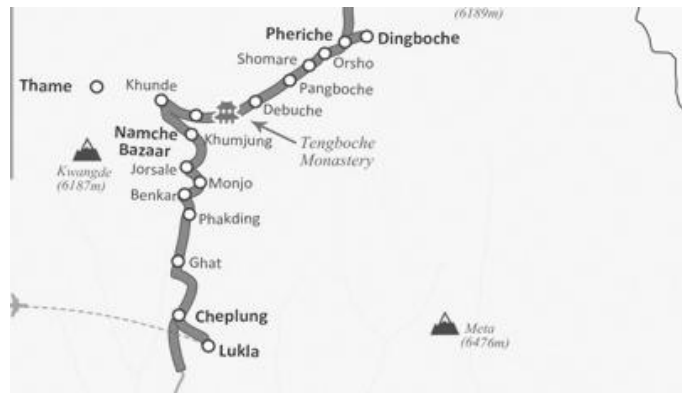
हामीले पार गरेको लुक्लादेखिको थेंगबोचेसम्मको दूरी