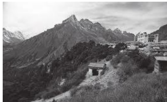
थकान लाग्दा उकालो सकिएपछि पुगेको अन्तिम गन्तव्य थेंगबोचे