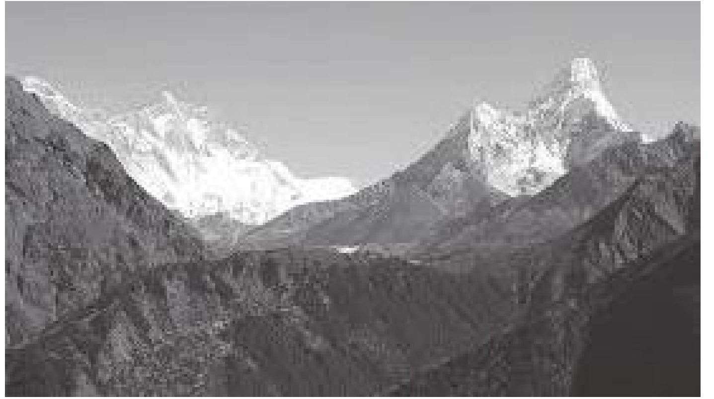
नाम्चेबाट थेंगबोचे जाँदै गर्दा देखिने आमा डब्लम र सगरमाथाको चुचुरोको दृश्य

पाँचौं दिन विहान नौ बजे तिबेटियन चिया ब्रेड खाएर हामी स्याङबोचेतिर सोभियो। करिब दुई घण्टा हिजो आएकै बाटो दोहोरियो। तत्पश्चात उत्तर थेंगबोचे र दक्षिण स्याङबोचे छुट्टिने ठाउँमा आएर हामी केहीबेर सुस्तायौं। त्यसपछि पुनः धुपीको जंगल शुरु भयो। करिब दुई घण्टा जति हिँडपछि हामी स्याङबोचेको हवाई मैदानमा आइपुग्यौं। त्यतिखेर दिनको एक बजेको थियो। स्थानीय रेस्टुराँमा दाल भात खाई केही बेर सुस्ताई हामी विस्तारै नाम्चे भर्न थाल्यौं। त्यहाँ रुखहरूभन्दा पनि विभिन्न