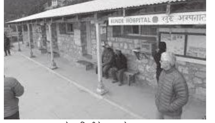
कुण्डेमा हिलरीले बनाएको अस्पताल