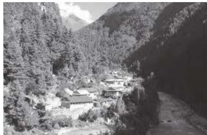
पहिलो रात बिताएको स्थल जोरसाले