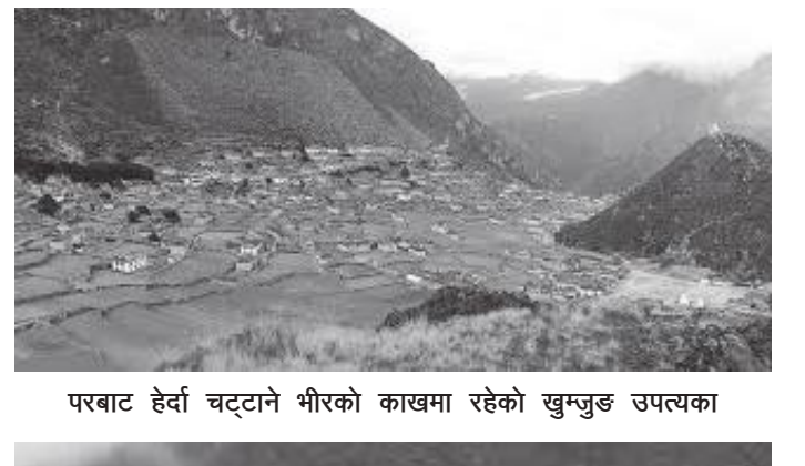
परबाट हेर्दा चट्टाने भीरको काखमा रहेको खुमजुङ उपत्यका