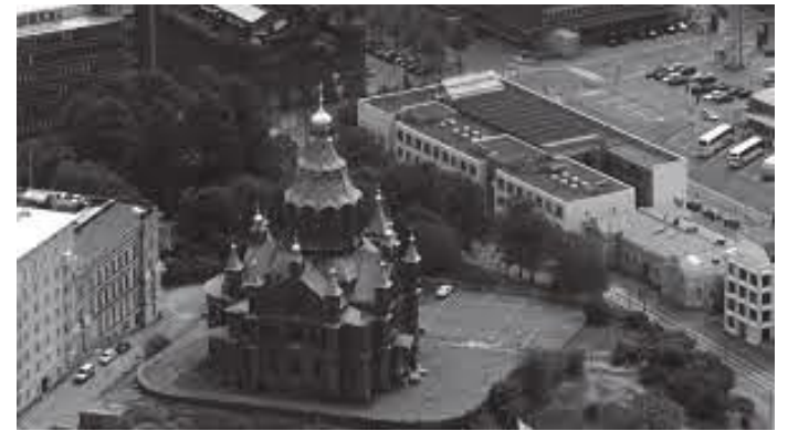
माथिबाट हेर्दा पूरै क्याथेड्रल यस्तो देखिन्छ