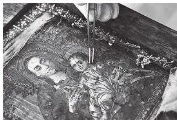
चर्चभित्रको थियोटोकसको चित्र