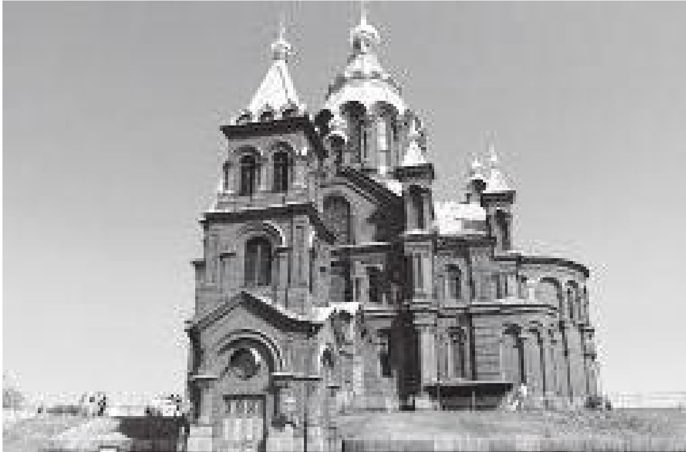
अगाडिबाट हेर्दा उस्पेन्स्की क्याथेड्रल यस्तो देखिन्छ