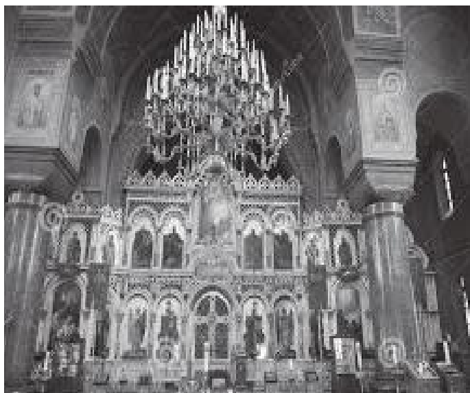
क्याथेड्रलको कलात्मक भित्री भाग यस्तो रहेछ