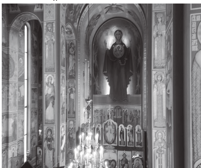
क्याथेड्रल भित्रको सेन्ट निकोलसको मूर्ति

हेलसिन्कीको क्रनुनहाकारिथित हेलसिन्की क्याथेड्रल हेरिसकदा दिनको १ वजेको थियो । बाँकी समय हेलसिन्कीकै अर्को महत्वपूर्ण उस्पेन्स्की क्याथेड्रल हेरी रात्री रेलबाट फिनलैण्डको अर्को शहर टाम्पेरे जाने योजना मुताविक म त्यता तिर लागे । हेलसिन्की क्याथेड्रलबाट एक किलो मिटर भन्दा अलि वढीको दुरीमा रहेछ यो क्याथेड्रल । त्यसैले म पैदलै त्यता तिर लागे । विस्तारै हेलसिन्की शहर हेर्दै, फोटो खिच्दै जादा म ४५ मिनेटमा त्यस क्याथेड्रल पुगे । उस्पेन्स्की क्याथेड्रल यो क्याथेड्रल फिनलैण्डकै मुख्य पूर्वीय अर्थोडक्स चर्च रहेछ । यो भर्जिन मेरी (थियोटोकस) मा समर्पित क्याथेड्रल रहेछ । थियोटोकस नाम स्लाभोनिक शब्द उस्पेन्सीबाट आएको रहेछ जसको अर्थ चीर निद्रा, मृत्यु वा समाधी भन्ने बुझिंदो रहेछ । क्राइष्टकी माता भर्जिन मेरी यस चर्चभित्र चीर निन्द्रामा रहेको कारण यस क्याथेड्रलको नाम पनि उस्पेन्सी भनेर राखिएको रहेछ । यो चर्चको डिजाइन रसियन वास्तुविद आलेक्सी गोर्नोस्ताभेभले गरेका रहेछन । सन् १८६२ मा आलेक्सीको निधन भएपछि यो चर्चको निर्माण कार्य शुरु भई ६ वर्ष याने सन् १८६८ मा सम्पन्न भएको रहेछ । यस चर्चको छिडी तला (क्रिप्ट) भने आलेक्जेण्डर होटोभिज्कीको नाममा राखिएको रहेछ जो सन् १९१४ देखि १९१७ सम्म यसै चर्चमा भिकार रहेछन । तीनतिरबाट पानीले घेरिएको काटायानोक्का थुम्कोमा रहेको यस चर्चको परिसरबाट हेर्दा हेलसिन्की शहर ओम्फेलमा पर्ने रहेछ । चर्चको पछाडिपट्टि भित्तामा रसियन बादशाह अलेक्जेण्डर द्वितीयको बारेको धातुपत्र (प्लाक) टाँसिएको