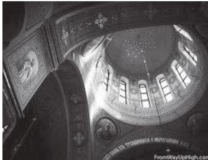
क्याथेड्रलको गुम्बजमुनिको दलिनमा रहेका कलाकृतिहरू