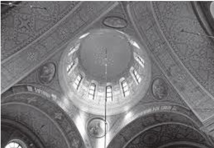
क्याथेड्रलको गुम्बज भित्रबाट हेर्दा यस्तो देखिन्छ