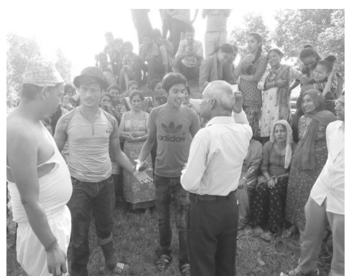
मदानपुरमा नाटक प्रस्तुत गर्दै