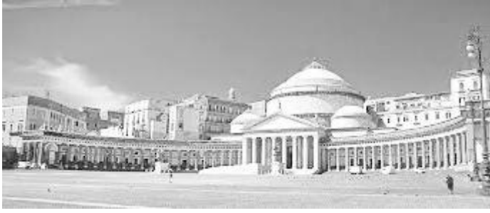
ज्वालामुखीले विनाश गर्नुअगाडिको पोम्पेइ