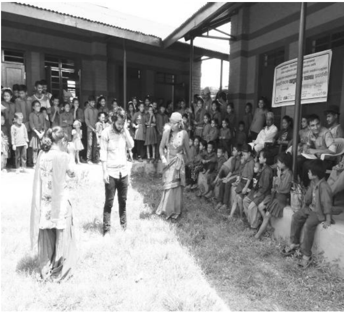
गोर्स्याङमा नाटक प्रदर्शनका भलकहरु