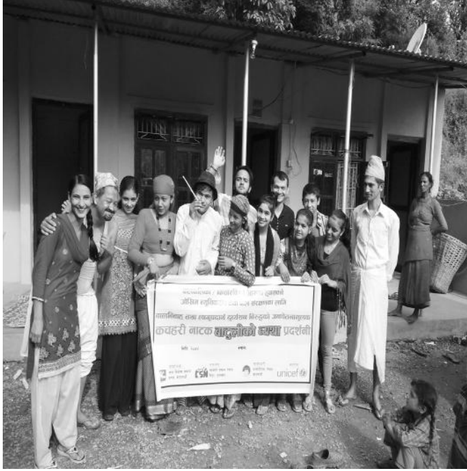
बेलकोटमा कचहरी नाटक प्रस्तुत गर्दै