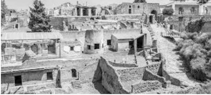
ज्वालामुखीबाट निस्केको लाभाले पुरेपछि उत्खनन गरिएको पोम्पेइको भग्नावशेष