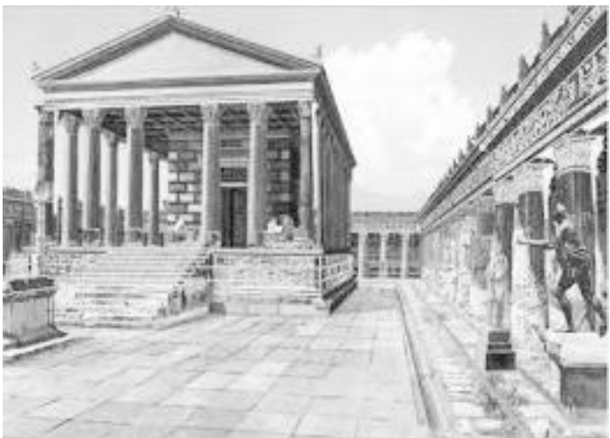
लाभाले पुर्नुअगाडिको एपोलो मन्दिर