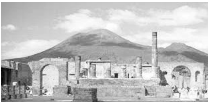
उत्खननपछि पोम्पेइ र त्यसको पछाडि भेसुभियो ज्वालामुखी