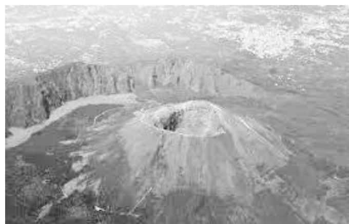
यही भेसुभियो ज्वालामुखी पड्केर पोम्पेइ भग्नावशेषमा परिणत भएको थियो