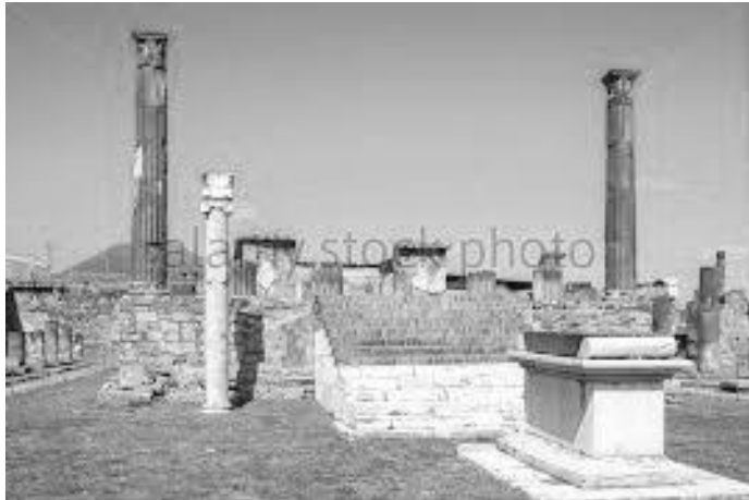
लाभा निकाली उत्खनन गरिएपछि एपोलोको मन्दिरको भग्नावशेष