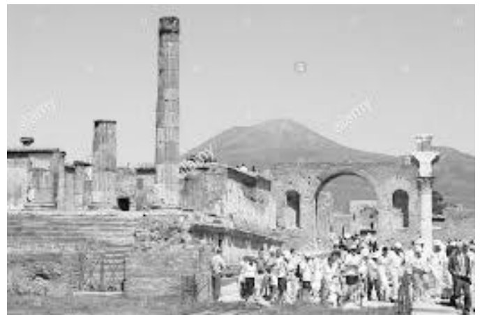
पोम्पेइमा पर्यटकको घुइँचो