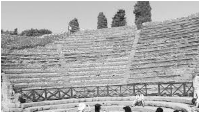
पोम्पेइको खुला नाट्यशाला