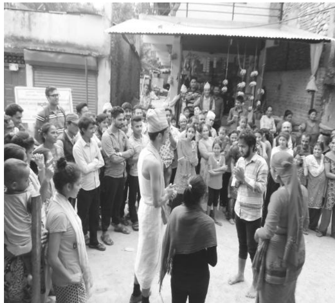
खड्ग भञ्ज्याङमा नाटक प्रस्तुत गर्दै