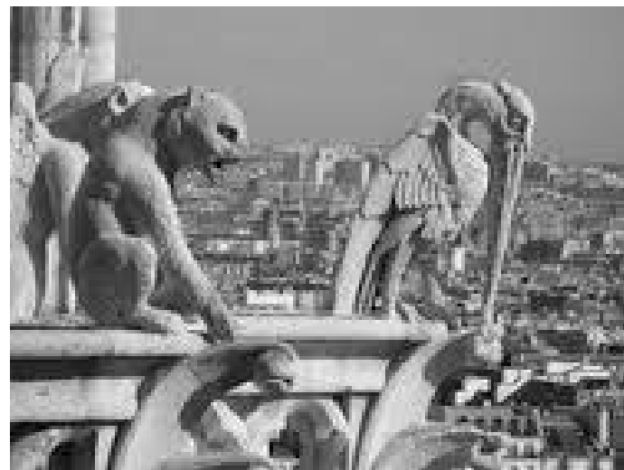
नोत्रेदामको टुप्पामा रहेको गागोले र त्यहाँबाट देखिने पेरिस सहर

पेरिसको पहिलो दिन आइफल टावरमा, दोस्रो दिनभर लुभ्र म्युजियममा, तेस्रो दिनभर ला कन्कर्डमा बिताएपछि चौथो दिन म विहान खाना खाएर पेरिसस्थित विश्व प्रसिद्ध विश्व सम्पदा नोत्रे दाम हेर्न पुगें। पेरिसमा चार दिन घुम्नुजेल हातमा सहरको नक्सा लिएर म सबै ठाउँमा पैदलै पुगें किनकी त्यसो गर्दा सहर पनि हेर्न पाइन्छ्यो। त्यस दिन पनि नेपाली राजदुतावास ला मुयतबाट खाना खाएर सोभिएँ म नोत्रे दामतिर। नोत्रे दामको अर्थ नेपालीमा हाम्री नारी भन्ने हुन्छ। यो पेरिसमा रहेको मध्यकालीन क्याथोलिक चर्च हो र यो विश्व सम्पदा सूचीमा पनि रहेको छ। यो फ्रेंच गोथिक शैलीमा बनेको विश्वको ठूलामध्ये एक चर्च हो। यस चर्चभित्र राखिएको मूर्तिकलामा पाइने प्रकृतिवाद र सिसामा गरिने रंगिन कलाकारिताले यो चर्चलाई विश्वविख्यात बनाएको हो। यसको साथै यो चर्च पेरिसको आर्कविशपको क्याथेड्रल पनि हो र यहाँको ढुकुटीमा क्याथोलिक धर्मका अतिपवित्र ग्रन्थहरू संग्रहित छन्।