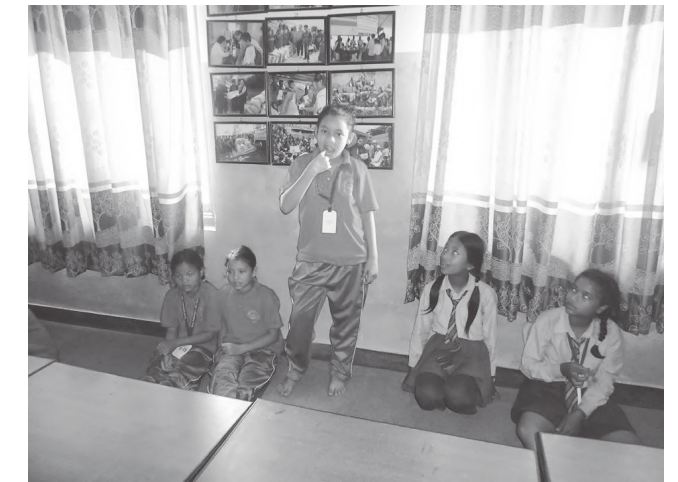
छलफलमा सहभागी बालबालिकाहरू