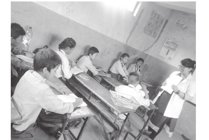
बालबालिकालाई स्वास्थ्यको बारेमा बताउदै स्वास्थ्य इन्चार्ज