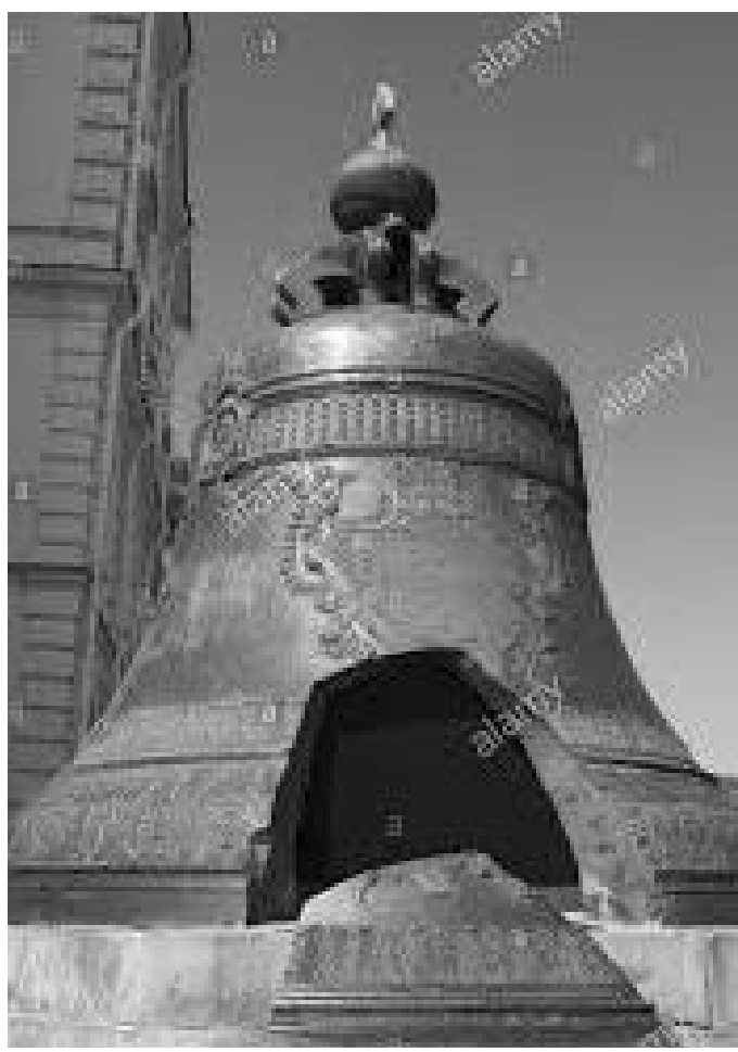
नोत्रेदाममा राखिएको १३ टन वजन भएको घण्ट