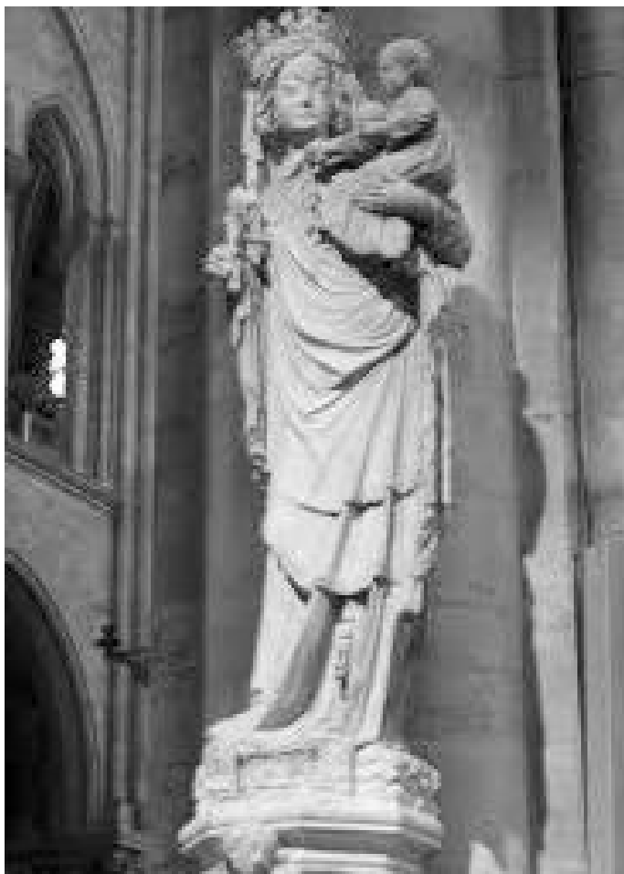
नोत्रेदामभित्र कुमारी मेरीको बच्चा क्राइस्टलाई बोकेको मूर्ति