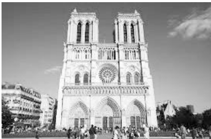
नोत्रेदामको पश्चिमी मोहडा