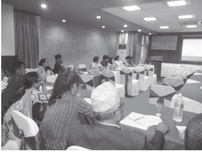
छलफलमा सहभागी जनप्रतिनिधिहरू