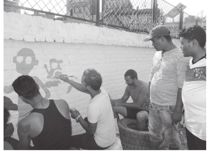
चिन्डेन पार्कमा पार्क संरक्षण समितिका पदाधिकारीहरू आफै पेंट गर्दै