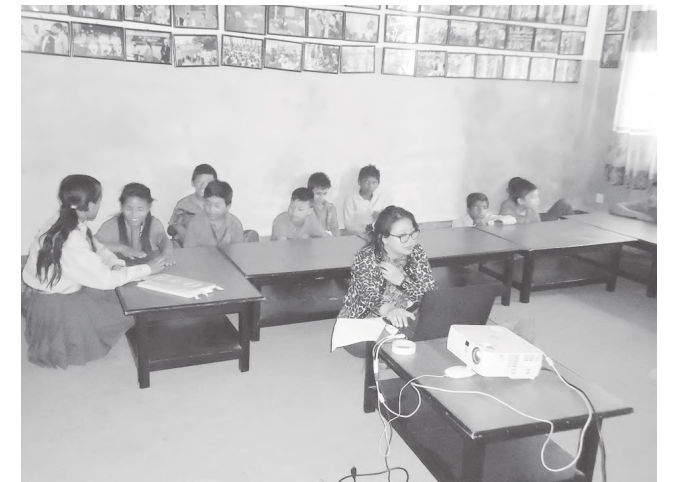
बालबालिकाहरूलाई छलफल गराउदै स्वास्थ्य इन्चार्ज