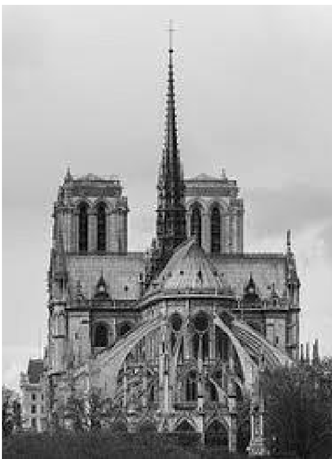
नोत्रेदामको पूर्वी मोहडा