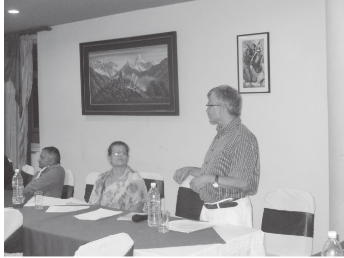
मन्तव्य राख्दै संस्थाका महासचिव