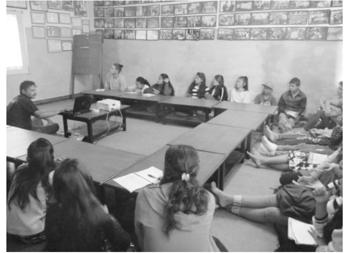
तालिमको सहजीकरण गर्दै संस्थाका कर्मचारी