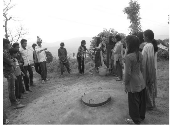
हात धुने विधि सिक्दै सहभागीहरू