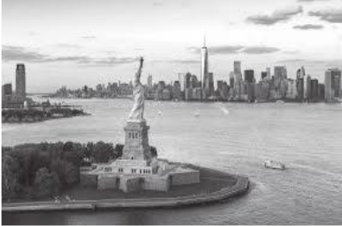
मूर्ति रहेको टापुबाट देखिने न्युयोर्क सहर