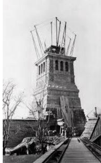
मूर्ति अड्याउने पेडस्टल निर्माणवस्था