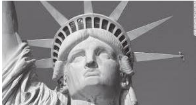
मूर्तिको टाउको र निधारमा रहेका दृश्यावलोकन गर्ने भ्याल

कुरा सन् २००३ मार्च महिनाको हो । त्यतिखेर म गलैचा निकासीकर्ता संघको कार्यकारी सल्लाहकार थिएँ । विश्ववजारमा नेपाली गलैचाको प्रवर्द्धन गर्ने जिम्मा पाएको थिएँ । यसैकारण विश्वभरिका अन्तर्राष्ट्रिय मेलाहरूमा भाग लिई, 'नेपाल साँभ' नामक व्यापारिक अन्तर्क्रिया कार्यक्रमको आयोजना गर्नुपर्छ । त्यसैक्रममा सन् २००३ को अप्रिल महिनामा न्युयोर्कमा आयोजना हुने होमटेक्सटायल मेलाका हामीले सहभागिता जनाउने निर्णय गर्छौं । नेपाल गलैचा निकासीकर्ता संघका ५ सदस्य कम्पनीहरूले उक्त मेलाका स्टल लिई आफ्नो कारखानाबाट उत्पादित गलैचा प्रदर्शन गरी नयाँ अमेरिकी क्रेताहरू आकर्षित गर्ने रणनीतिका साथ अमेरिका जाने निधो भयो । मेरो काम चाहिँ उक्त मेला अवधिमा एक नेपाल साँभको आयोजना गरी नेपाली गलैचाका अमेरिकी क्रेता र नेपाली विक्रेताबीच व्यापारिक अन्तर्क्रिया आयोजना गर्नुको अतिरिक्त स्टलहरूको व्यवस्थापनमा सहजीकरण गर्ने कार्य गर्नुपर्छ ।