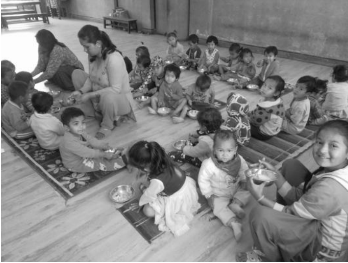
दिवा खाजा खाँदै बालबालिकाहरू