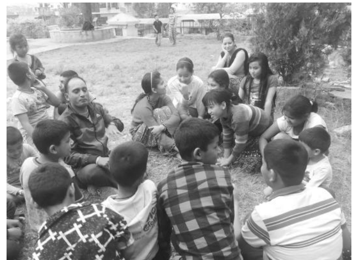
कार्यक्रममा बालबालिका तथा अभिभावक