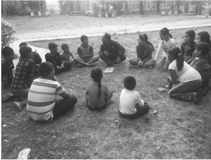
बालबालिकासँग छलफल गर्दै संस्थाका कर्मचारी