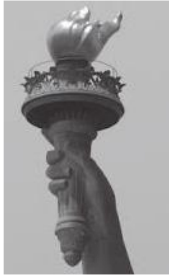
मूर्तिको हातले उचालेको मसाल र त्यसमुनिको भ्यु टावर