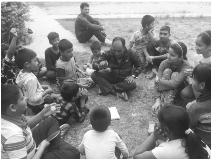
परामर्श कार्यक्रमका सहभागीहरू