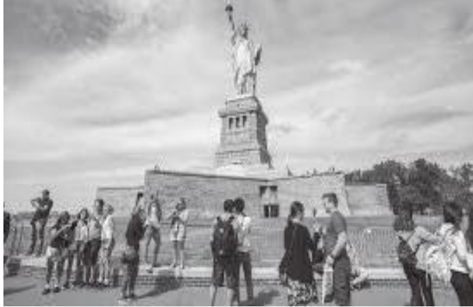
मूर्ति अगाडिको भाग