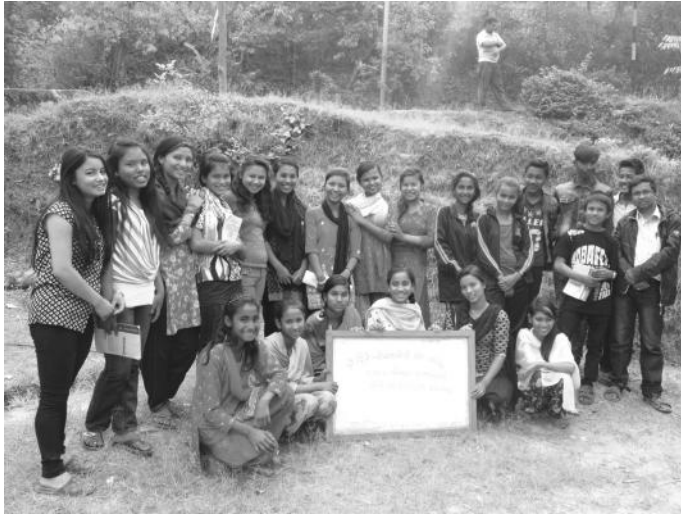
तालिमपश्चात सामूहिक तस्वीरमा