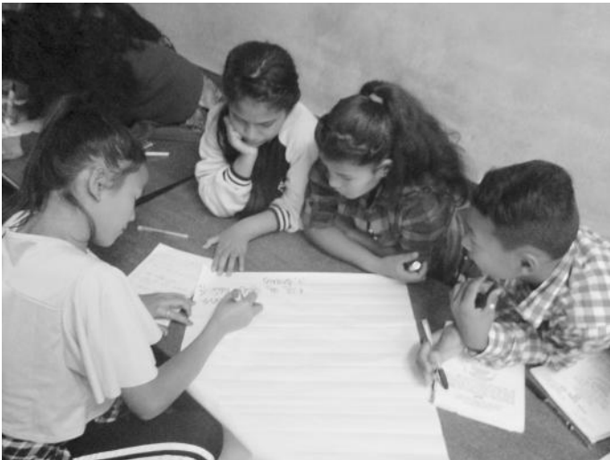
सामूहिक कार्य गर्दै सहभागीहरू