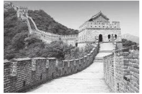
बेजिङ महानगरमा राखिएको पर्खालको अंश