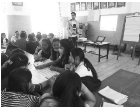
तालिमको सहजीकरण गर्दै संस्थाका कर्मचारी