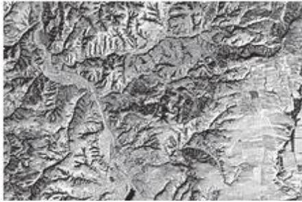
अन्तरिक्षबाट देखिएको ग्रेटवाल