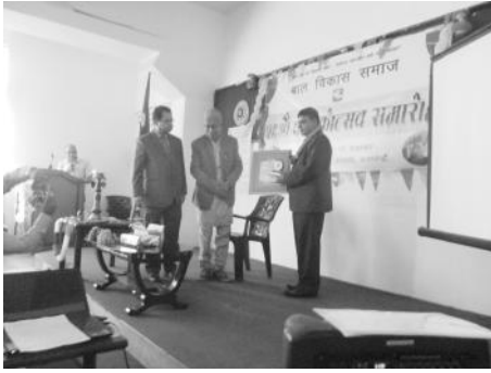
प्रमुख अतिथिबाट सम्मान ग्रहण गर्दै संस्थाका कर्मचारी