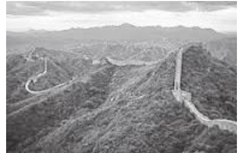
फन् टाढाबाट देखिने ग्रेटवालको धेरै लामो भाग