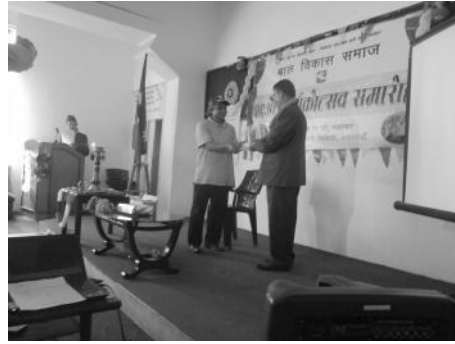
छात्रवृत्ति रकम ग्रहण गर्दै संस्थाका कोषाध्यक्ष