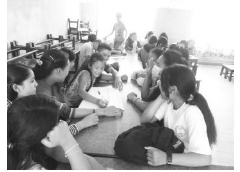
समूह कार्य गर्दै तालिमका सहभागीहरु