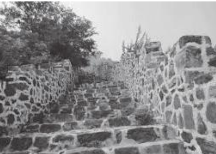
ग्रेटवालमा कहीं कहीं सिँडी पनि रहेको छ