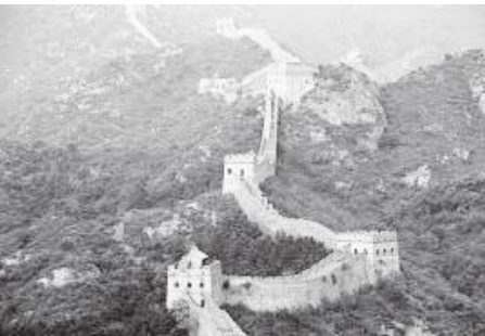
टाढाबाट देखिने ग्रेटवालको लामो भाग