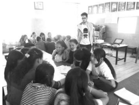
समूह कार्यमा छलफल गर्दै सहभागीहरु