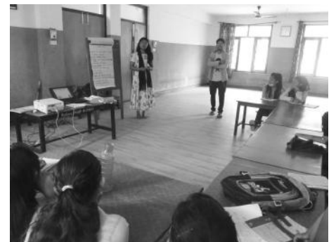
तालिममा प्रस्तुतीकरण गर्दै सहभागी

बाल विकास समाजको २६ औं वार्षिकोत्सव बाल विकास समाजको २६ औं वार्षिकोत्सव एक समारोहका साथ सम्पन्न भएको छ। संस्थाले बालवालिाकारहरूको क्षेत्रमा काम गरेको २६ औं वसन्त पार गरी धेरै बालवालिाकारहरूको मुहारमा खुशी ल्याउन सफल भएको छ। वरिष्ठ साहित्यकार तथा संस्कृत विद सत्यमोहन जोशीको प्रमुख अतिथ्यतामा नेपाल प्रज्ञा प्रतिष्ठानमा सम्पन्न भएको वार्षिक उत्सव कार्यक्रममा संस्थाका आजीवन सदस्य, कार्यसमिति पदाधिकारी, सल्लाहकार समिति, विभिन्न सरकारी तथा गैर सरकारी निकायका प्रतिनिधि, पत्रकार लगायत अन्य व्यक्तित्वहरूको बाक्लो सहभागिता रहेको थियो।