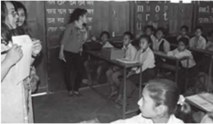
विद्यालयमा स्वास्थ्य र सरसफाईका बारेमा अभिमुखिकरण गर्दै