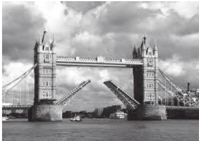
ठूला जहाज आवतजावत गर्दा यसरी पुल उचालिंदो रहेछ