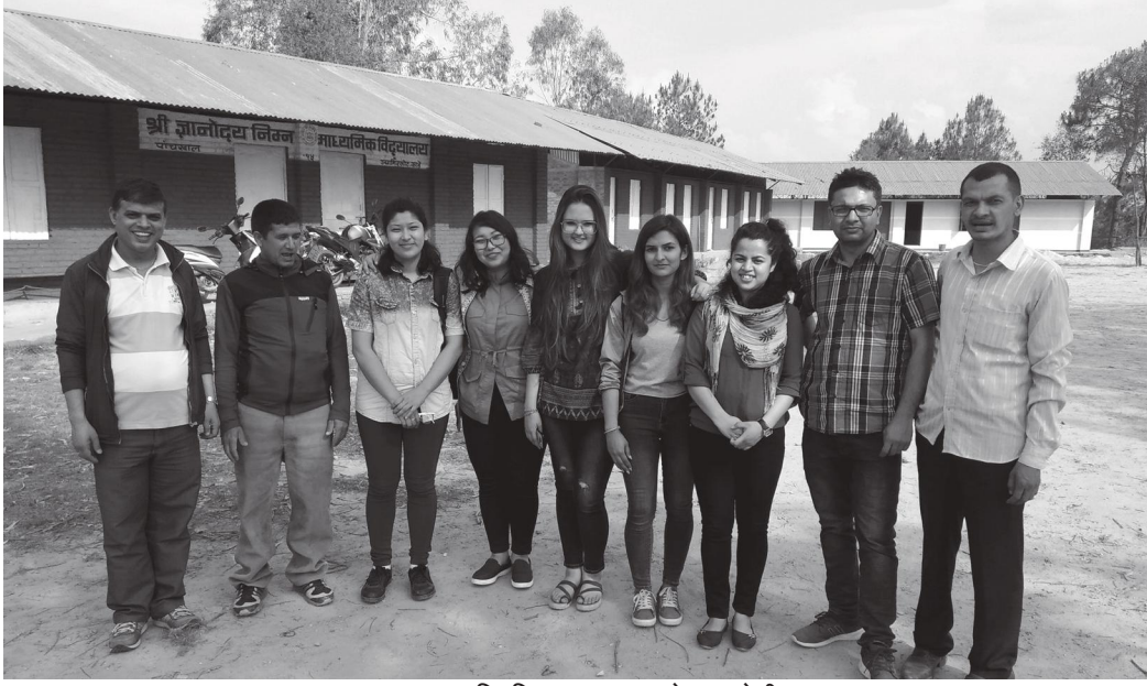
स्वास्थ्य अभिमुखिकरण र अवलोकन टोली