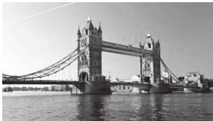
नजिकैबाट हेर्दा देखिने टावर ब्रिज