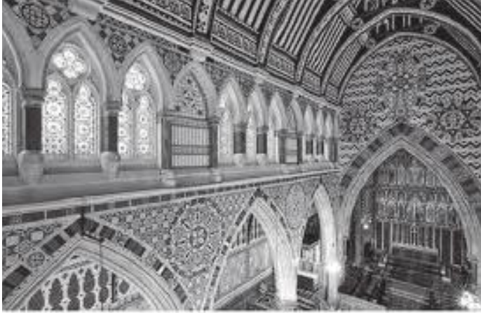
चर्चको भित्तामा गरिएका कलाकृतिहरू