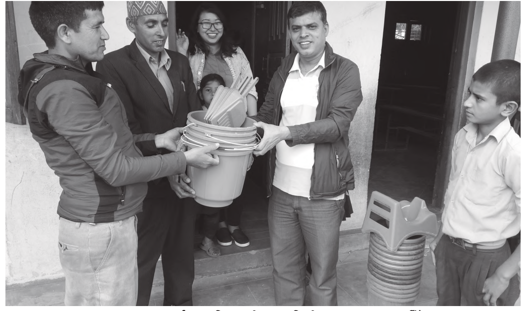
वातावरण सरसफाईका लागि सामग्री र स्यानिटरी प्याड हस्तान्तरण गरिँदै