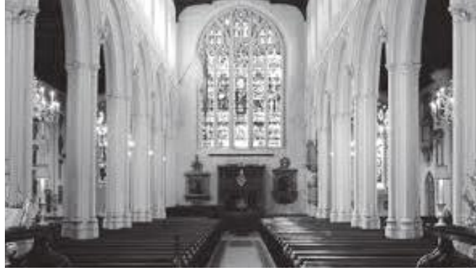
मागरेट चर्चको प्रार्थना कक्ष