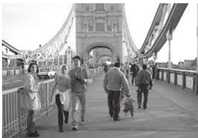
टावर ब्रिजमा पर्यटकहरू

जेम्सले यस चर्चको उत्तरपश्चिममा टावर बनाउन लगाएका रहेछन जसको निर्माण सम्पन्न गर्न चार वर्ष लागेको रहेछ। चर्चको भित्री भागमा जुन साजसज्जा र कलाकारिताको प्रस्तुति छ ती सबै सन् १८७७ भित्र नै बनाइएको रहेछ। हरेक सालको अक्टोबर महिनामा यस चर्चमा