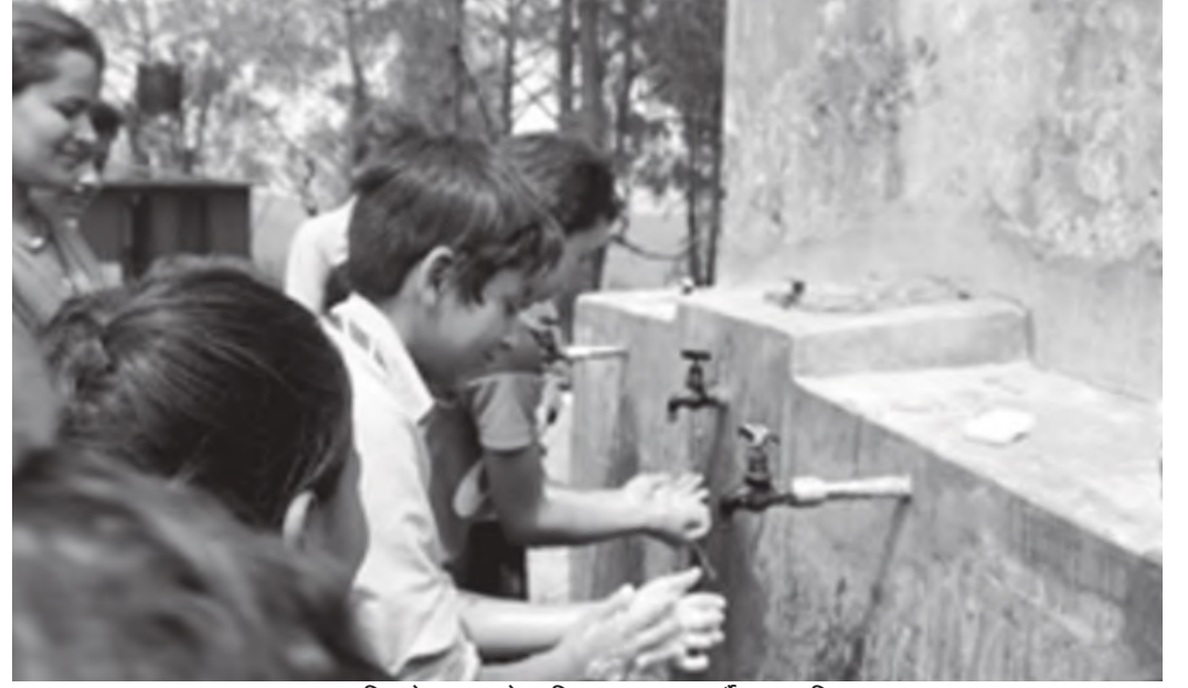
छ तरिकाले हात धुने तरिका अभ्यास गर्दै बालबालिका