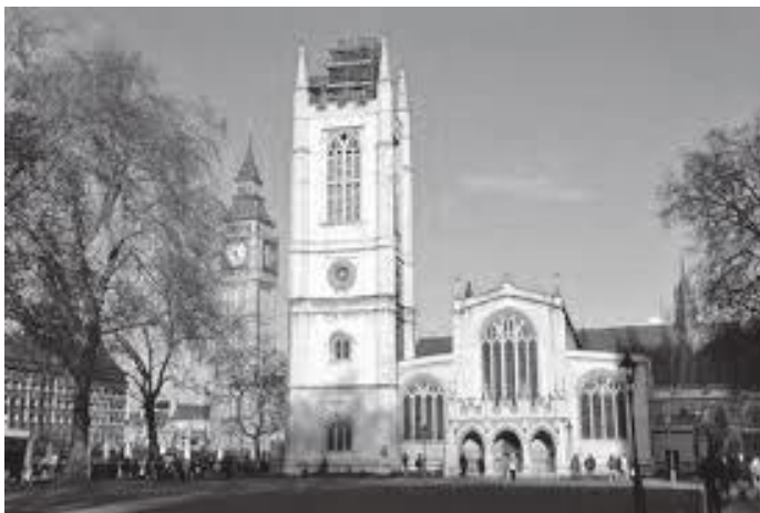
मागरेट चर्चको अग्र भाग

लण्डन पुगेको पहिलो दिन वेस्ट मिनिस्टर एब्बी र पार्लामेन्ट भवन अवलोकन गर्दागर्दै साँझ परिसकेको थियो। त्यहाँ भएका बाँकी कुरा विशेष गरेर मागरेट चर्च र अलि पर रहेको टावर ब्रिज दोस्रो दिन हेर्ने निर्णय गरी हामी क्याम्पड साइटतर्फ लाग्यौं र भोलिपल्ट ब्रेक फास्ट सकेर हामी पुनः वेस्ट मिनिस्टर आई मागरेट चर्चको अवलोकन गर्न लाग्यौं।