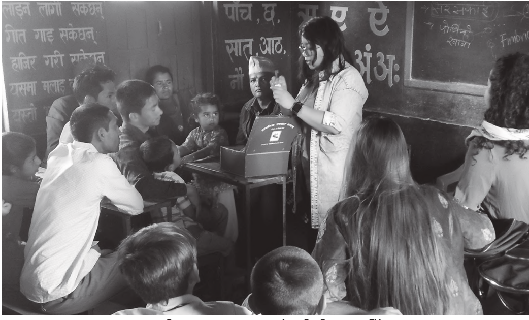
प्राथमिक उपचार बाकसका बारे अभिमुखिकरण गरिँदै