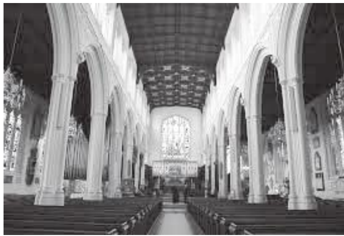
मागरेट चर्चको भित्री भाग