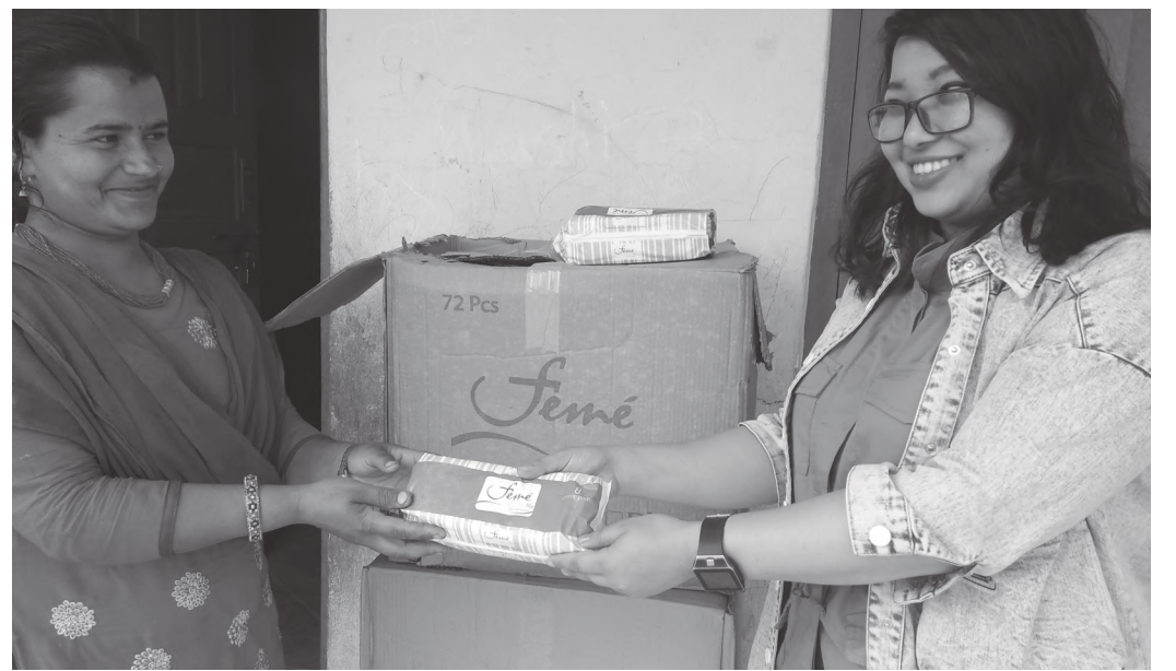
वातावरण सरसफाईका लागि सामग्री र स्यानिटरी प्याड हस्तान्तरण गरिँदै

श्री ज्ञानोदय आधारभूत विद्यालयमा अध्ययनरत कक्षा ४ देखि कक्षा ८ सम्मका २१ जना बालिकाहरूका साथै शिक्षिकाहरूलाई स्यानिटरी प्याड प्रयोग गर्ने तथा यसलाई जलाउने तरिकाको बारेमा अभिमुखिकरण गरियो। विद्यालयमा आउँदा मासिक रूपमा हुने महिनावारीका समयमा कसरी प्रयोग गर्ने भन्ने