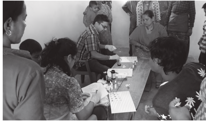
बालबालिका, अभिभावक र शिक्षकको रक्त परिक्षण गरिँदै