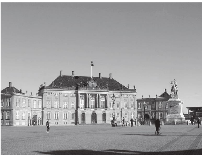
चार दरबारमध्येको तेस्रो ब्लकडोर्फ दरबार