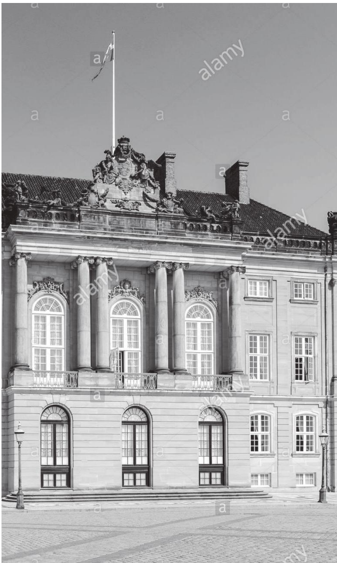
चार दरबारमध्ये दोस्रो लेभेट्ज्जी दरबार