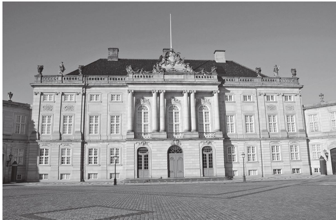
चार दरबारमध्येको पहिलो मोल्ट्के दरबार