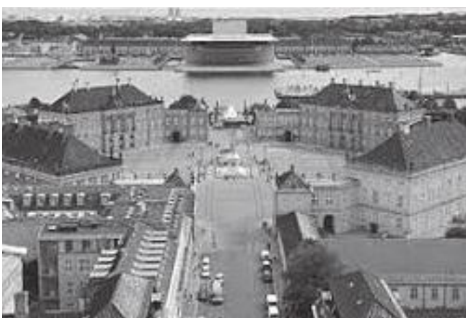
माथिबाट हेर्दा चार दरबार यस्तो देखिन्छ