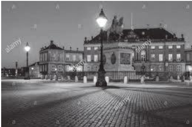
चार दरबारमध्येको चौथो स्येक दरबार