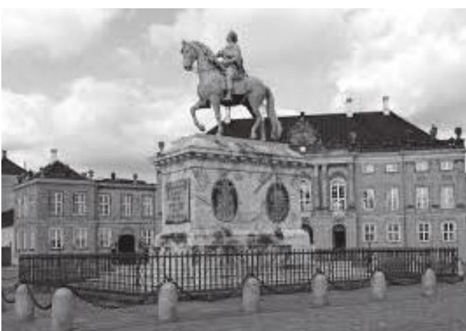
दरबारको विशाल चोकको बीचमा रहेको राजा फ्रेडरिकको घोडचढी मूर्ति