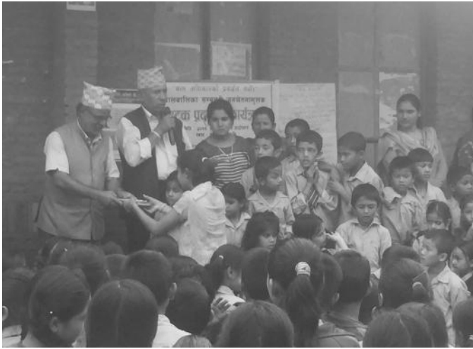
पुरस्कार वितरण गर्दै