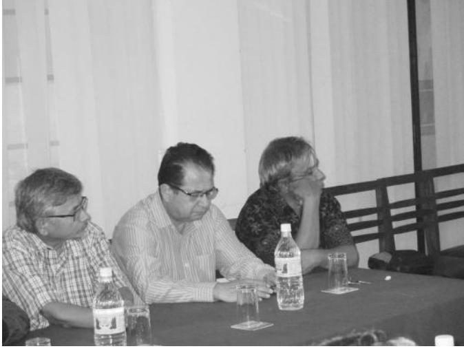
कार्यक्रममा सहभागी संस्थाका पदाधिकारी