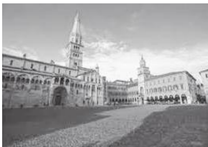
मोदेनाको पिआज्जा (स्क्वायर) ग्रान्दे