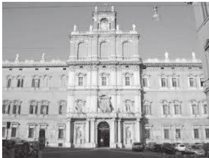
मोदेनाको डुकल प्यालेस