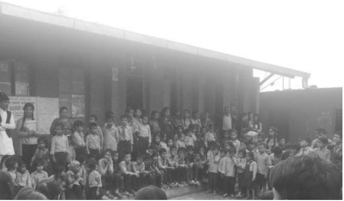
सदस्य सचिव कार्यक्रम सञ्चालन गर्दै