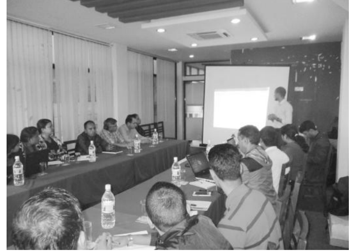
क्षमता विकास तालिमका सहभागीहरू