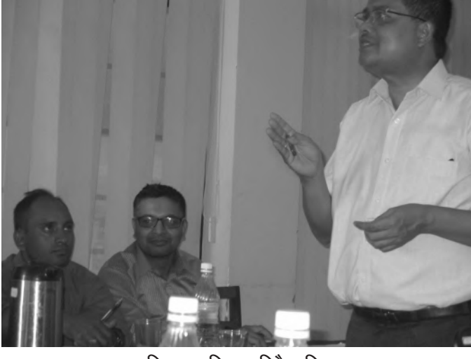
तालिममा प्रशिक्षण दिदै प्रशिक्षक