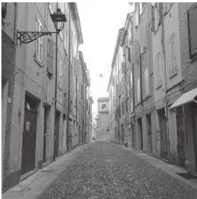
मोदेना सहरभित्रको गल्ली