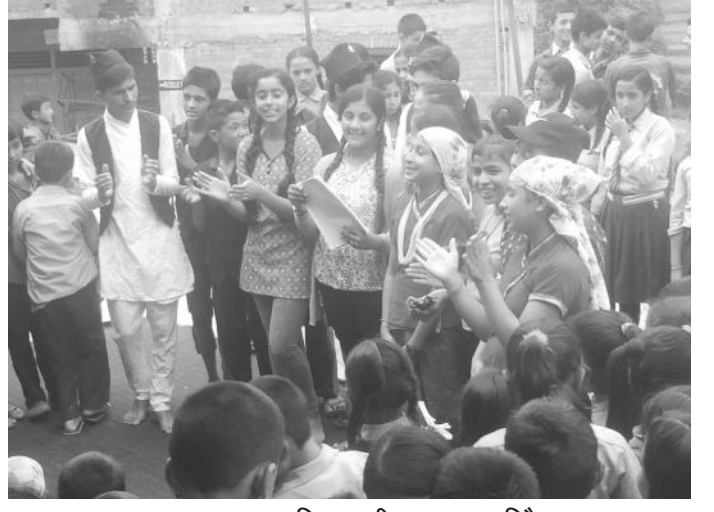
समुहमा बालअधिकार गीत प्रस्तुत गरिदै