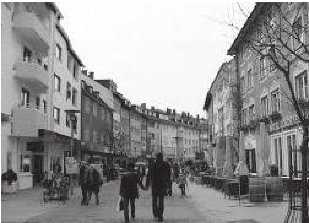
फ्रेडरिखहाफेनको पुरानो भित्री सहर

बनेपछि त यो शहर युरोपकै पर्यटकीय गन्तव्य बन्न पुगेको रहेछ। पछि फ्रान्को प्रसियन युद्धमा जर्मनीको जितपछि यो शहर जर्मन साम्राज्यमा गाभिएको रहेछ। १९औं शताब्दिमा फर्डिनान्ड फोन च्चेप्लिनले ठूलो हवाईजहाज (एअर बस च्चेप्लिन) को कारखाना नै यस शहरमा स्थापना गरी सन् १९०० को जुलाई २ तारिखका दिनमा यहीबाट च्चेप्लिन उडाएपछि प्रथम विश्व युद्धअगावै यो शहर उड्डयनको लागि विश्व प्रख्यात बन्न पुगेको रहेछ।