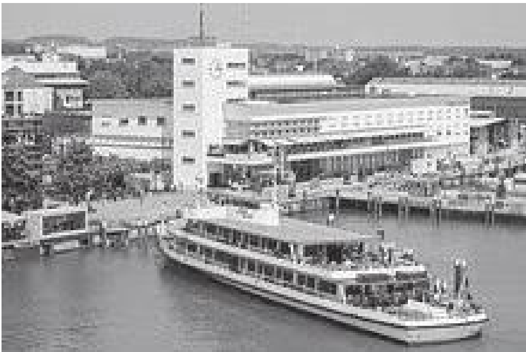
फ्रेडरिखहाफेनमा क्रुज सफारीको क्षण