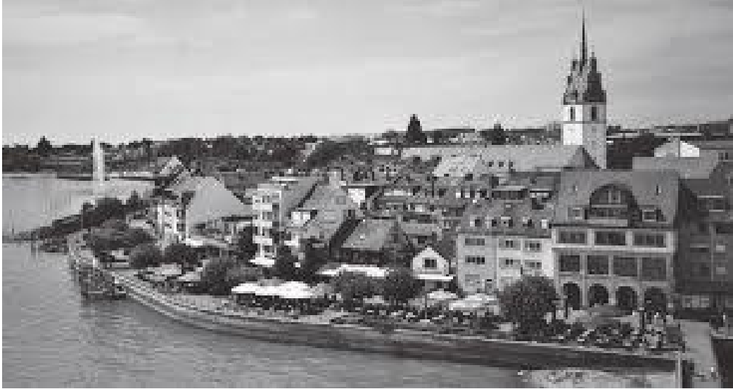
बोडेन जेको किनारमा रहेको फ्रेडरिखहाफेनको सहर