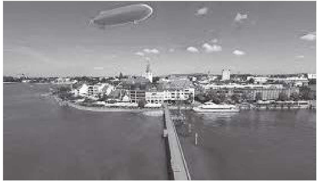
फ्रेडरिखहाफेन सहरमाथि उडिरहेको च्चेप्लिन हवाईजहाज