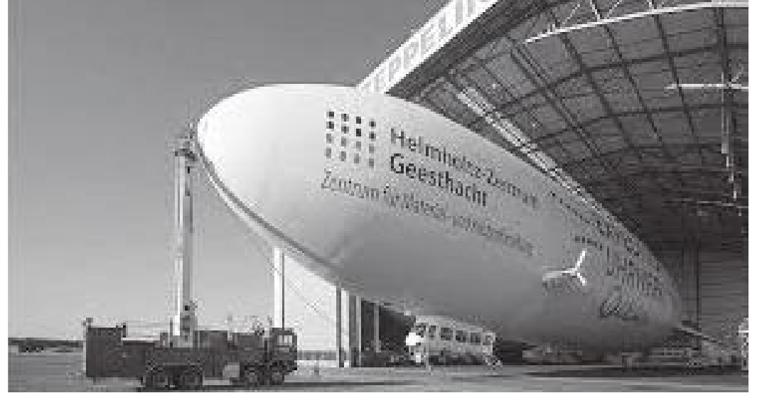
च्चेप्लिन जहाजको हेङ्गर जहाँ विश्वयुद्धताका दास कामदार ल्याएर राखिएको थियो