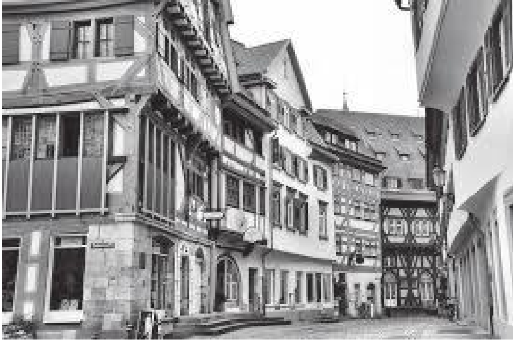
नगरको भित्री भाग ज्यादै मनमोहक रहेछ