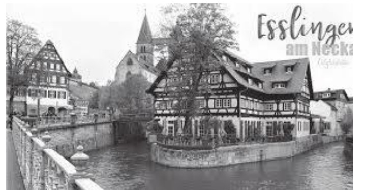
नेक्कार नदी यसरी नहर हुँदै बगेको रहेछ

स्थापना भएपछि यो विश्वविद्यालय नगरमा परिणत भएको रहेछ। प्राचीन, कलात्मक, व्यापारबाट समृद्धि हासिल गरेको, स्वस्थ खच्चर, गधा, घोडाले तान्ने टांगा र एक्कामा परम्परागत व्यापार गर्ने संस्कार कायमै रहेको, कलात्मक काठका फ्रेममा बनाइएका