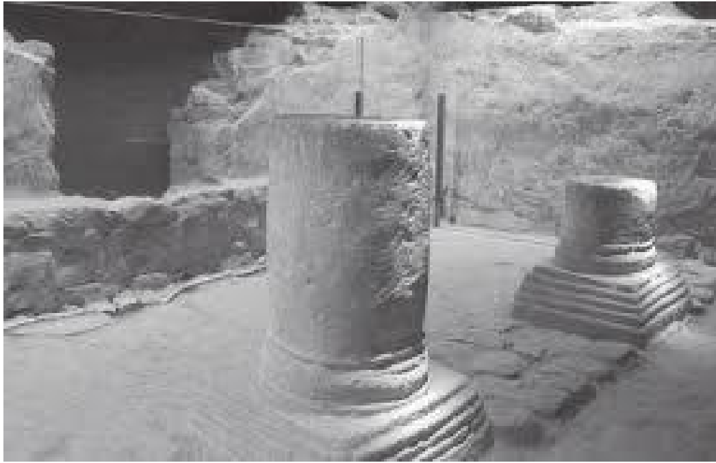
नगरमा रहेको प्राचीन पुरातात्विक क्षेत्र