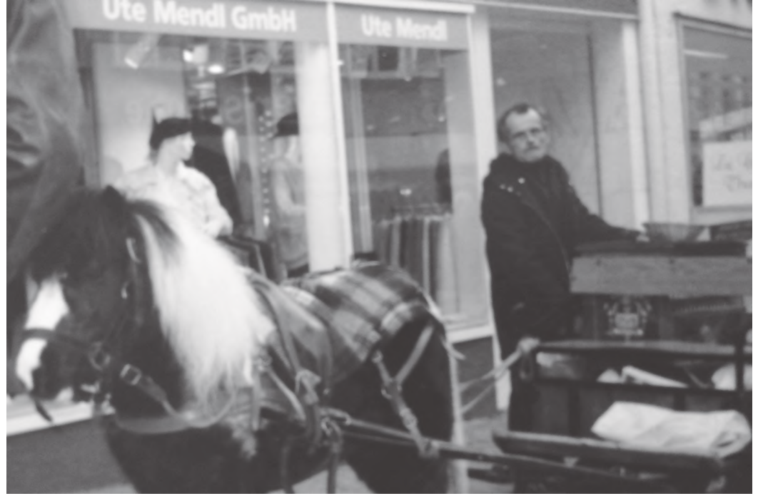
नगरमा प्रयोग हुने खच्चरले तान्ने एक्का