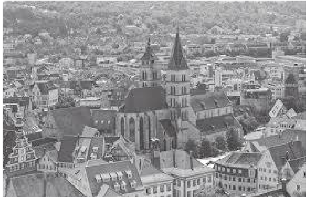
पूरे एसलिन्गन सहर यस्तो देखिन्छ

स्टुटगार्टको दरवार स्ववायर र सेपुलकल चिहान (Württemberg Mausoleum) अवलोकन गरिसक्दा दिनको ३ मात्रै बजेको थियो। सरासर स्पायर फर्कनुभन्दा बाटोमा पर्ने ऐतिहासिक शहर एसलिन्गन पनि अवलोकन गर्ने सहमति भए अनुसार हामी स्टुटगार्टबाट केही घन्टा एसलिन्गनमा विताउने निधो गरी हामी सोभै त्यता लाग्यौं। स्टुटगार्टबाट एसलिन्गनको दूरी जम्मा १७ किलोमिटर जति मात्रै हुँदा हामी ४ बज्दा एसलिन्गन पुगिसकेका थियौं। त्यहाँको सिटी सेन्टरमा हाम्रो बस अडिएपछि हामी लाग्यौं एसलिन्गनको ऐतिहासिक स्थलहरू अवलोकन गर्नेतर्फ।