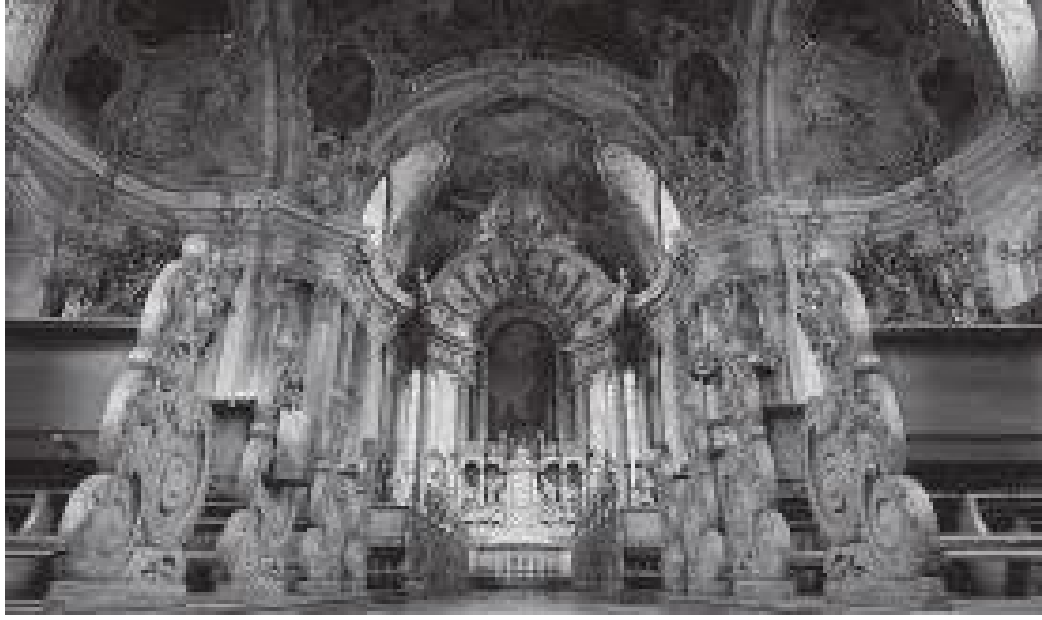
किल्लामा रहेको दरबारको भित्री भाग