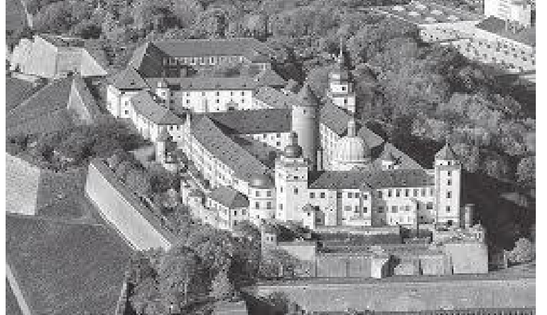
माथिबाट हेर्दा किल्लासहितको दरबार यस्तो देखिन्छ