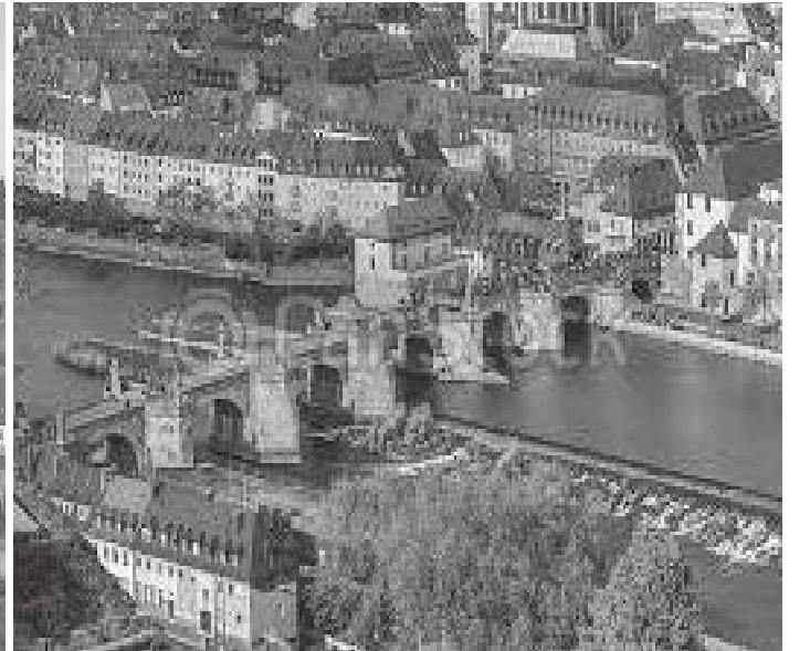
भुर्जवुर्गको पुरानो पुल माथिबाट हेर्दा

भुर्जवुर्ग रोसडेन्स दरवार अवलोकन गरिसक्दा बेलुकी भइसकेको कारण हामी शहर घुम्दै आफ्नो कोठामा फर्कियो र बेलुकाको खाना खाई गफसफ गरी कोठामा पुग्दा रातिको नौ बजिसकेको थियो। भोलिपल्ट विहान नियमित ब्रेकफास्ट गरी हामी सेमिनारमा संलग्न भयौं। बीचमा लन्चको लागि एक घण्टा विश्राम लिइसकेपछि ३ बजेसम्म हाम्रो सेमिनारले निरन्तरता पायो। तत्पश्चात हामी भुर्जवुर्गको ऐतिहासिक किल्ला मारियनवुर्ग अवलोकन गर्न त्यसतर्फ लाग्यौं। मारियनवुर्ग जाँदा बाटोमा माइन नदीको पुरानो ऐतिहासिक पुल देख्न पाईदो रहेछ। यस पुलको निर्माण सन ११२० मा भएको रहेछ। यही पुलले भुर्जवुर्गको पुरानो शहरलाई किल्लासँग जोडेको हुँदा किल्ला अवलोकन गर्न जानेले यही पुलबाट माइन नदी पार गर्नुपर्ने कारण यो पुलको अवलोकन भण्डै अनिवार्य जस्तै रहेछ।