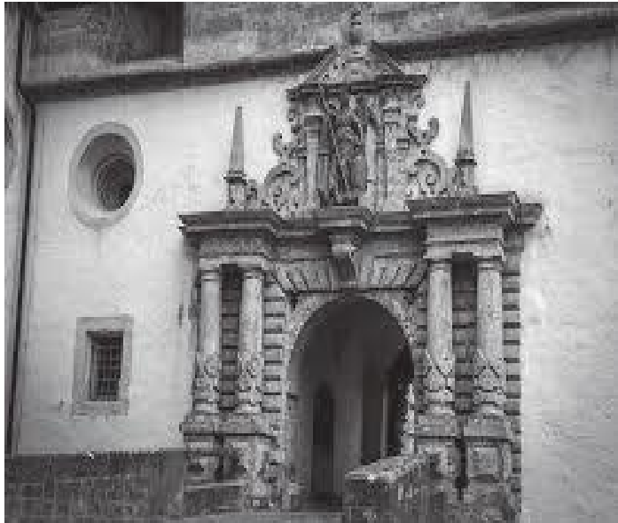
किल्लाको चोकभित्र पस्ने मुख्य ढोका