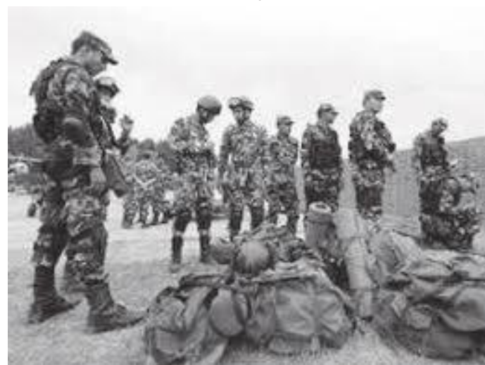
joint military exercises