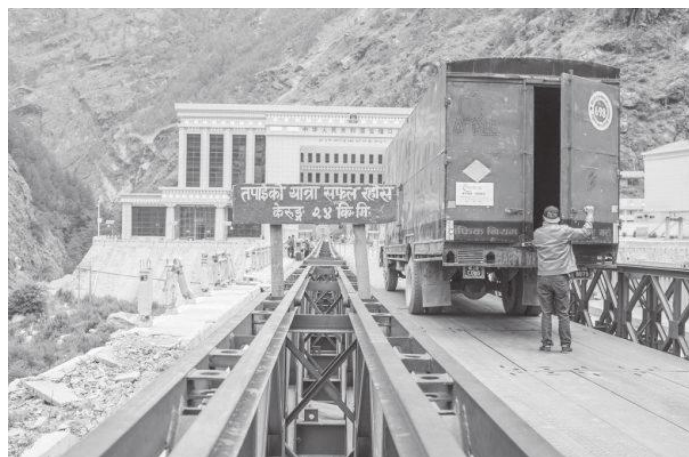
way to tibet

group of tourists in Nepal. They could flood the area if these rail lines come up.