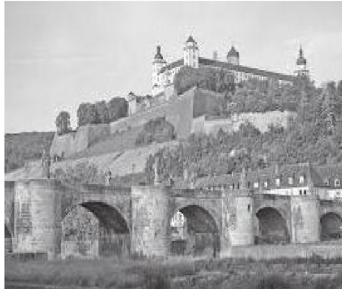
पुरानो पुलसहित मारियनवुर्ग किल्ला यस्तो देखिन्छ