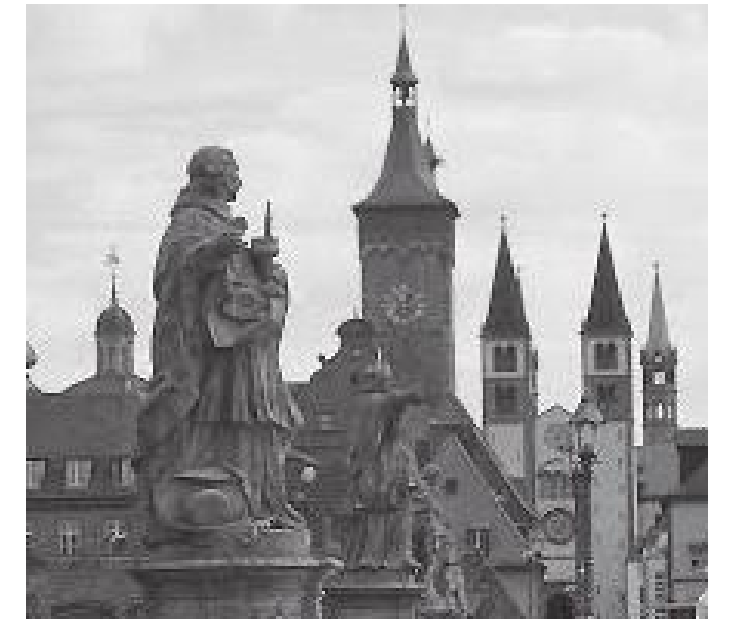
पुलमा ठडिएका सन्त र बादशाहहरूको सालिक

त्यहाँ बसेका रहेछन्। सन १८१४ मा यो किल्लालाई वभेरिया अधिराज्यले आफ्नो नियन्त्रणमा लिएपछि अस्ट्रो प्रसियन युद्धताका प्रसियन सेनाहरूले दक्षिणतिरबाट यस किल्लामाथि तोप र बम आक्रमण गरेका रहेछन्। यस आक्रमणसँगै यो किल्ला ब्यारेकमा परिणत हुन पुगेको रहेछ र सन १८७१