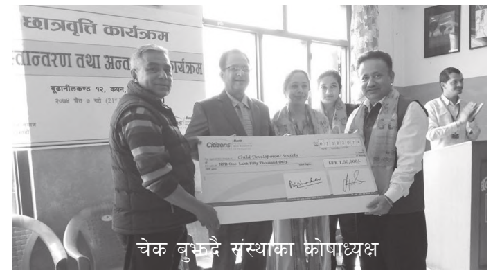
चेक वृद्धिद्वारा संस्थाका कोषाध्यक्ष