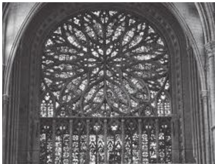
चर्चभित्र भ्यालको सिसामा गरिएको कलाकृति