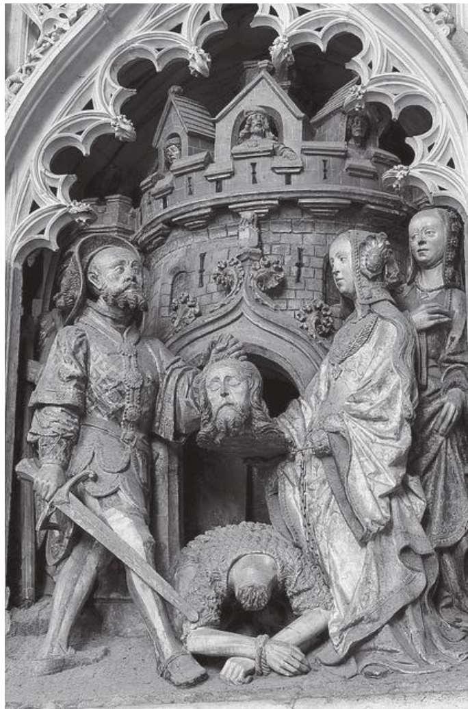
क्याथेड्रलमा रहेको जोन वाप्टिस्टको टाउको