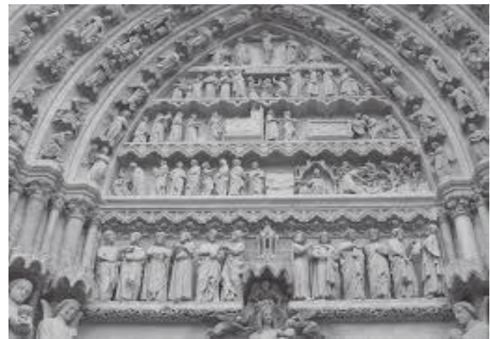
मूर्तिहरूले सजिएको क्याथेड्रलको पश्चिमी द्वार