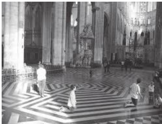
क्याथेड्रलभित्रको लेबेरिन्थ (प्रार्थना गर्दा घुम्नुपर्ने पथ)