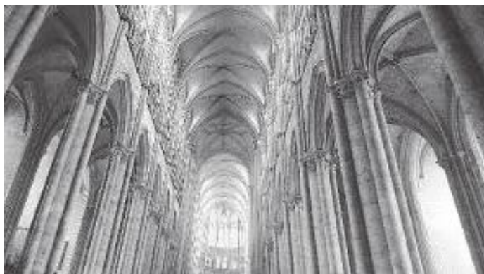
क्याथेड्रललाई भित्रबाट थाम्ने १२६ स्तम्भहरू