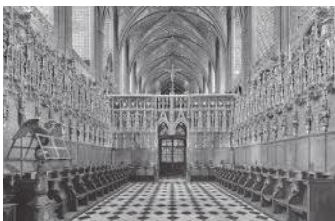
चर्चभित्र रहेको गानबजान गर्ने स्थल