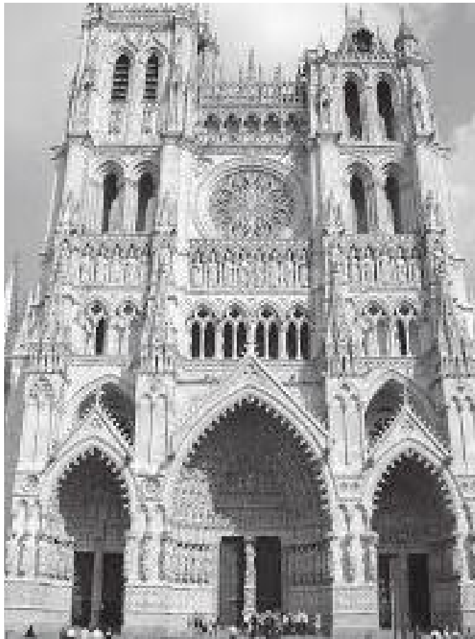
क्याथेड्रलको पश्चिमी मोहडा