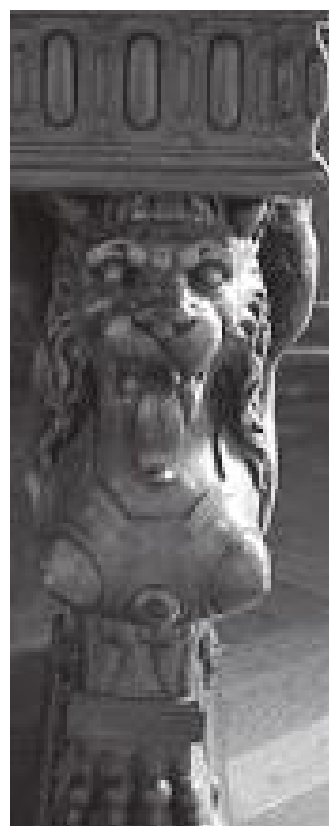
दरबारभित्र रहेको नरपशुको मूर्ति

फ्रान्सको सेनलिस सहरमा भएको विश्व सम्पदा सूचीमा परेको क्याथेड्रल अवलोकन गरेपछि हाम्रो यात्रा पुनः अगाडि बढ्यो । यस क्रममा हामी रातिको १० बजेतिर पेरिस पुग्यौं । पेरिस यो दोस्रो पटक भएको हुँदा मैले त्यहाँ हेर्नुपर्ने केही कुरा थिएन । आइफिल टावरको वरिपरि घुमेर हामी पुनः हाम्रो कारमा फर्क्यौं र क्याम्पिङ साइट खोज्न