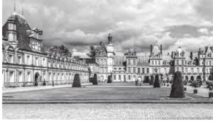
फोन्टेनब्लोको बगैचासहितको दरबार