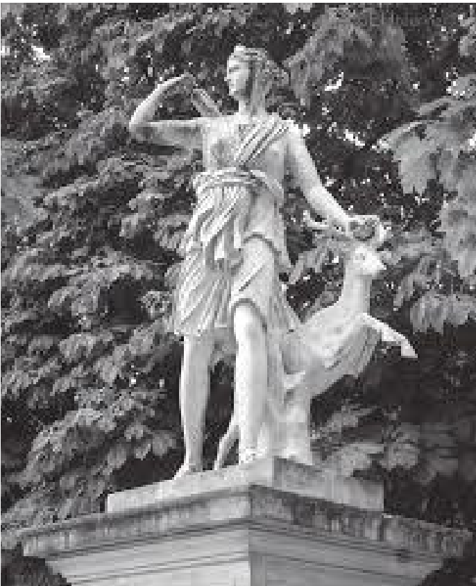
दरबारको बगैचामा रहेको डायनाको मूर्ति