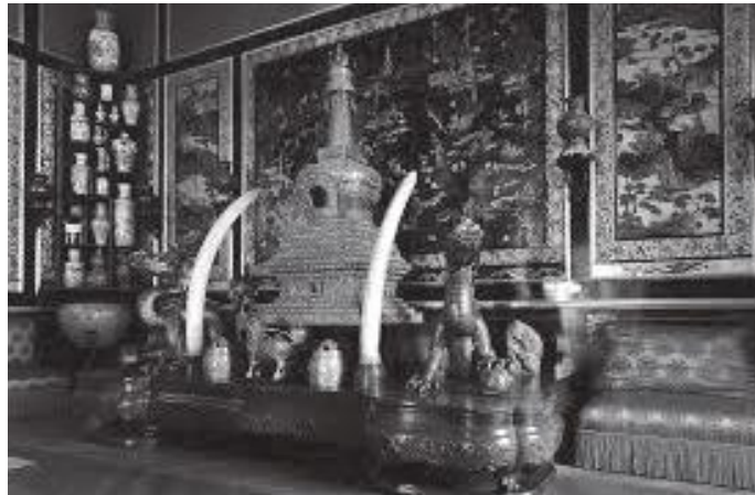
दरबारभित्रका चाइनिज म्युजियम