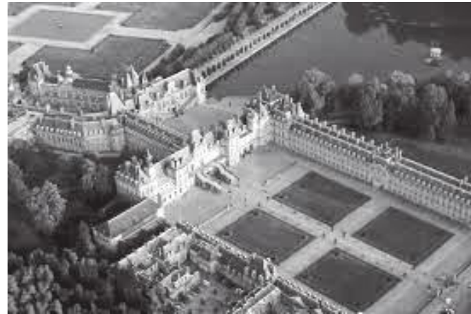
माथिबाट हेर्दा देखिने दरबार र बगैचा