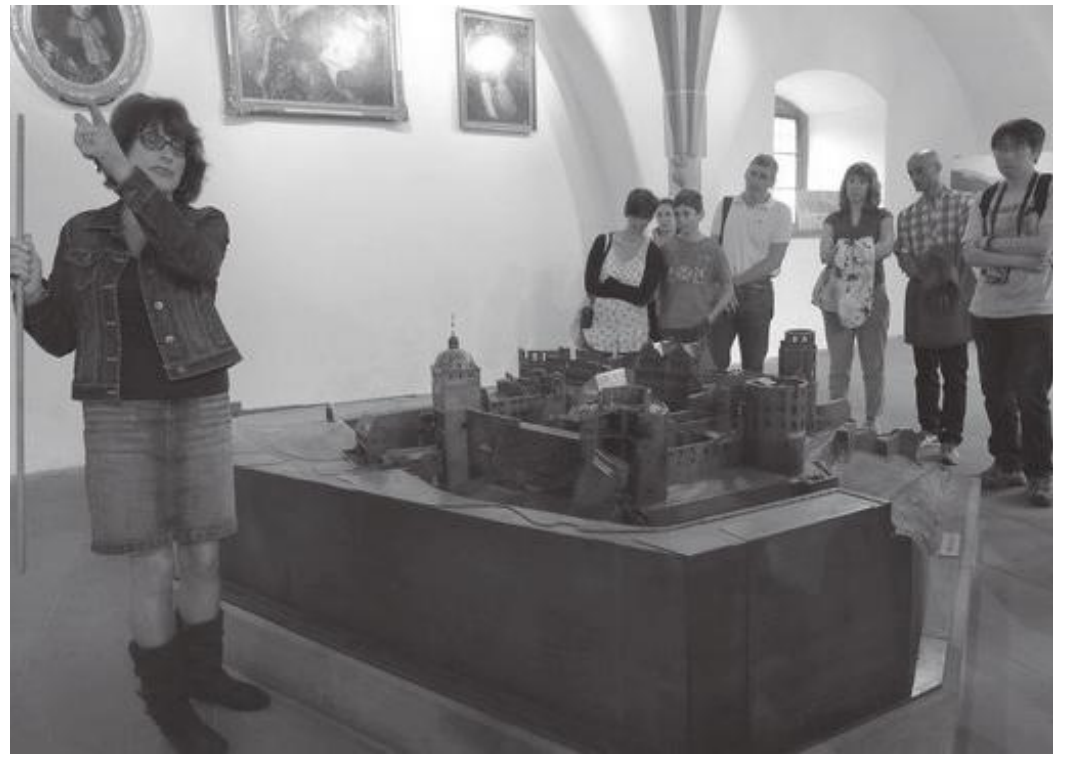
दरबारभित्रको प्रदर्शनी कक्ष