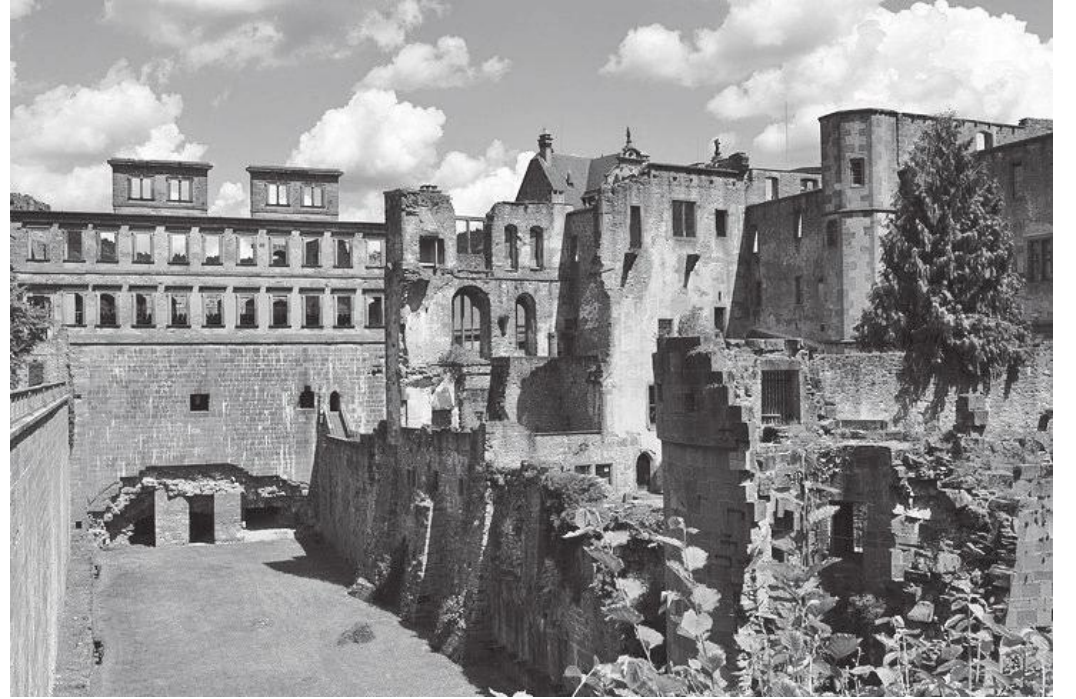
दरबारको संरक्षित भग्नावशेष