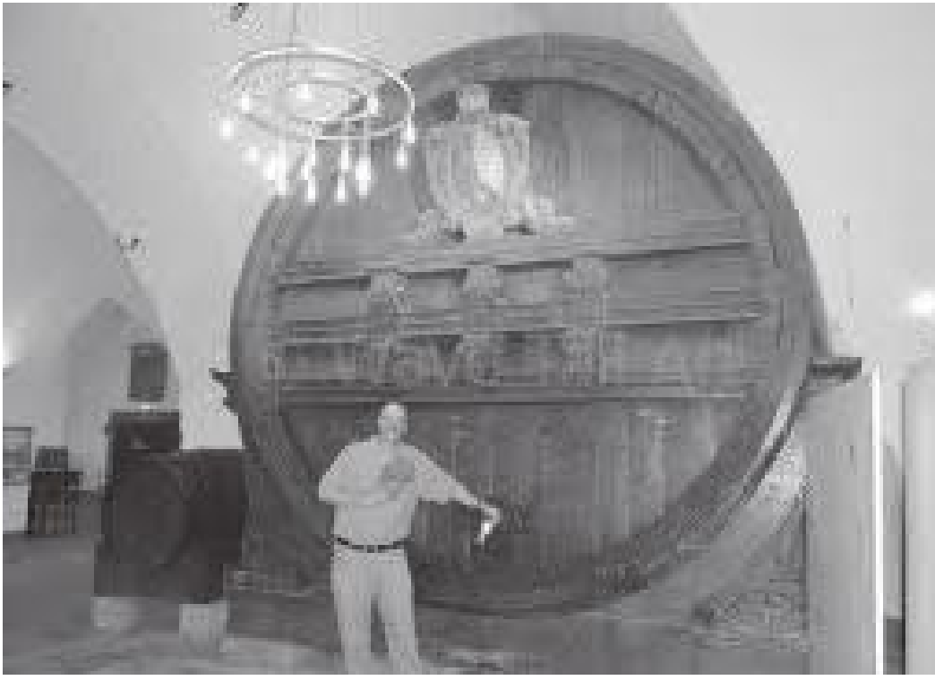
विश्वकै सबैभन्दा ठूलो अंगुरको रक्सी राख्ने ढ्वाङ (बेरेल)