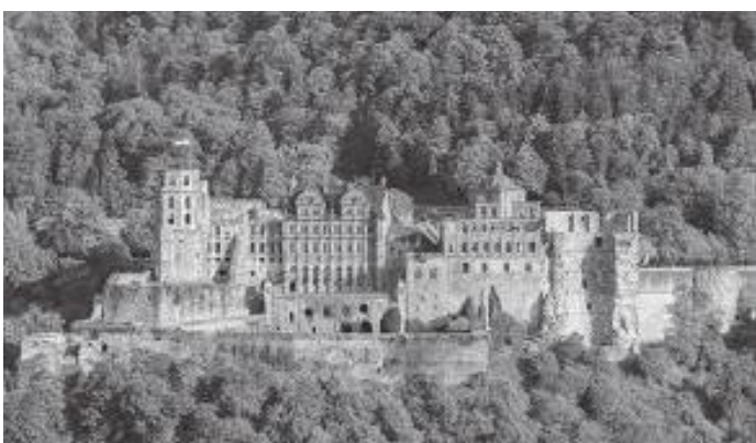
परबाट हेर्दा हाइडेलबर्ग दरबार यस्तो देखिन्छ