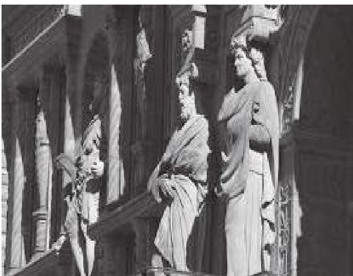
दरबारका भित्री भागका सुन्दर मूर्तिकलाहरू