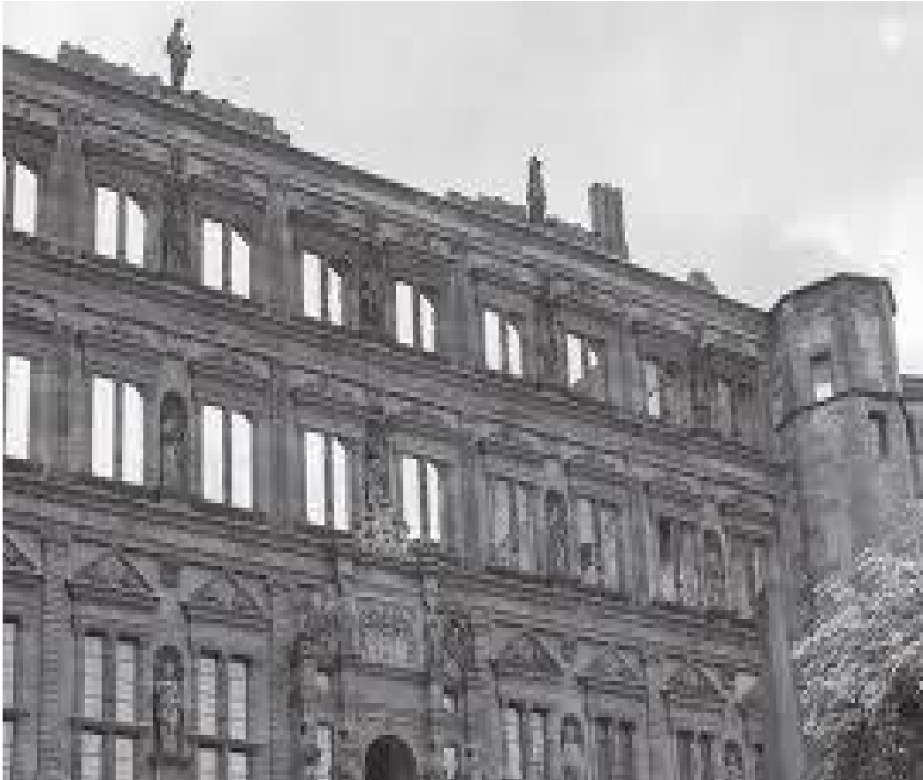
दरबारको ओटहाइनरिख भवनको पगन मोहोरा यस्तो देखिन्छ