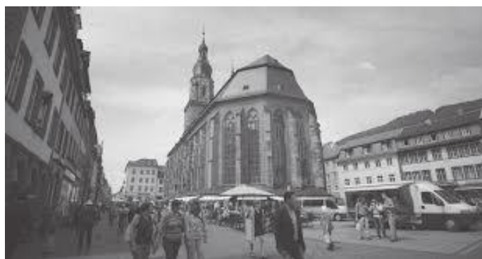
सहरको मुटुमा रहेको हाइलिगगाइष्ट चर्च