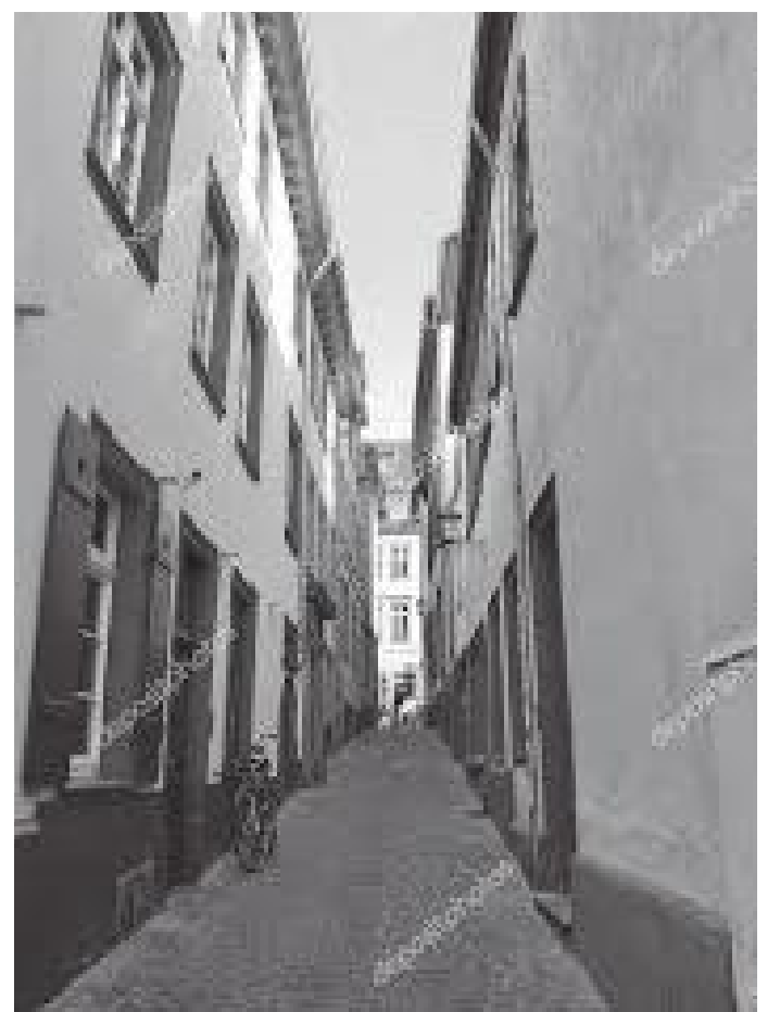
सहरभित्रका सफा सुन्दर पुराना गल्लीहरू

पैदलै हिँड्दै जाँदा उच्च शिक्षाको लागि विश्वकै नामुद रुपरेख्ट काल विश्वविद्यालयको भवन अवलोकन गर्ने मौका पर्दो रहेछ। अझ अगाडि बढदा हाइडेलवर्गकै पुरानो १३औं शताब्दिमा बनेको गोथिक शैलीको अति सुन्दर चर्च उभिएको देखिँदो रहेछ। हाइडेलवर्ग शहरको विश्व लोकप्रियतालाई थोरै शब्दमा वर्णन गर्दा यसलाई विज्ञान र अनुसन्धान, साहित्य र कलाको शहर, जर्मनी पुरानो विश्वविद्यालयको शहर भन्दा रहेछन्। यसलाई अन्तर्राष्ट्रिय ख्यातिप्राप्त शहर यसकारण पनि भनिंदो रहेछ, की ५६ हजार जनसंख्या भएको यो शहर अवलोकन गर्न वर्षको एक करोड असी लाख पर्यटकहरू यहाँ आउँदा रहेछन्। शहर भएर पनि हरियालीपूर्ण, प्राकृतिक छटाले भरिएको, उच्च शहरीया जीवनस्तर भएको, जनसंख्या जस्को ठूलो अंश विद्यार्थी, शिक्षक, विचारक र अनुसन्धानकर्ता भएको कारण यस शहर दिगो विकास, वातावरण संरक्षणका लागि जर्मनीकै एक उत्कृष्ट शहरमध्ये एकमा आउँदो रहेछ। दोस्रो विश्वयुद्धकालमा ध्वस्त हुनबाट बचेको कारणले गर्दा पनि यस शहरको प्राचीनताले विश्व महत्व पाएको रहेछ।