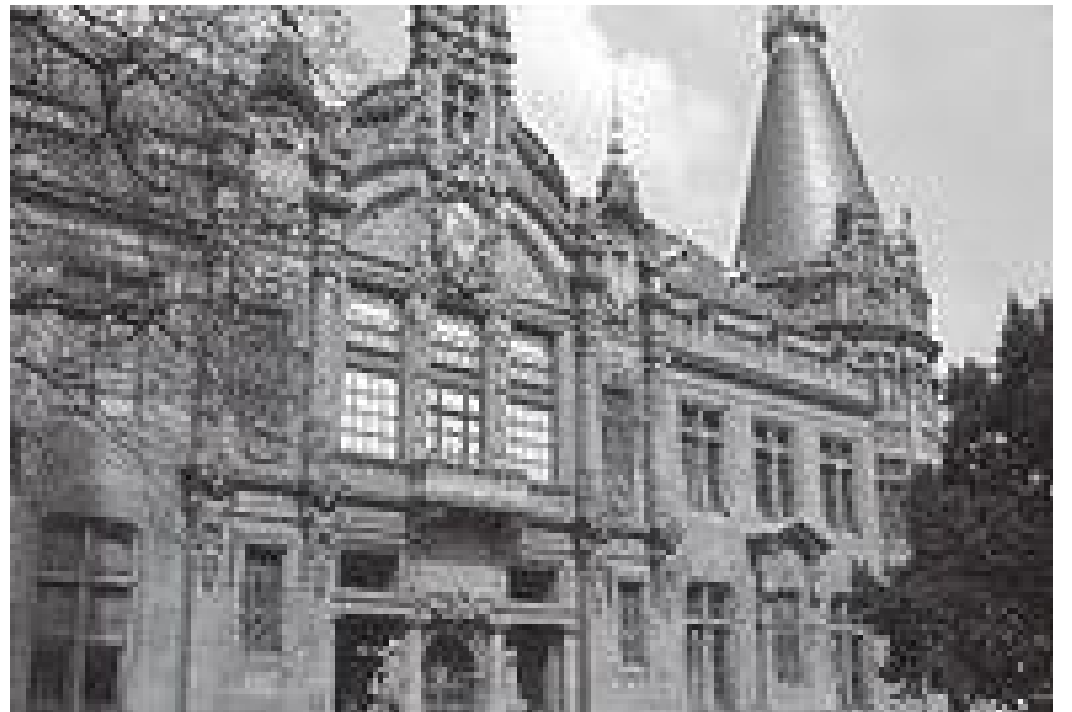
हाइडेलवर्ग विश्वविद्यालयको अगाडिको मोहोडा