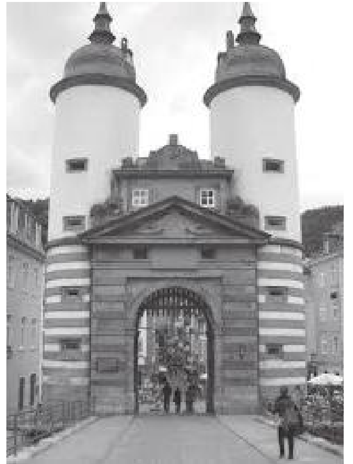
पुरानो पुल छिर्ने ढोका अगाडिबाट यस्तो देखिन्छ