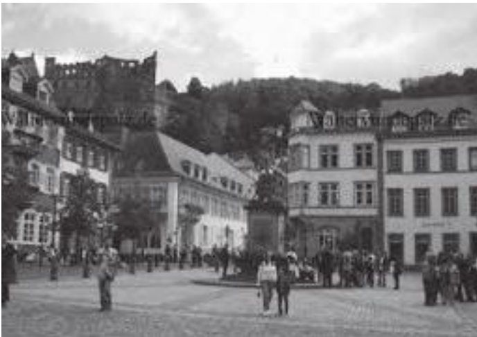
हाइडेलवर्ग सहरको मुख्य स्थल कोर्न मार्केट