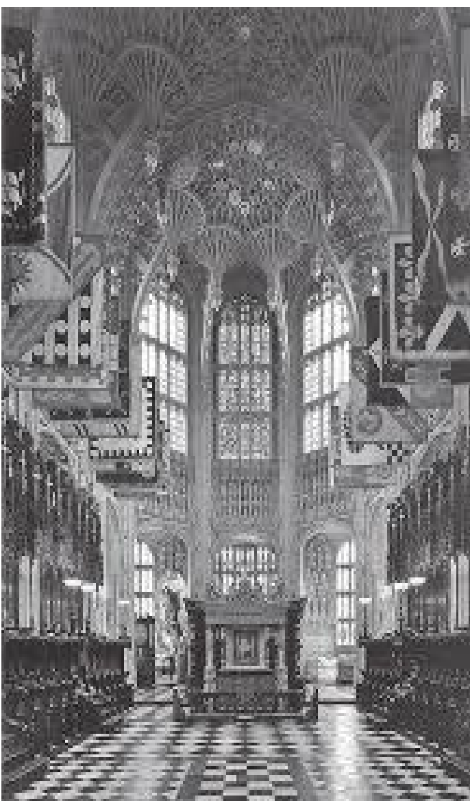
एब्बिका गजुरहरू भित्रबाट हेर्दा