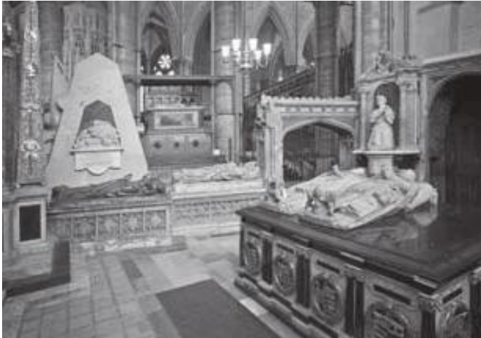
एब्बिभित्र रहेका राजारानीका चिहानहरू