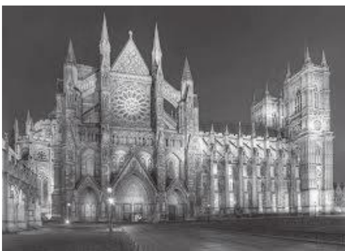
एब्बिको अगाडिको मोहडा

सुदूर उत्तरी फ्रान्सस्थित मेट्र च सहर र त्यस सहरको वगैचा अवलोकन गरेपछि हामी हाम्रो गन्तव्यतिर हानिने क्रममा फ्रान्सको कालेए तटमा आइपुग्यौं । त्यतिखेर फ्रान्स र बेलायतलाई जोड्ने इंगलिस च्यानलमा समुद्रमुनि बनाइने लागेको टनेल निर्माणाधीन अवस्थामा भएको हुँदा हामी समुद्री वारपार गर्ने जहाज फेररी चढेर कालेएबाट बेलायतको डोभर पुग्यौं । त्यतिखेर विहानको दश बजेको थियो । डोभरमा