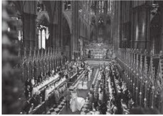
एब्बिको विशाल प्रार्थना कक्ष