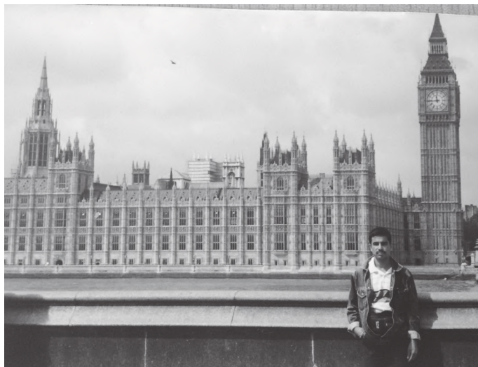
वेस्ट मिनिस्टर संसद भवनअगाडि सुरेन्द्र सन् १९८९ मा